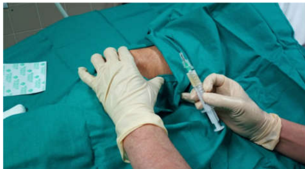
Figura 1: Vía antero-externa para infiltración de la rodilla.

Posteriormente se realizó una infiltración utilizando la vía antero externa sobre el fondo de saco de la articulación de la rodilla (Fig. 1). Esta maniobra se repitió en 2 ocasiones más, espaciadas entre 4 y 6 semanas.