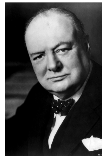
DISCURS WINSTON CHURCHILL (1946)

“No hi haurà pau a Europa si els estats es reconstrueixen sobre la base de la sobirania nacional (...) Els països d'Europa són massa xicotets per a assegurar als seus pobles la prosperitat i els avanços socials indispensables. Els estats d'Europa han de formar una federació ”