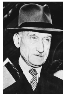
LA DECLARACIÓ DE SCHUMAN (1950)

“Existeix un remei que... en pocs anys podria fer a tota Europa... lliure i... feliç. Consisteix a tornar a crear la família europea, o almenys la part d'ella que puguem, i dotar-la d'una estructura sota la qual puga viure en pau, seguretat i llibertat. Hem de construir una espècie dels Estats Units d'Europa ”