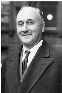
JEAN MONNET (1943)

“No hi haurà pau a Europa si els estats es reconstrueixen sobre la base de la sobirania nacional (...) Els països d'Europa són massa xicotets per a assegurar als seus pobles la prosperitat i els avanços socials indispensables. Els estats d'Europa han de formar una federació ”