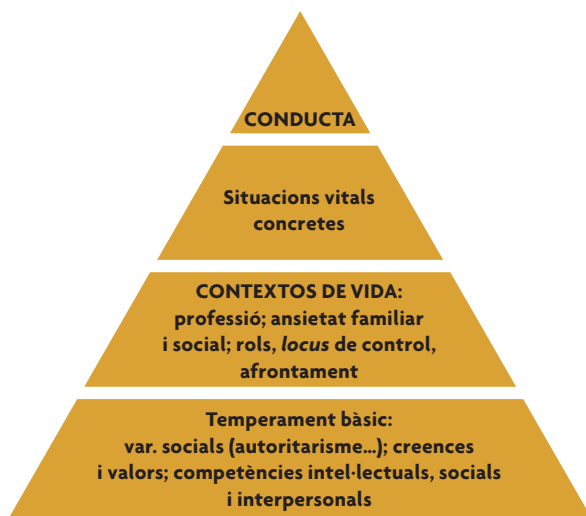
Figura 2. Estructura de la personalitat dels individus.