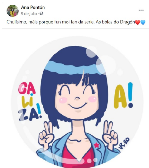
Imagen 7. Post de Ana Pontón en Facebook referente a su figura y la serie Bola de Dragón.

La imagen incorpora la palabra Galiza (topónimo de Galicia en gallego habitual para el nacionalismo) en los colores empleados por el BNG para la campaña, así como un pin de la estrella roja que forma parte de la simbología de la formación. El texto previo es breve y posee un adjetivo calificativo “chulísimo”, que refuerza el contenido posterior sobre que la candidata era fan de la serie, sin menciones a cuestiones ideológicas. De este mensaje se deduce un sentido que trata de brindar una percepción juvenil de Pontón, con un estilo ligero dotado de corazones, uno de ellos aplicando el color corporativo del BNG.