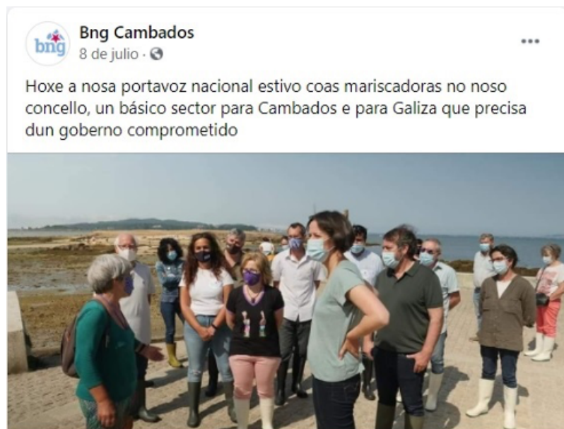
Imagen 10. Publicación del BNG de Cambados sobre la visita de Pontón a unas mariscadoras.

El estilo de la publicación es clásico, sin figuras retóricas, y probablemente suponga la pieza más crítica con el actual gobierno de la Xunta de las aquí analizadas, al dejar entrever de forma velada que las demandas del sector del mar no están cubiertas. El sentido de este mensaje se orienta a transmitir una presencia de la candidata a pie de terreno, una actividad que las agrupaciones locales del BNG se encargan de difundir.