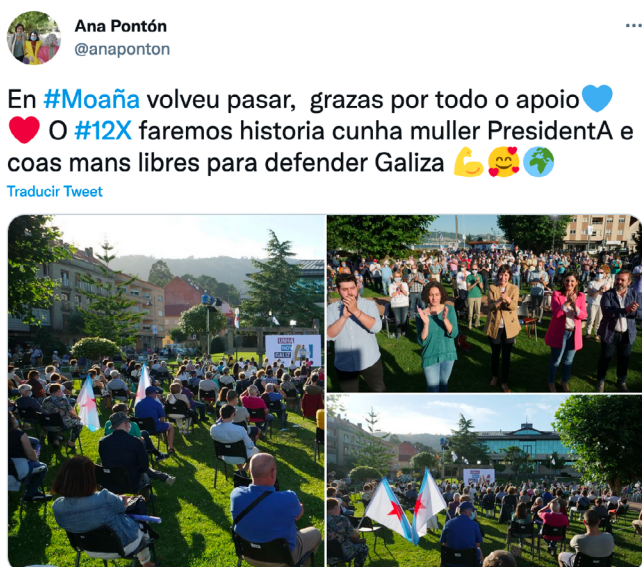
Imagen 9. Tuit de Pontón acerca de un evento público en Moaña (Pontevedra).

El tuit de Pontón se estructura en torno a dos frases. La primera agradece el apoyo y realiza una elipsis sobre Moaña, dando a entender que en esta villa se ha repetido la gran asistencia a un mitin ya vivida en otros puntos de la comunidad autónoma. Por su parte, la segunda oración habla de hacer historia el día de las elecciones. El sentido del mensaje es informar de lo sucedido en un acto público y apelar a la movilización, a través de varias imágenes que atestiguan el nivel de apoyo.