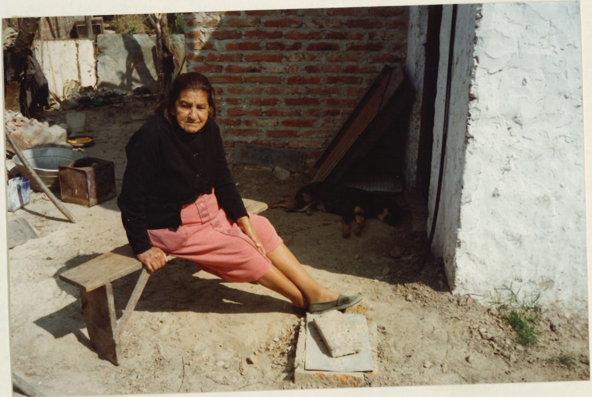
Emérita y su perro