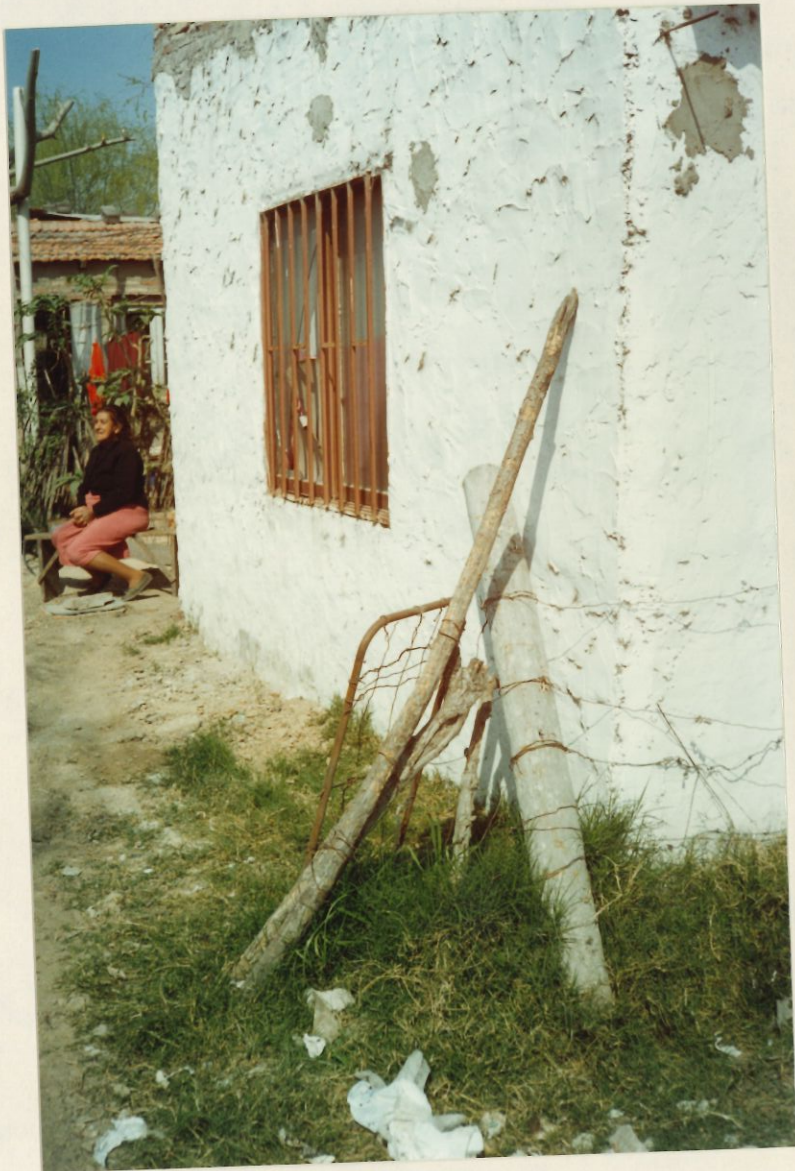
la casa de Emérite (construida x los "Sin Techo")