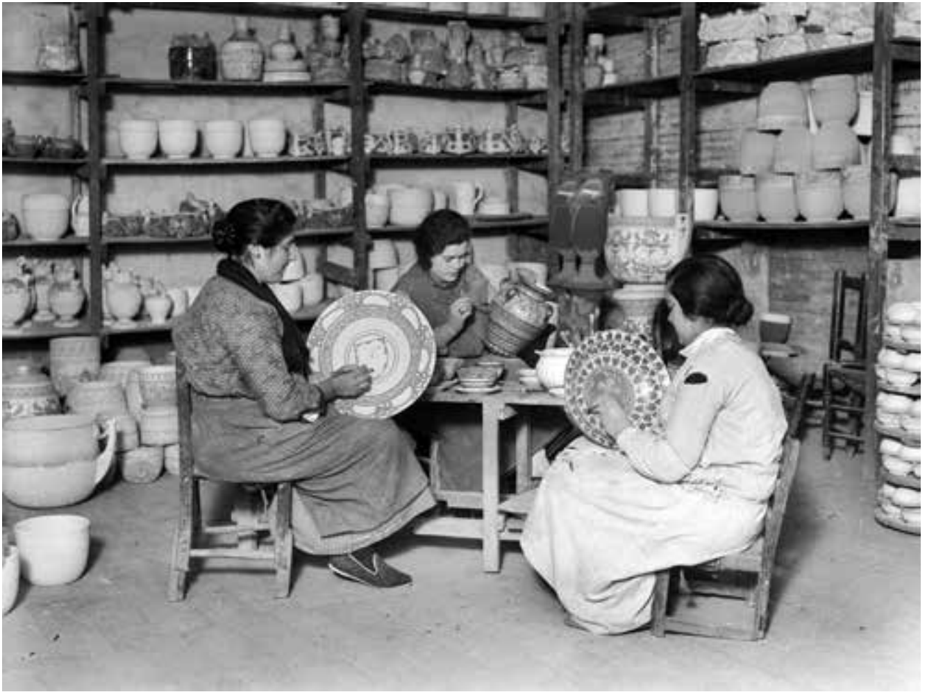
Taller de ceràmica. Abril de 1935