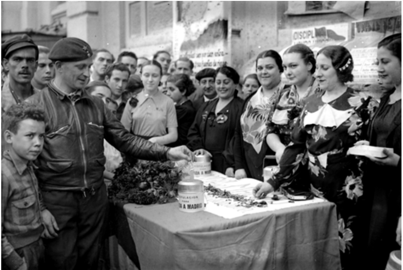
Capta per a ajudar Madrid pels carrers de València. Maig de 1938