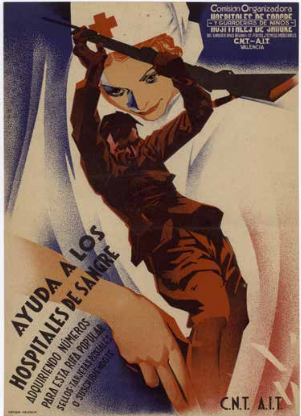
A C.N.T. - A.I.T., 1936, València, cartell. Biblioteca Valenciana Nicolau Primitiu