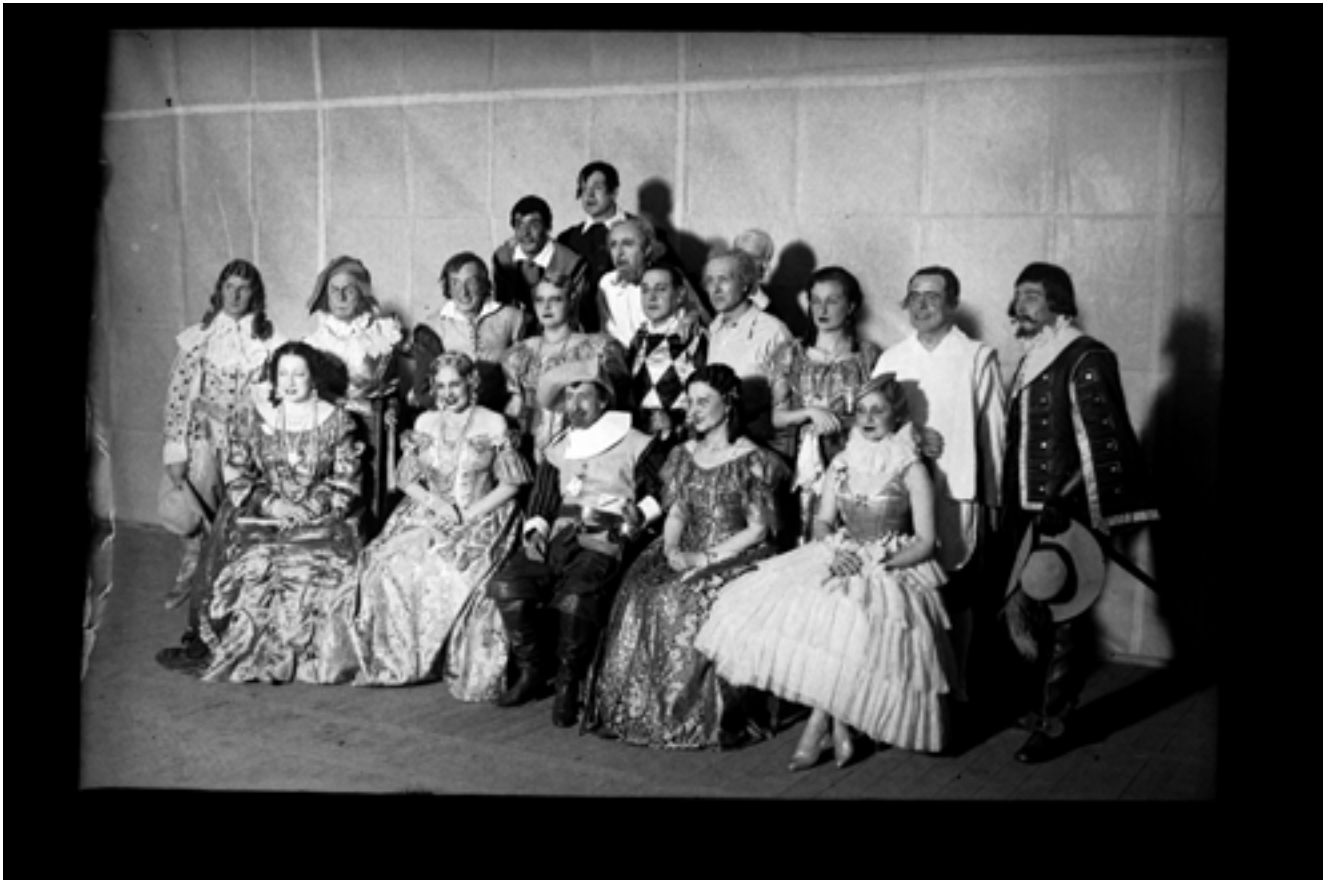
Fotografia de grup amb actors i actrius de Los intereses creados de Jacinto Benavente al teatre Principal de València. Durant la guerra, fou una de les obres més representades a la ciutat, amb 49 sessions. El mateix premi Nobel participà com actor en algun muntatge, ja que visqué a València, i fou homenatjat per la República repetidament. Després de la victòria de Franco al·legà que tot el seu suport l'havia donat amenaçat de mort. Agost de 1938