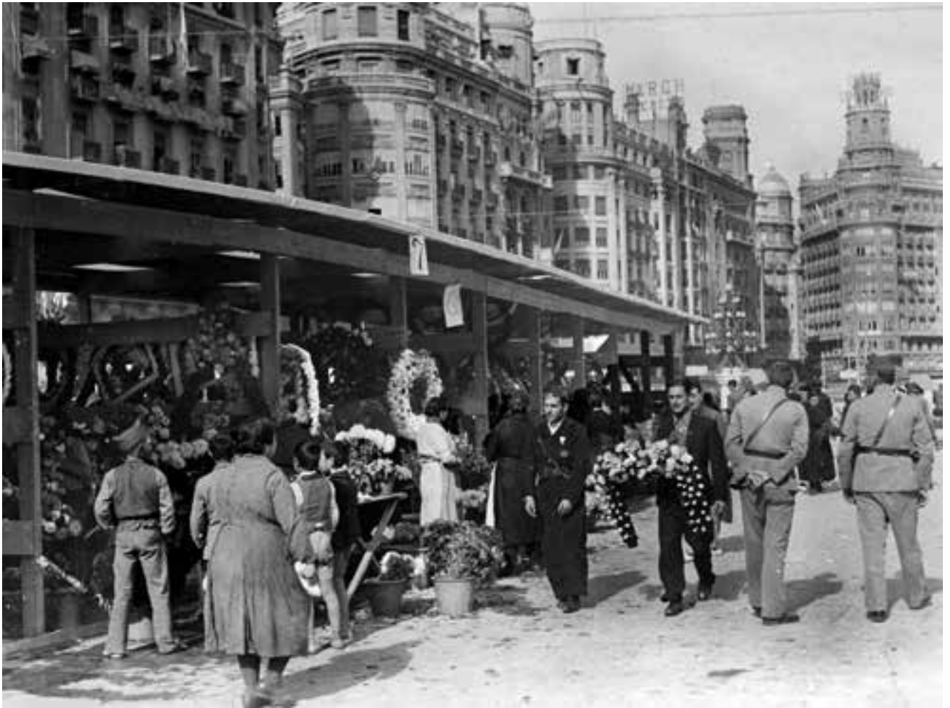
Mercat de flors a la plaça d'Emilio Castelar. Novembre de 1937