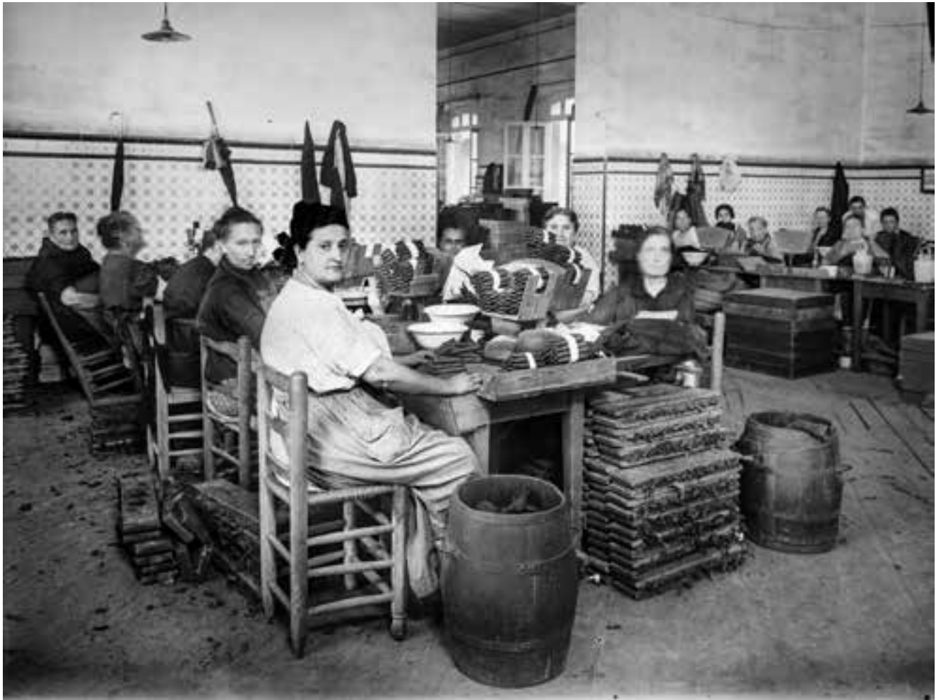
Empleades plegant cigars en la fàbrica de tabacs de València. Juny de 1932