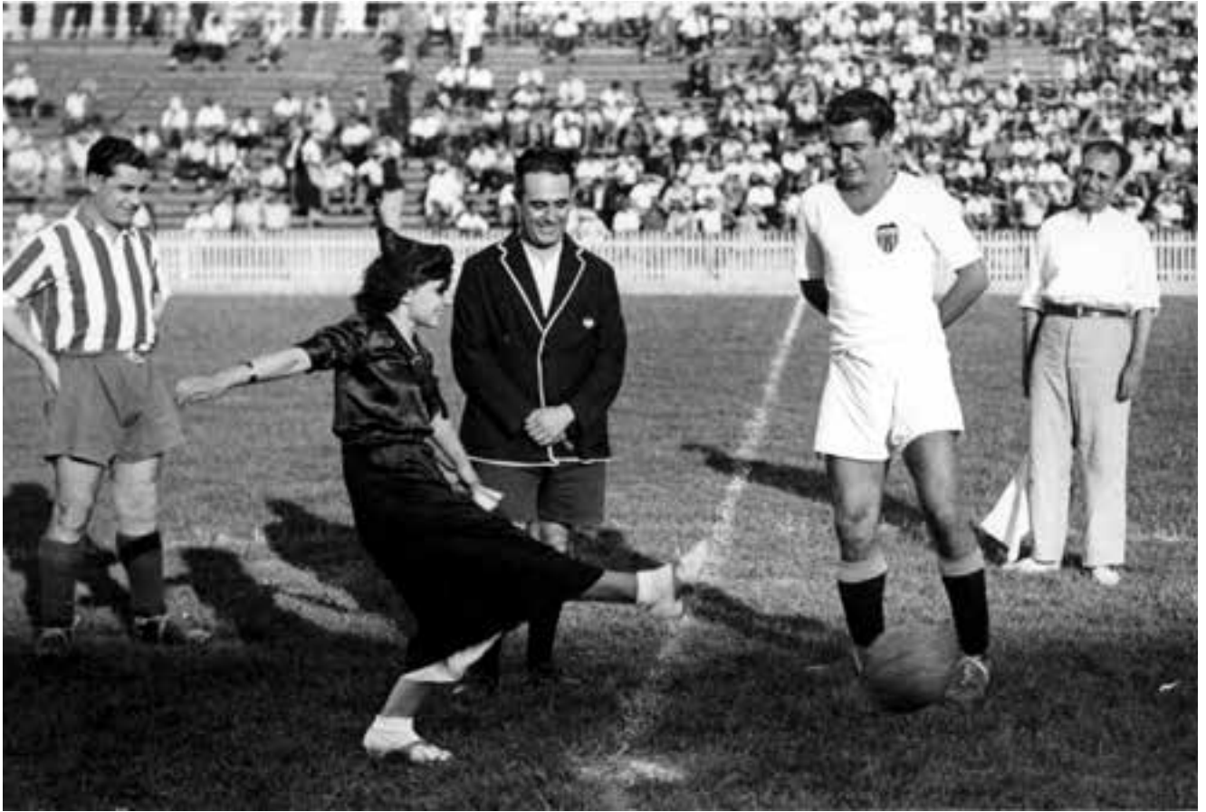
Una miliciana fa la treta d'honor durant el partit entre el València CF i l'Atlético de Madrid organitzat per Izquierda Republicana a benefici dels xiquets orfes de milicians. Març de 1937