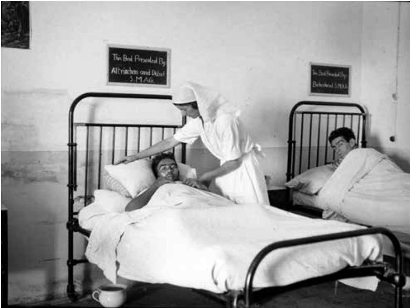
Infermeres atenent combatents estrangers. Juny de 1938