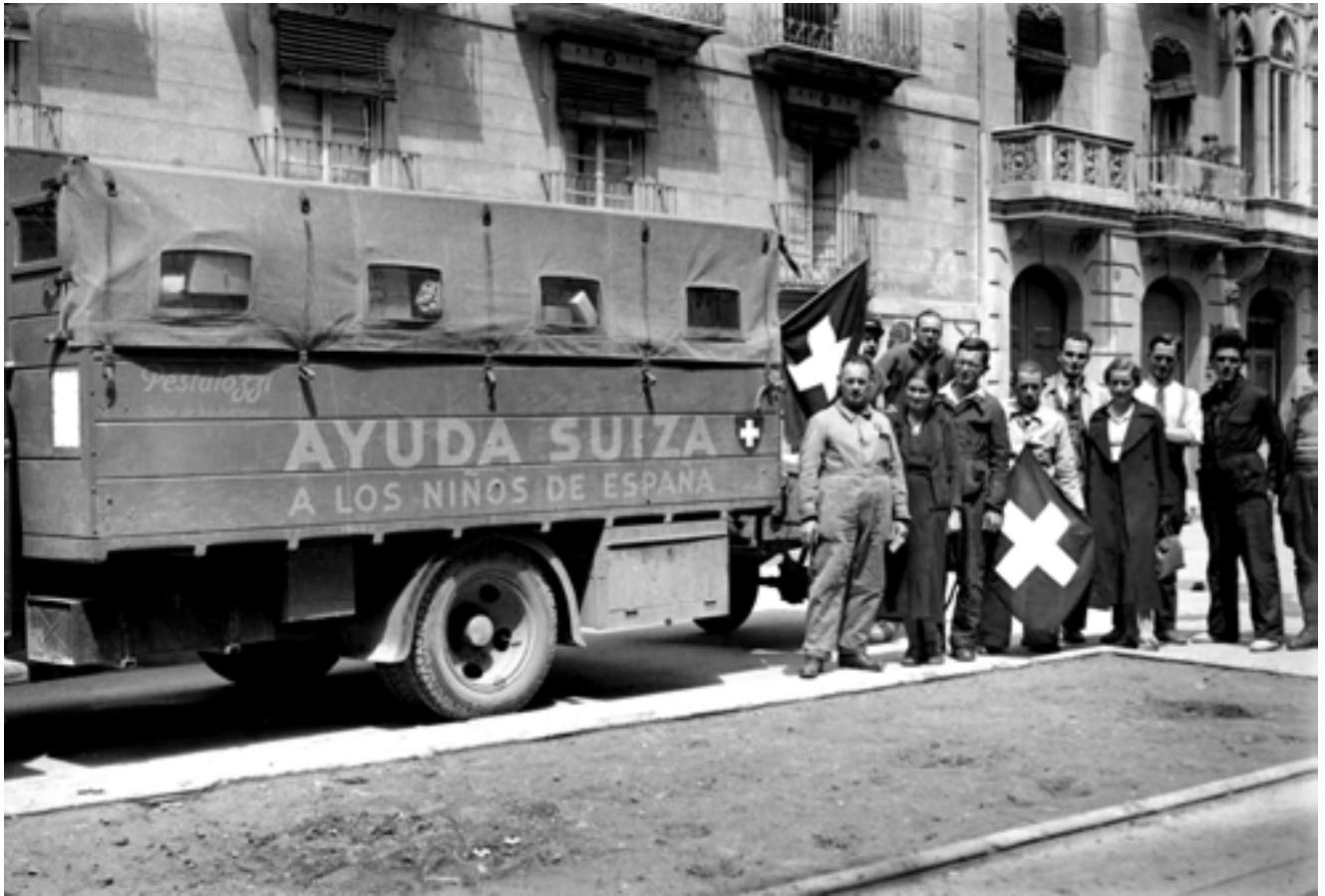
Lliurament de material del Comitè d'Ajuda Suïssa als xiquets d'Espanya. Març de 1938