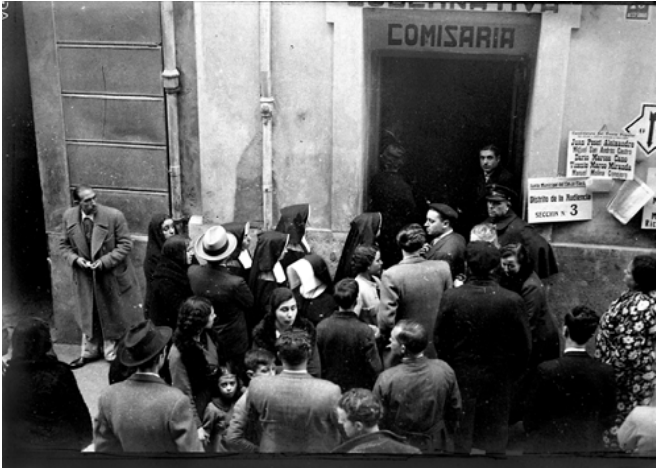
Votació en les eleccions municipals. La dona participa activament en la vida política republicana, el seu vot és decisiu en la victòria del Front Popular. Febrer de 1936