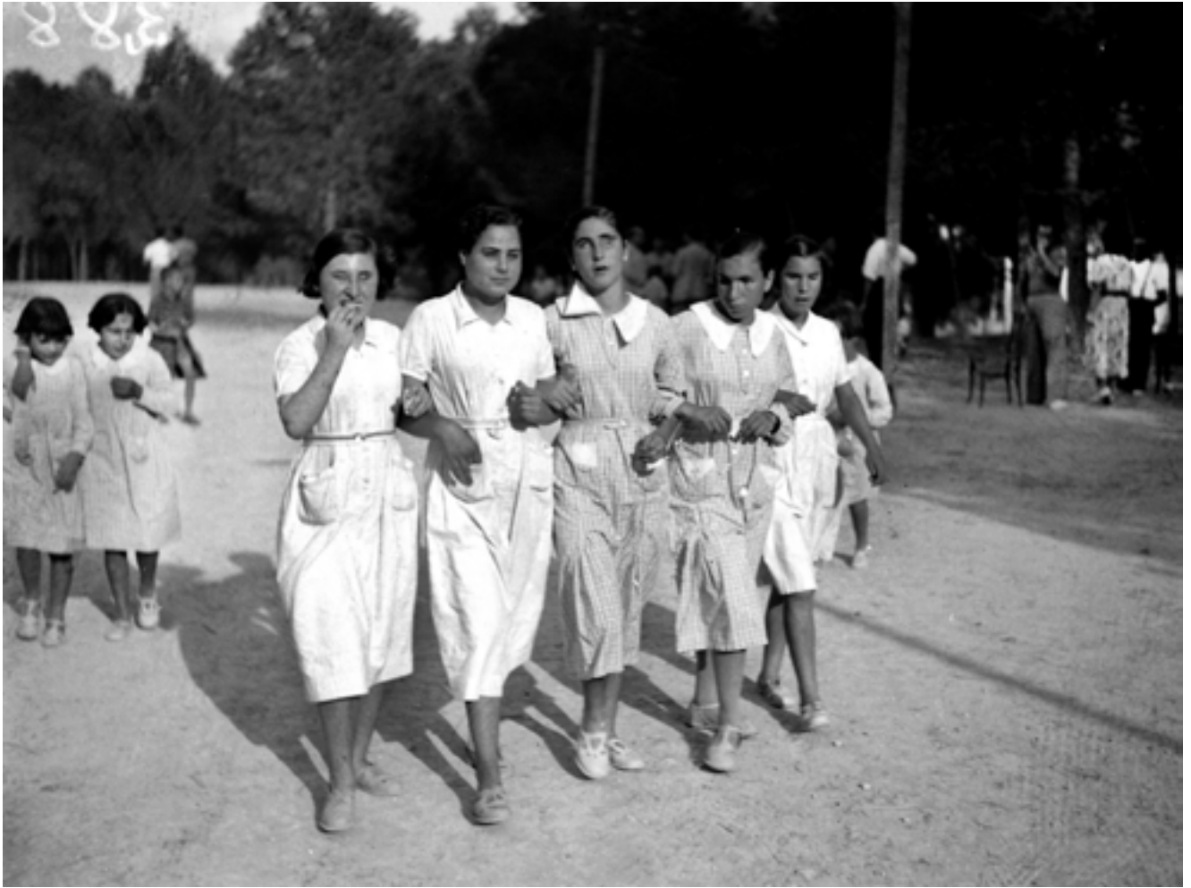
Xiquets i xiquetes cecs evacuats de Chamartín de la Rosa (Madrid) a València. Passegen del bracet. Setembre de 1937