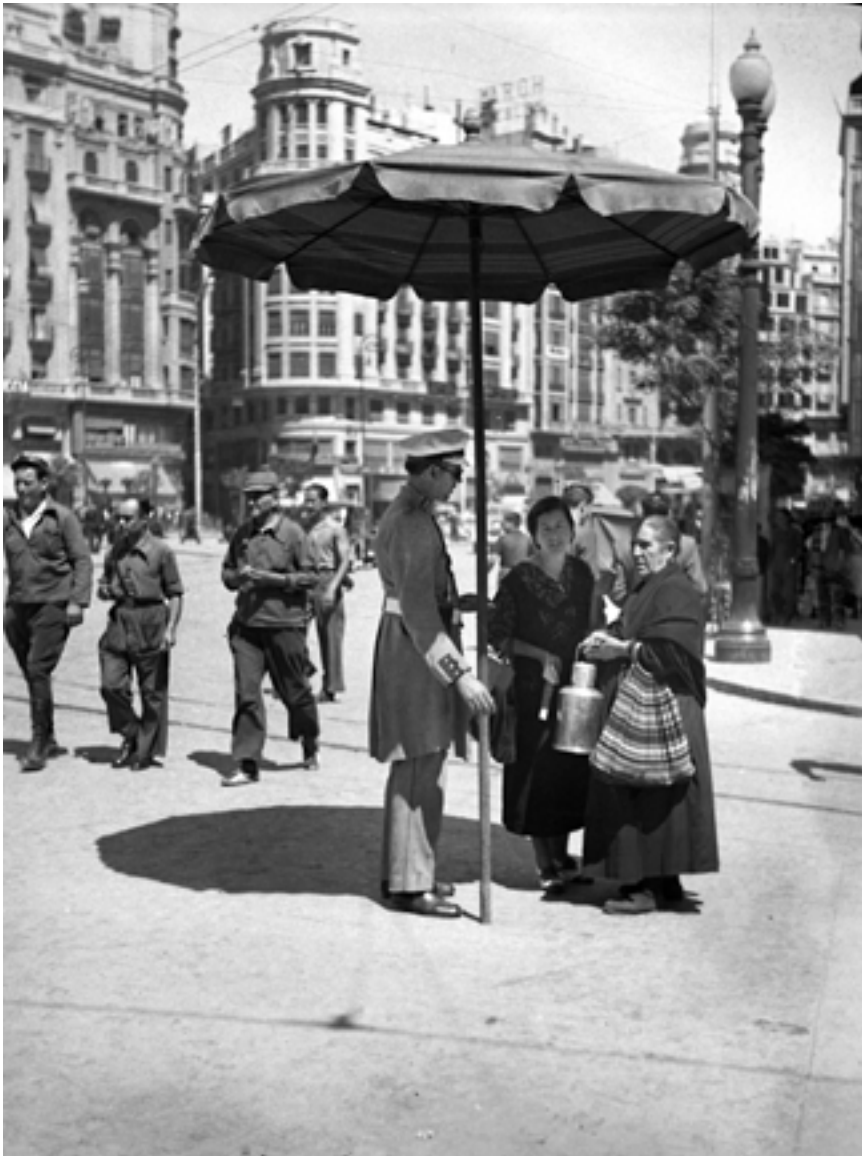
Agent del transit al bell mig de la plaça d'Emilio Castelar, baix d'un gran para-sol i atenent les preguntes dels evacuats de Madrid. Juliol de 1937