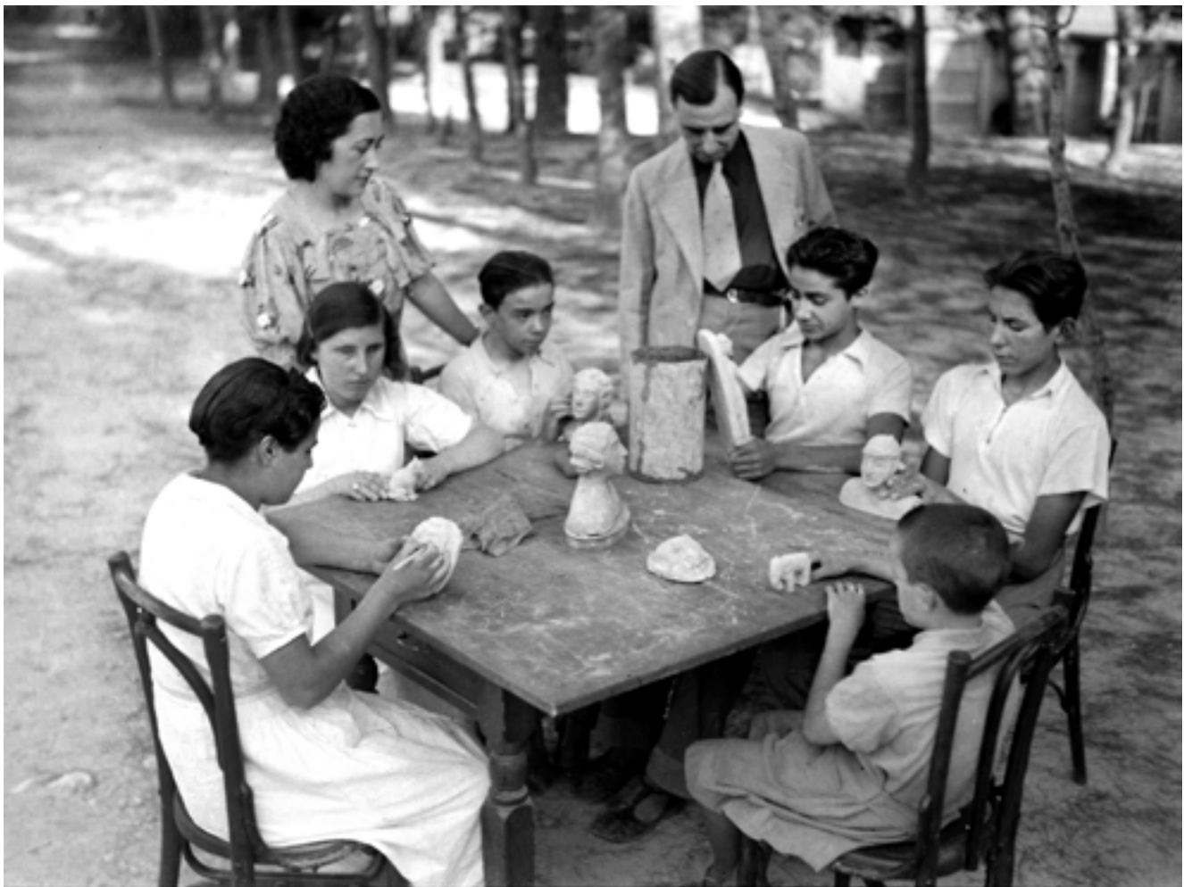
Xiquets i xiquetes cecs evacuats de Chamartín de la Rosa (Madrid) a València. Fan treballs de modelat en fang davant de la seua professora. Setembre de 1937