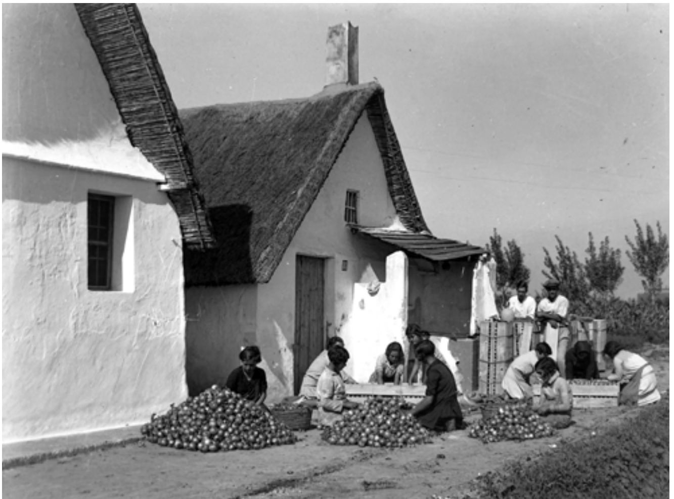
Dones netejant cebes davant d'unes barraques. Setembre de 1933