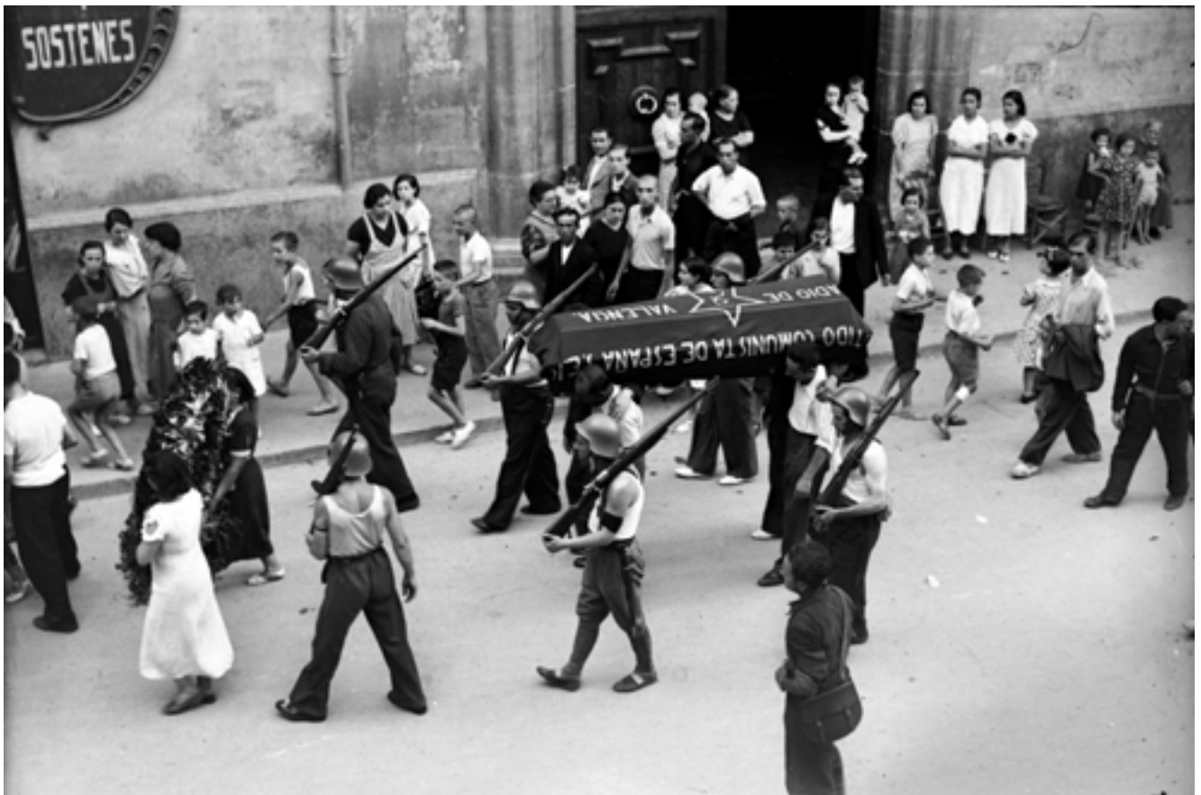
Enterrament d'un milicià pels carrers de València. Juliol de 1938