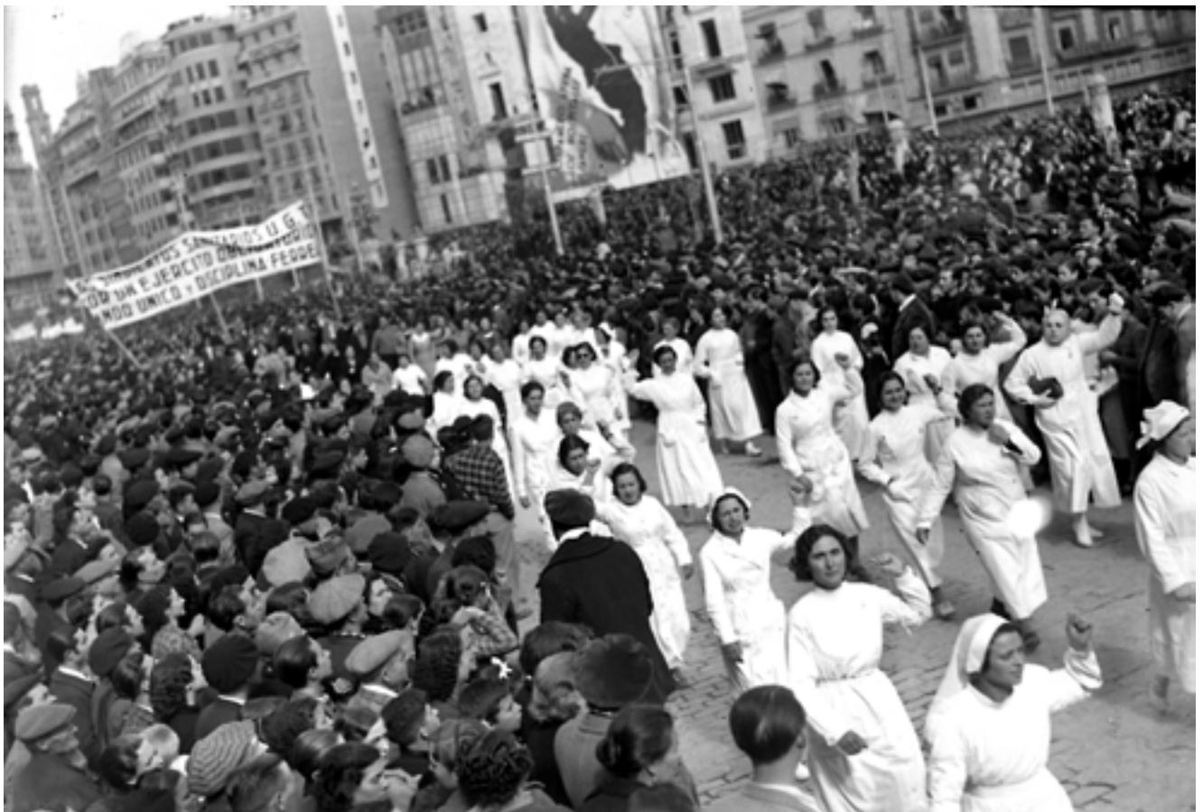
Manifestació de dones que recorregué els carrers de València per a demanar l'anada als fronts de batalla de tots els homes en condicions, i que en la reraguarda les dones ocupen els seus llocs i facen els treballs que aquestos deixen desatesos. Novembre de 1936