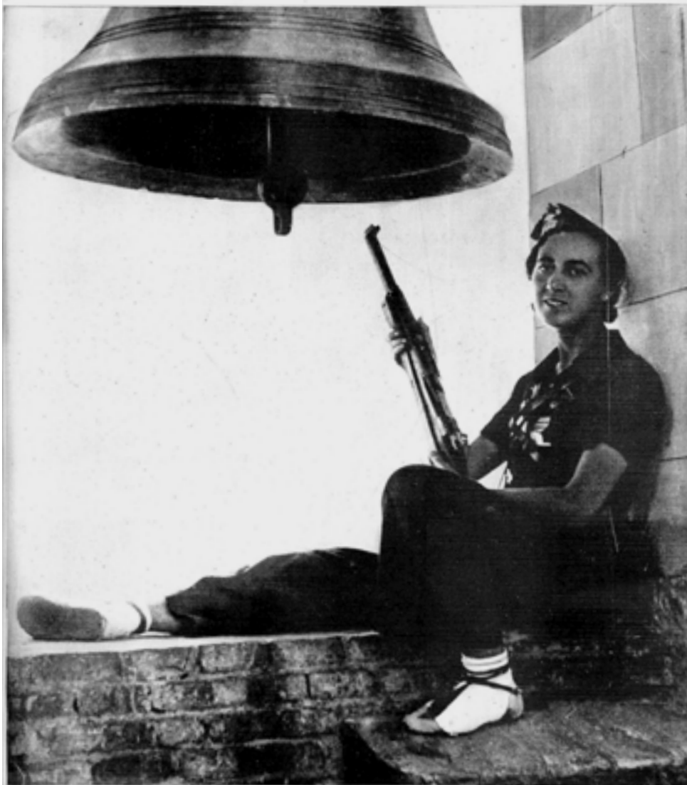
En el frente de Aragón

Una miliciana vigila el campo enemigo desde la torre de la iglesia de un pueblo aragonés ocupado por los nazis alemanes.