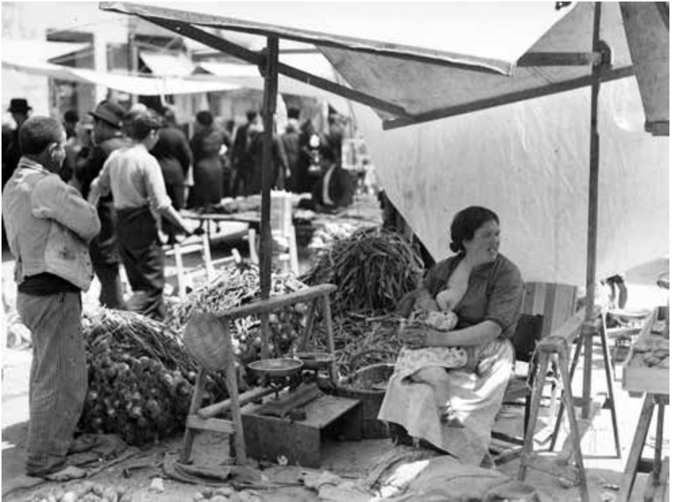
Venedora de cebes donant el pit al seu fill a la seua parada al carrer. juliol de 1935.