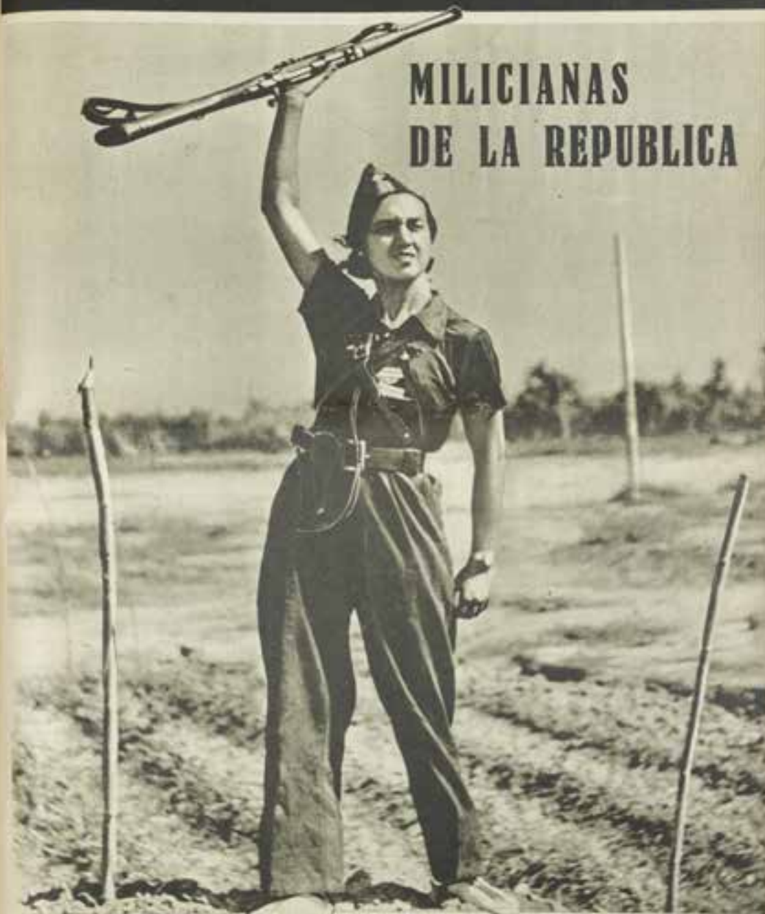
Foto: Juan Diego, agencias del Servicio (Foto: Iglesias, de Valencia) "Estar en acciones peligrosas constituye la esencia de nuestra actividad militar", declara una miliciana republicana.