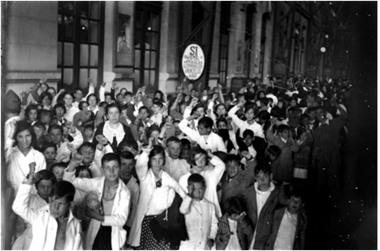
Arribada a l'Estació del Nord de València de dos mil fills de milicians procedents de Madrid. Setembre de 1936