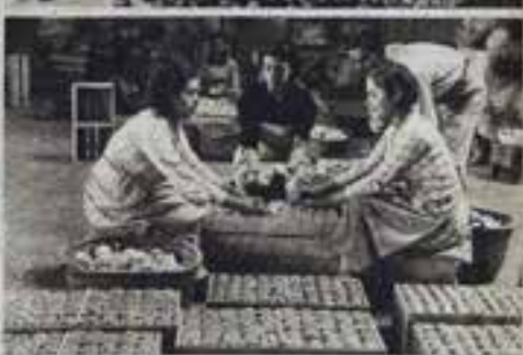
La recolección de la naranja, su transporte a los centros exportadores y su preparación—limpieza, selección y empaquetado del fruto—para el envío al extranjero, donde se cotiza mejor que la de cualquiera otro país, y donde se consigue en riqueza para la España que lucha por su libertad.

que los Estados Unidos consumen casi totalmente su cosecha, y nosotros exportamos el treinta por ciento. Y no podemos ni debemos dejar de exportar, porque si lo hicieramos, los países competidores ocuparían nuestro lugar.