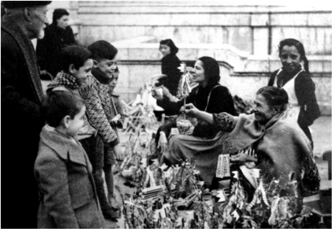
Mercat de Nadal. Desembre de 1934