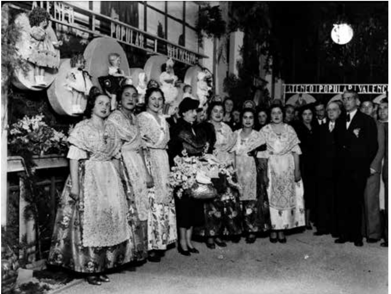
Exposició de nines amb motiu de la Festa del Xiquet a l'Ateneu Popular de València. Gener de 1938