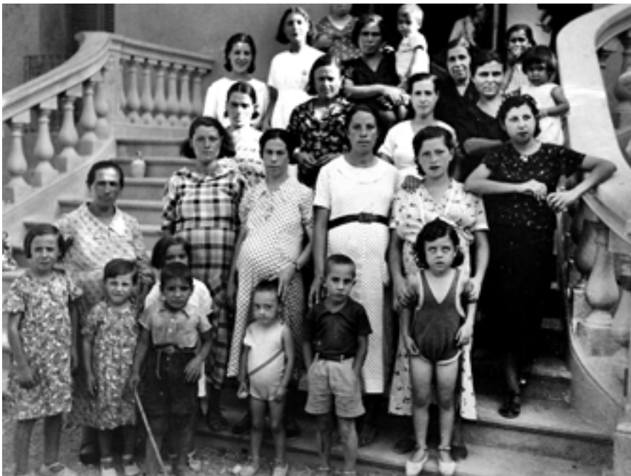
Alberg Maternal per a dones embarassades procedents de Madrid. Agost de 1937