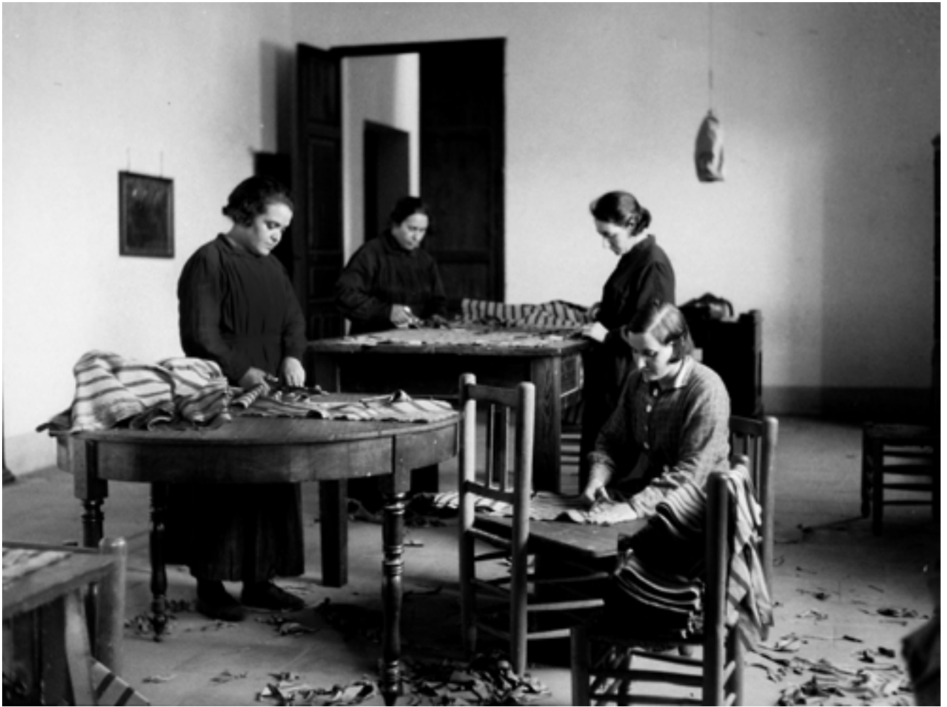
Religioses sense hàbit cosint roba per a Assistència Social. Convent de Santa Mònica a València.