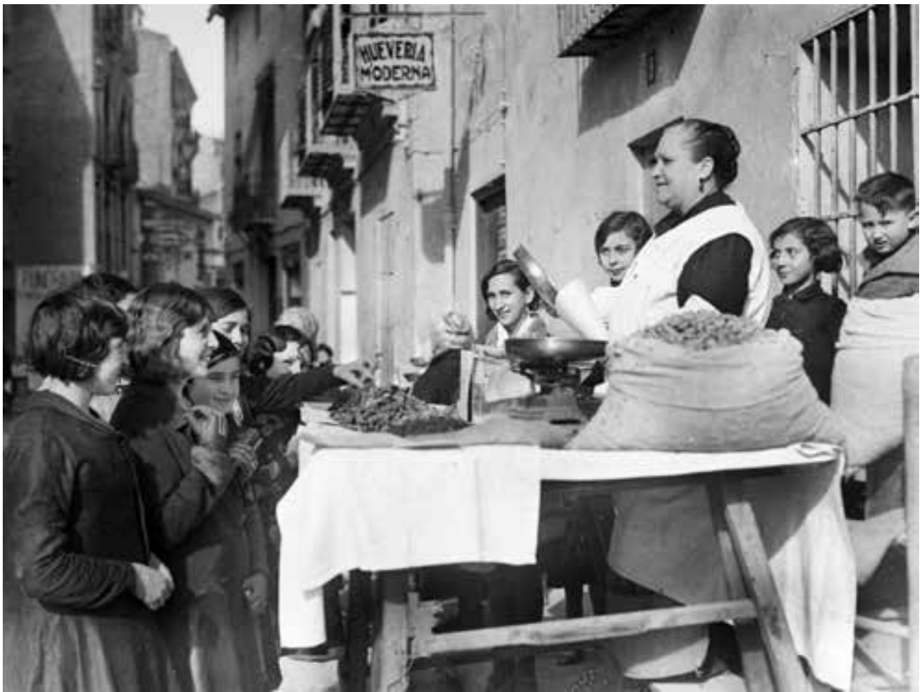
Porrateres al carrer per Sant Blai. Febrer de 1935