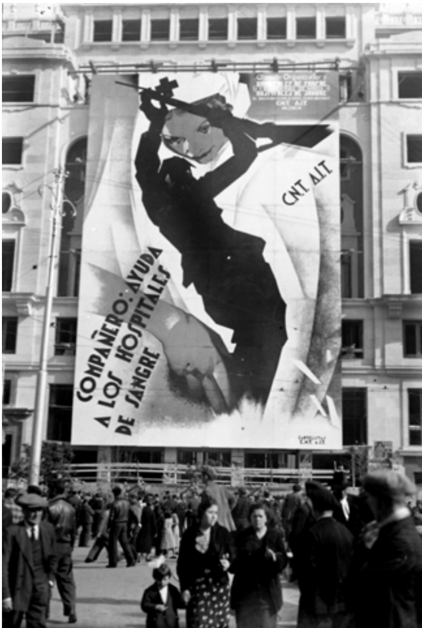
Monumental cartell de propaganda que ocupa quasi tota la façana de l'Ateneu Popular a la plaça d'Emilio Castelar, en el qual s'invita a ajudar els hospitals de sang. Gener de 1937