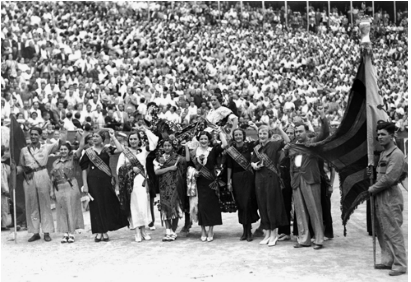
Festival taurí a la plaça de bous de València a favor de les Milícies Antifeixistes en què participen diverses dones, algunes d'elles vestides de miliciana. Agost de 1936