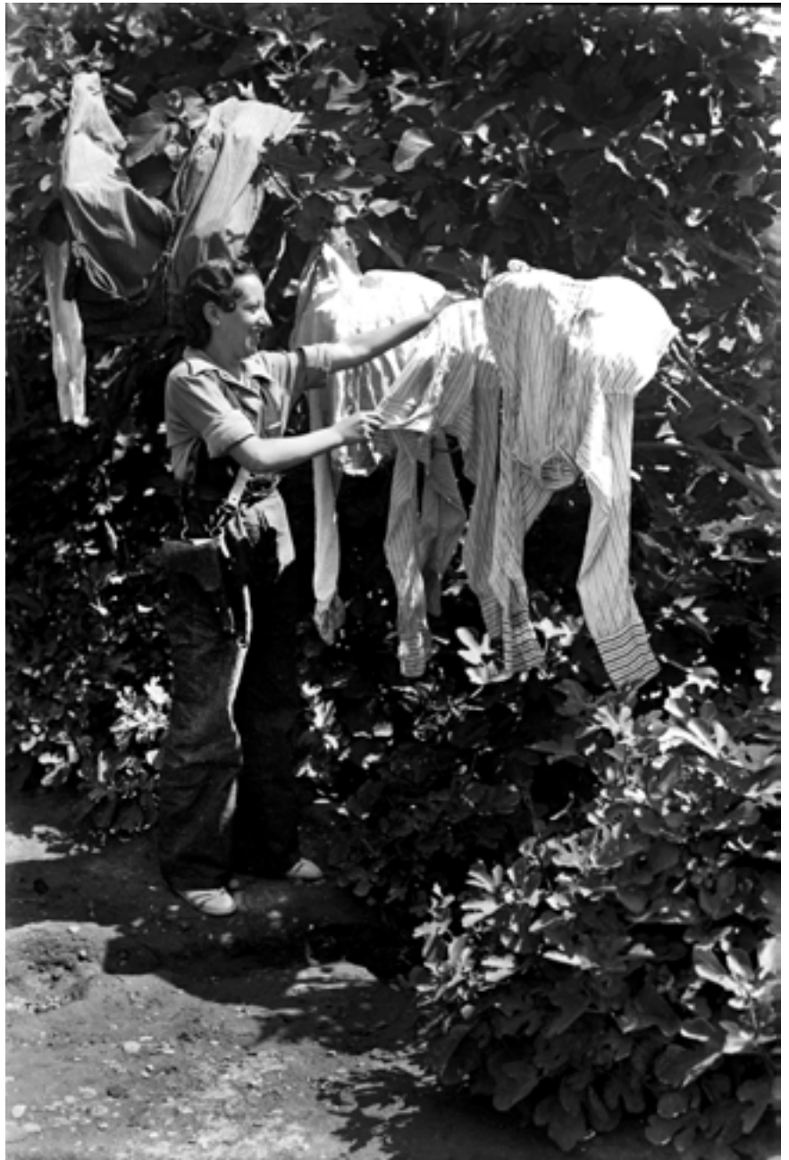
Milliciana estenent la roba a Torre Baixa (València). Les dones, en un principi, s'incorporaren al front de batalla, quedant el fet reflectit als cartells i a la fotografia periodística de l'època. Un poc més tard, des del mateix govern de la República se les relegà a treballs en la reraguarda. Agost de 1936