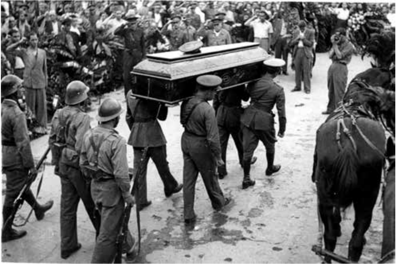
Enterrament a València del general hongarès Paul Lukács, comandant en cap de la XII Brigada Internacional, mort a Osca. En la imatge apareix el fotògraf Robert Capa davant del fèretre. 17 de juny de 1937