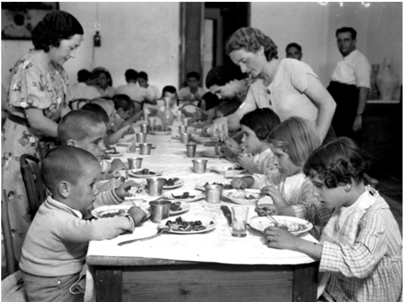
Grup de xiquets i xiquetes cecs evacuats de Chamartín de la Rosa (Madrid) a València. Els més menuts del col·legi tenen assignada aquesta taula al menjador de la residència. Setembre de 1937