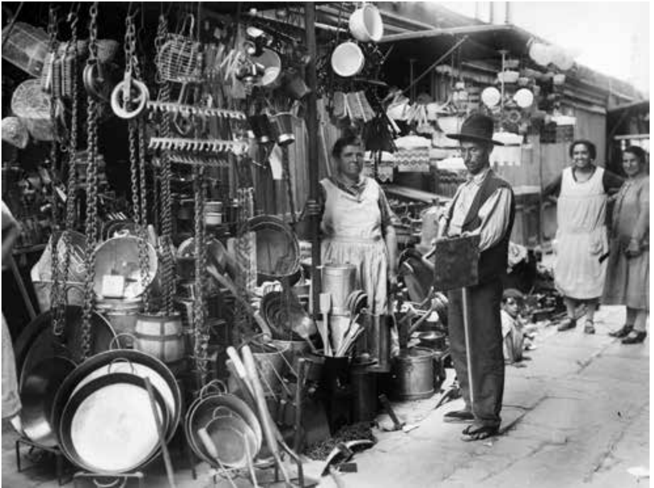
Parada de ferreteria i venda de paelles junt al Mercat Central. Maig de 1932