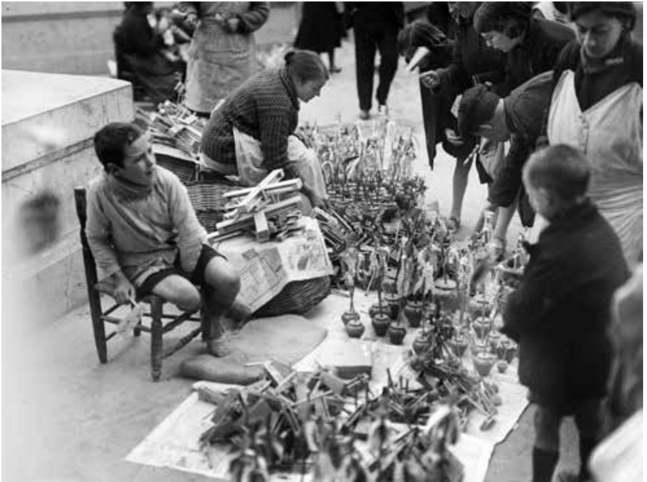
Mercat de Nadal. Desembre de 1934