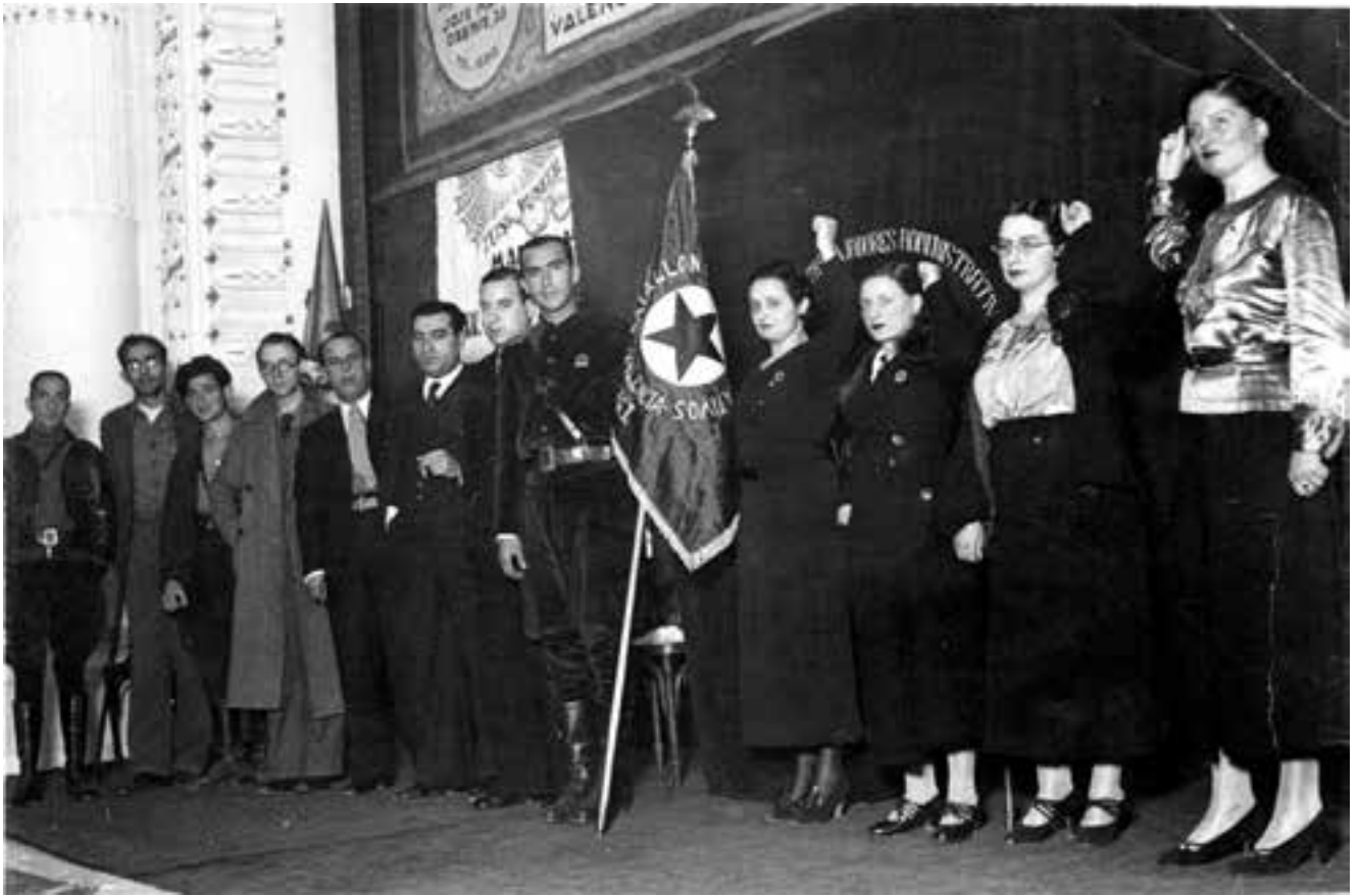
Les dones de la secció administrativa de la UGT lliurant un banderí als voluntaris d'aquest sindicat. Setembre de 1936