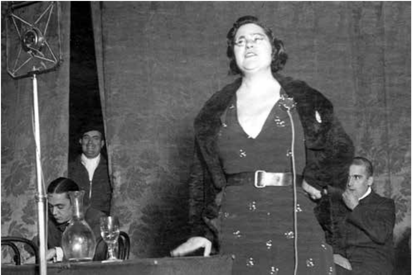
La ministra de Sanitat i Assistència Social, la camarada Frederica Montseny, durant el seu discurs al teatre Apolo de València sobre «Els problemes de la revolució Espanyola». Desembre de 1936