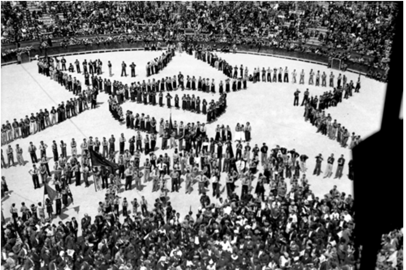
Festival polític organitzat per l'Aliança Obrera Antifeixista, en el qual intervingué Dolores Ibárruri, a la plaça de bous de València. 6 d'abril de 1936