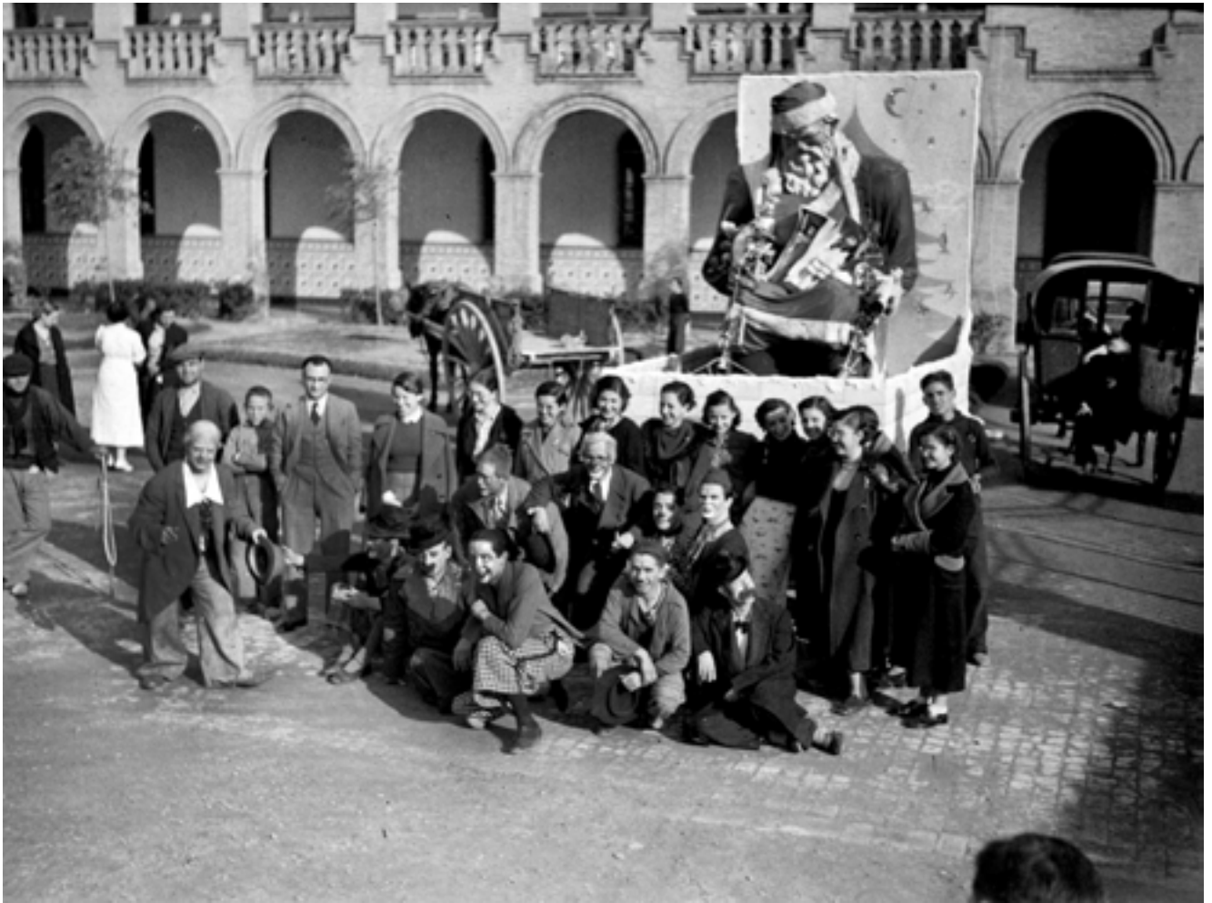
Diverses imatges de la gran cavalcada infantil organitzada pel Ministeri d'Instrucció Pública. Festa del Xiquet. Gener de 1937 i 1938