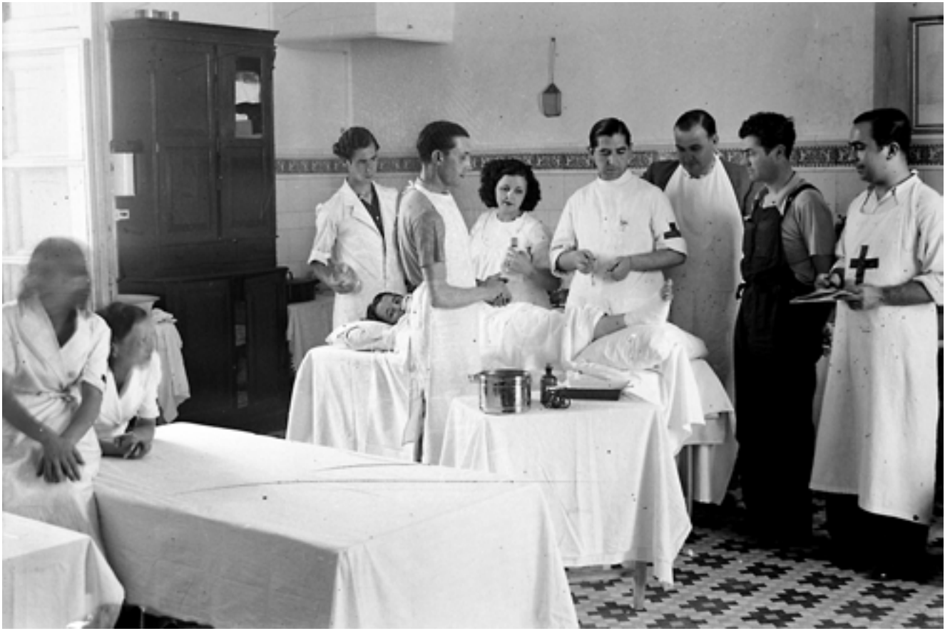
Equip mèdic del Dr. Joaquín d'Harcourt Got, cap del servei quirúrgic republicà, en el front de Terol. Les dones tingueren un paper fonamental en la sanitat. Juliol de 1938