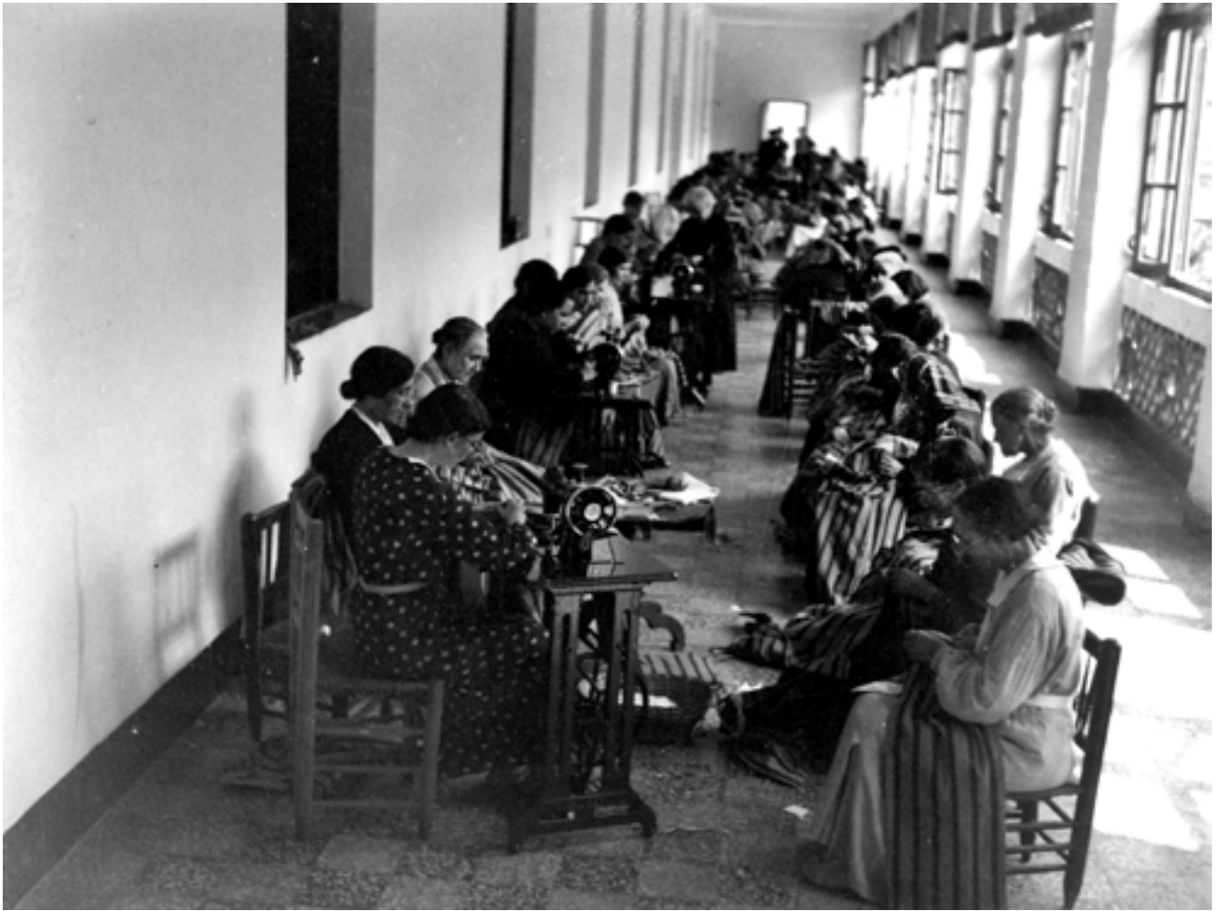
Taller de costura i rober amb professores i alumnes cosint per a xiquets proletaris i per a milicians, organitzat per l'Escola Normal i la Federació de Treballadors de l'Ensenyament (FETE-UGT). Novembre de 1936