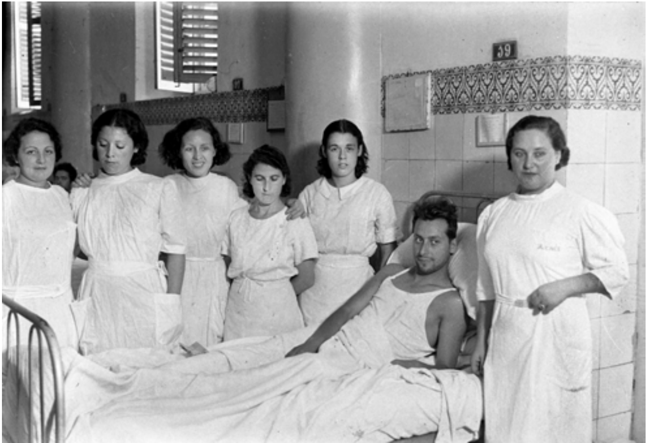
Administratives i infermeres que substitüiren les religioses en l'Hospital on són curats milicians ferits en el front. Setembre de 1936