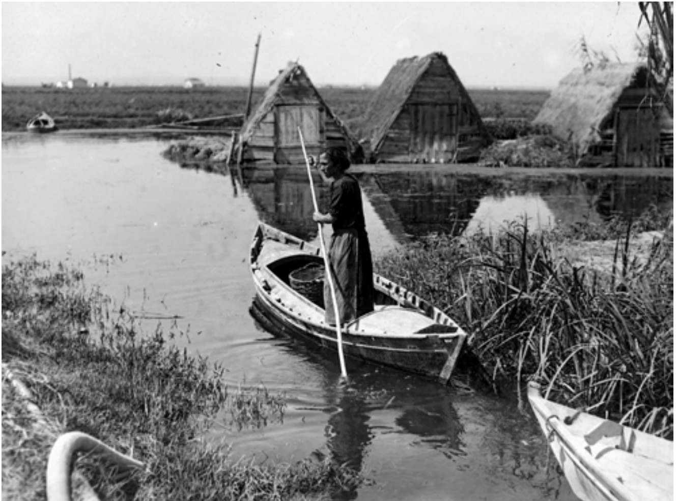
Una dona perxant en una barca de l'Albufera. Juliol de 1932