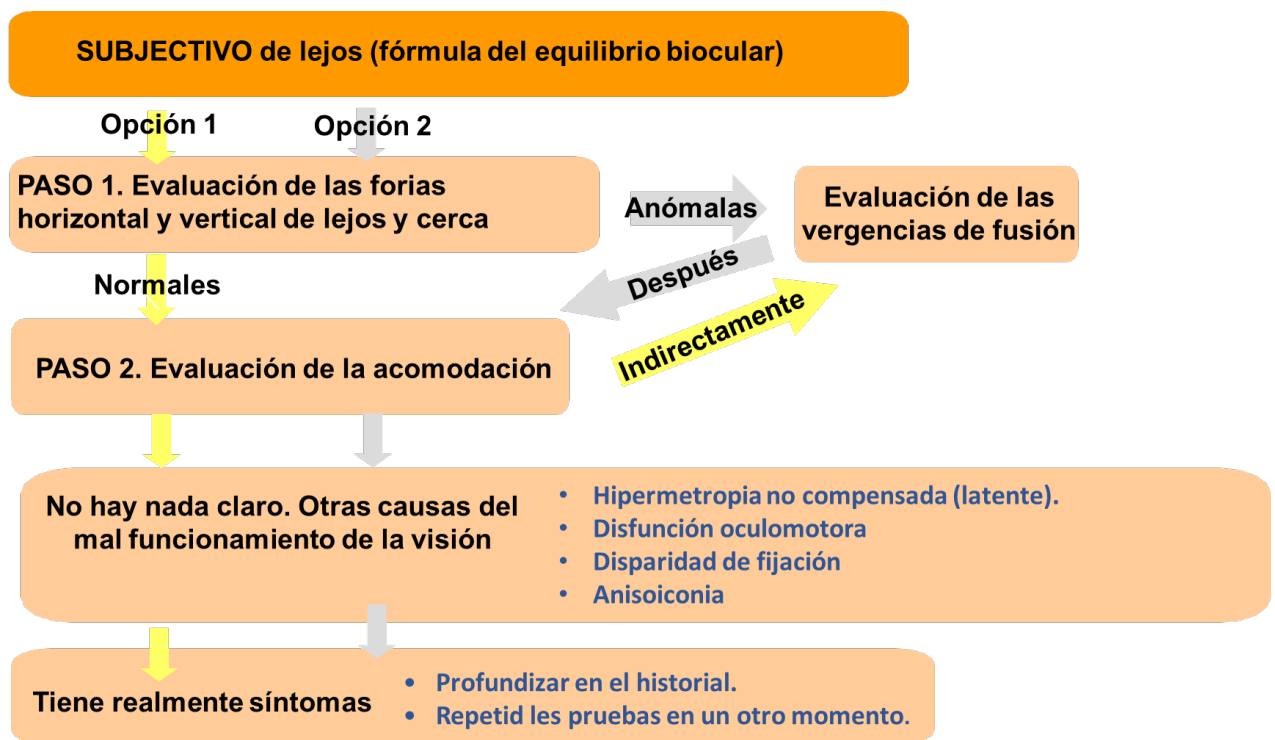
TABLA: Secuencia del examen general de la visión binocular.