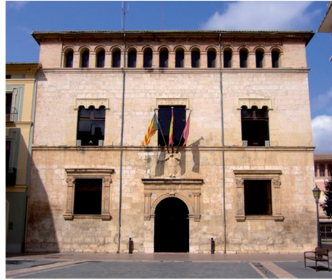
Façana de l'ajuntament d'estil renaixentista amb finestres gòtiques a la primera planta.