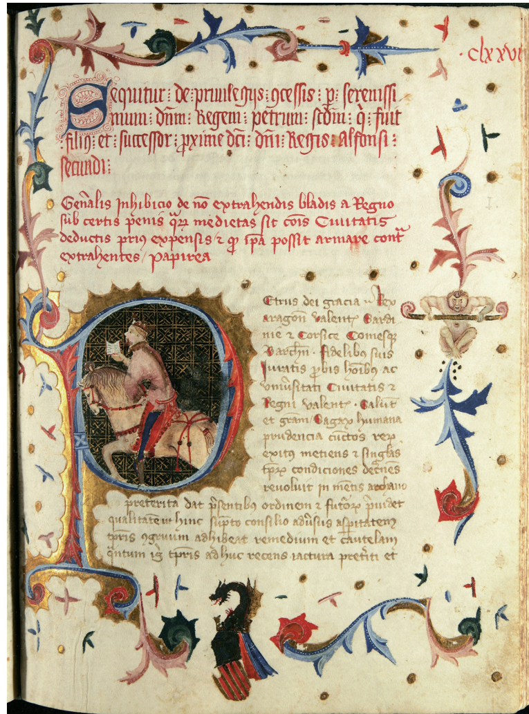
Exemplar del Llibre de privilegis de la ciutat i regne de València de l'arxiu municipal d'Alzira (ca. 1380).

La progressiva diversificació de la documentació al ritme de l'augment de la complexitat de l'administració, obligà les autoritats municipals a elaborar inventaris per a controlar el fons, adjudicar a l'escrivà, càrrec exercit per un notari, la responsabilitat de garantir la cadena de custòdia i, encara, programes mínims de conservació i ús dels seus escrits. La documentació de l'arxiu guarda memòria de l'acció de govern de les autoritats municipals, i els administrats, com a subjectes passius de dita administració, precisen de vegades fer indagacions documentals de manera personal o encomanant-la a persones més lletrades. Els jurats de la vila, conscients de les perilloses pràctiques que es duïen a terme en la consulta per part, entre altres, de notaris, frares i capellans, especialment dels llibres de la peita, i l'excessiva exposició pública dels volums instal·lats en la sala del consell, dels quals s'arrancaven pàgines, i fins i tot es furtaven privilegis, ordinacions i altres documents de l'arxiu, plantejaren la qüestió en una reunió celebrada el 5 de desembre de 1488. S'acordà que, a partir d'aquell