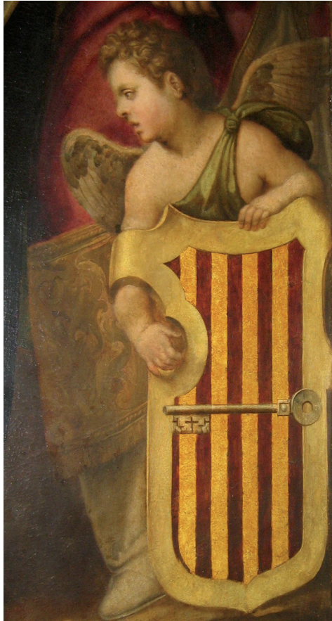
Àngel amb l'escut d'Alzira. Retaule de sant Silvestre.

Les ocasions, però, en què amb més assiduitat s'hi feien sonar les trompes i els tabals eren les convocatòries a celebrar consell, la publicació d'acords presos en aquests consells, la subhasta de les imposicions i la rendició de comptes anual. La citació als membres del consell es feia per dos conductes diferents, per escrit, amb albarans, i per crida pública. El 19 de març de 1394 foren reunits per fer consell general el justícia, els jurats, els caps dels oficis i els prohoms de la mà major, mitjana i menuda "per n'Uguet Pujalt, missatge dels dits jurats, ab albarans, e per en Berenguer Eximeno, corredor públich de la dita vila, ab so de trompeta e nafil, segons que en la dita vila és de costuma justar consell general" (Lairón 2001, 109). De la mateixa manera es donen a conèixer públicament els nous acords del consell que esdevindran norma legal al terme de la vila. El 30 de desembre de 1344, els "estatuts e ordenacions... foren cridats e publicats per la vila d'Algezira... ab so de trompes, tabals e nafils per Bernat Matheu, corredor públich..." (Lairón 2001, 27).