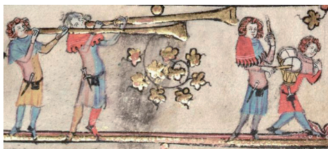
Nafils i tamboret en una miniatura del manuscrit The romance of Alexander de la Bodleian Library d'Oxford

La venda de les imposicions requeria subhasta pública amb previ anunci per so de trompes i tabals pels llocs acostumats de la vila. Així mateix, la rendició anual de comptes a què estaven obligats els col·lectors de les rendes i imposicions de la vila i els mateixos jurats, era anunciada de manera ostensible al so de trompetes, trompes i tabals, per convocar els veïns de la vila per tal que els aprovaren o impugnaren, en una mostra de transparència administrativa.