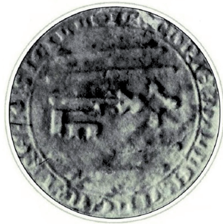
Segell de la vila d'Alzira en una carta de 1482 del justícia d'Alzira dirigida al seu homòleg de Sueca, conservat a l'arxiu municipal de Sueca.

Els actuals escut, bandera i segell de la ciutat d'Alzira tenen en comú l'ús d'una clau d'argent com a signe d'identitat. Encara que no sabem exactament quan es va començar a usar ni com s'elegí la clau, el seu origen és clarament medieval. 54 La clau