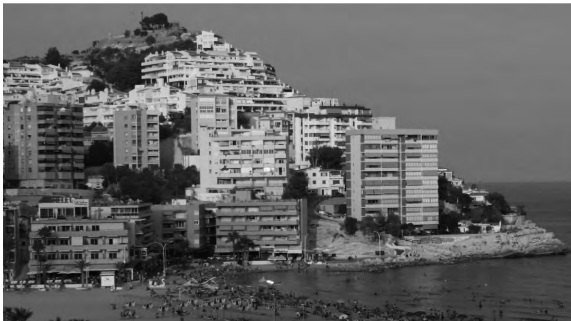
FIGURA 5. El Tossal de la Cala des del sud (Benidorm, Alacant) (2005).