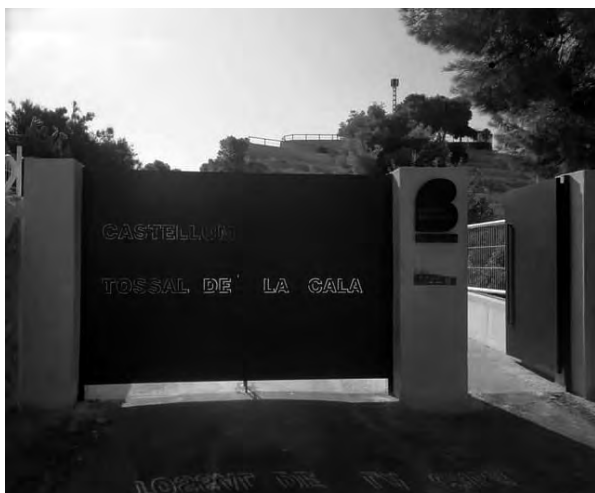
FIGURA 7. Entrada al Tossal de la Cala (Benidorm, Alacant) (2020). Arxiu J. A. Ahuir.