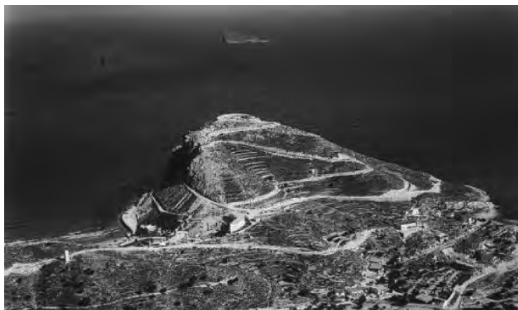
FIGURA 4. El Tossal de la Cala (Benidorm, Alacant) (anys cinquanta) ( https://benidorm.org/fondos-feder/sites/default/files/styles/contenido_completo_art_culo/public/noticias/tossal.jpg?itok=TjVtxJeS ).