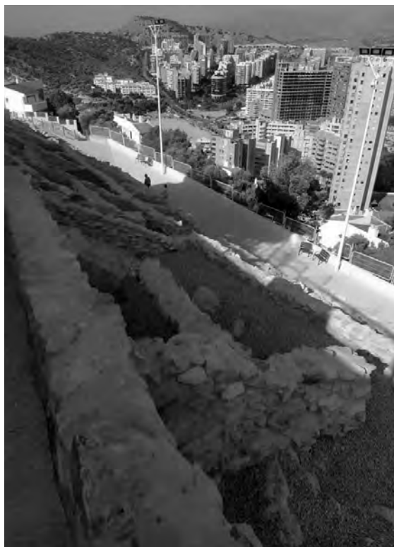
FIGURA 6. Restes consolidades del Tossal de la Cala (Benidorm, Alacant) (2020).