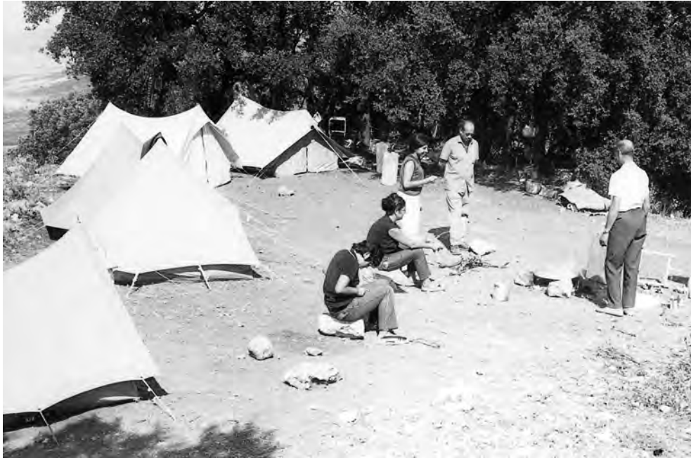
FIGURA 1. Campament de les excavacions de La Serreta (Alcoi-Cocentaina-Penàguila, Alacant) (1968). Arxiu C. Aranegui.