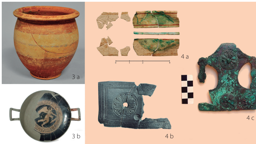
Fig. 3. a: Urna cineraria con decoración pintada bícroma de la sepultura XVI. Foto: Archivo MUPREVA. b: Kylix de Figuras Rojas de la sepultura XXIII. Foto: Archivo MUPREVA. Fig. 4. a: Placa de hueso con hilos de bronce incrustado de la sepultura I. Foto: Archivo MUPREVA. b: Plaquita de madera de boj con decoración vegetal impresa de la sepultura II. Foto: Eva Collado. Proyecto MHUMAC. c: Placa de cinturón de bronce de la sepultura II. Foto: Archivo MUPREVA.