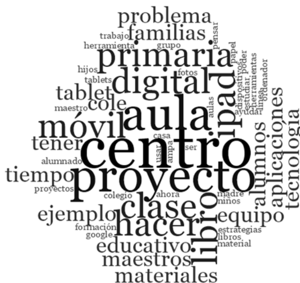
Figura 2. Nube de palabras de los términos frecuentes en las entrevistas.

Tal y como se evidencia en la Figura 2, entre los conceptos más utilizados en las diversas entrevistas destaca el peso dado a los diferentes agentes educativos que participan en el proceso de enseñanza/aprendizaje y a los materiales, dispositivos y estrategias que favorecen la inclusión, la adaptación al ritmo de cada alumno y la individualización de la enseñanza.