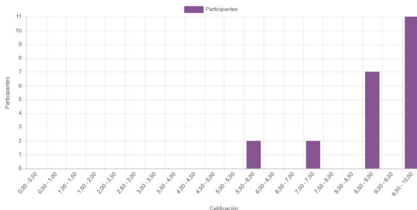
FIGURA 1. Resultados del simulacro de examen en la asignatura “Relaciones y Organizaciones internacionales” del curso 2019-2020.

Fuente: Aula Virtual de la Universitat de València.