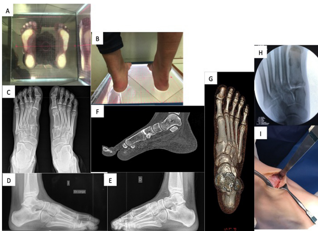
Figura 1 Coalición parcial ósea bilateral a nivel de la articulación entre la base del primer metatarsiano y la primera cuña. A. Huella plantar en podoscopio. B. Imagen clínica de los retropiés. C. Radiografía en proyección dorsoplantar en carga previa a la intervención quirúrgica donde se aprecia la coalición bilateral. D. Radiografía en proyección de perfil en carga del pie izquierdo. E. Radiografía en proyección de perfil en carga del pie derecho. F. Imagen de TC (corte sagital). G. Imagen de TC reconstrucción tridimensional. H. Imagen de fluoroscopia tras la resección de la coalición durante la intervención quirúrgica. I. Imagen de la zona de la resección durante la cirugía.

El tiempo medio de seguimiento de los pacientes fue de 4 años [2-8]. Según la escala funcional aplicada tras el tratamiento, en términos generales, en 13 (52%) pies los resultados fueron excelentes (grado I), en 9 (36%) buenos (grado II), en 2 (8%) regulares (grado III) y en un caso (4%) malo (grado IV). Dentro de los 9 casos de coalición calcáneo-astragalina idiopáticos, de los 6 pies tratados de forma conservadora un caso (16,6%) tuvo un resultado excelente (grado I) y 5 casos (83,3%) bueno (grado II). Los 3 casos intervenidos quirúrgicamente obtuvieron un resultado excelente (grado I). Dentro de los 13 casos de coaliciones calcáneo-escafoideas, de los 6 pies tratados de forma conservadora, 3 obtuvieron un resultado excelente (grado I) y 3 bueno (grado II). Todos los casos intervenidos quirúrgicamente (6 pies) obtuvieron un resultado excelente (grado I) excepto un caso (grado IV) por recidiva. El resultado de los 2 pies con coalición primera cuña-base primer metatarsiano fue regular (grado III).