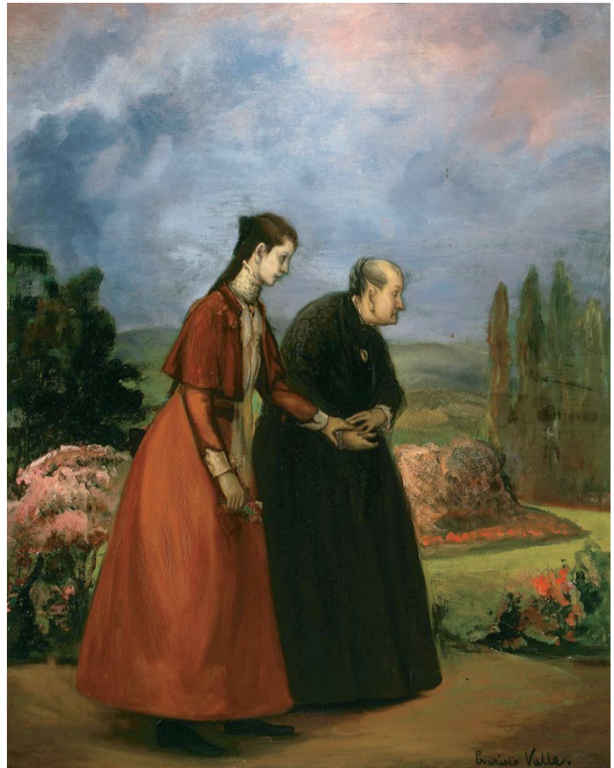
Fig. 5. Evaristo Valle, La nieta enferma , 1905. Fundación Museo Evaristo Valle.

De igual modo, en algunos de los casos mencionados es importante apuntar las claras diferencias que se avistan respecto a la posición social de las enfermas. En la obra de Maximino Peña, por ejemplo, la máquina de coser presente al fondo de la composición