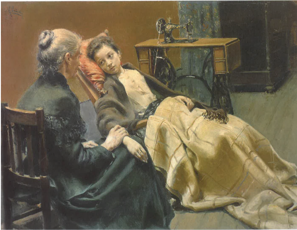
Fig. 3. Maximino Peña, La niña enferma , 1896. Colección particular.