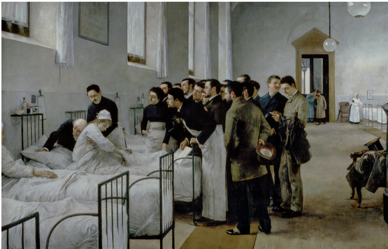
Fig. 1. Luis Jiménez Aranda, Una sala del hospital durante la visita del médico en jefe , 1889. Museo Nacional del Prado.

enfermedad adquiere un papel protagonista en la construcción de arquetipos sobre la masculinidad y, especialmente, sobre la feminidad hegemónica burguesa.