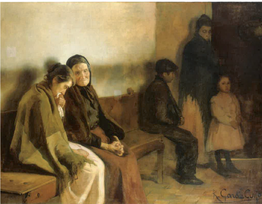
Fig. 4. Rafael García Guijo, Esperando en la consulta , 1901. Museo Nacional del Prado.

Tres años más tarde del cuadro de Rusiñol, Maximino Peña (1863-1940) pinta La niña enferma (Fig. 3) y, de igual modo, Rafael García Guijo (1881-1969) pinta en 1901 Esperando en la consulta (Fig. 4). Por mencionar otro ejemplo, en 1905, La nieta enferma (Fig. 5) de Evaristo Valle (1873-1951) es presentada al público. De nuevo, una joven, en este caso