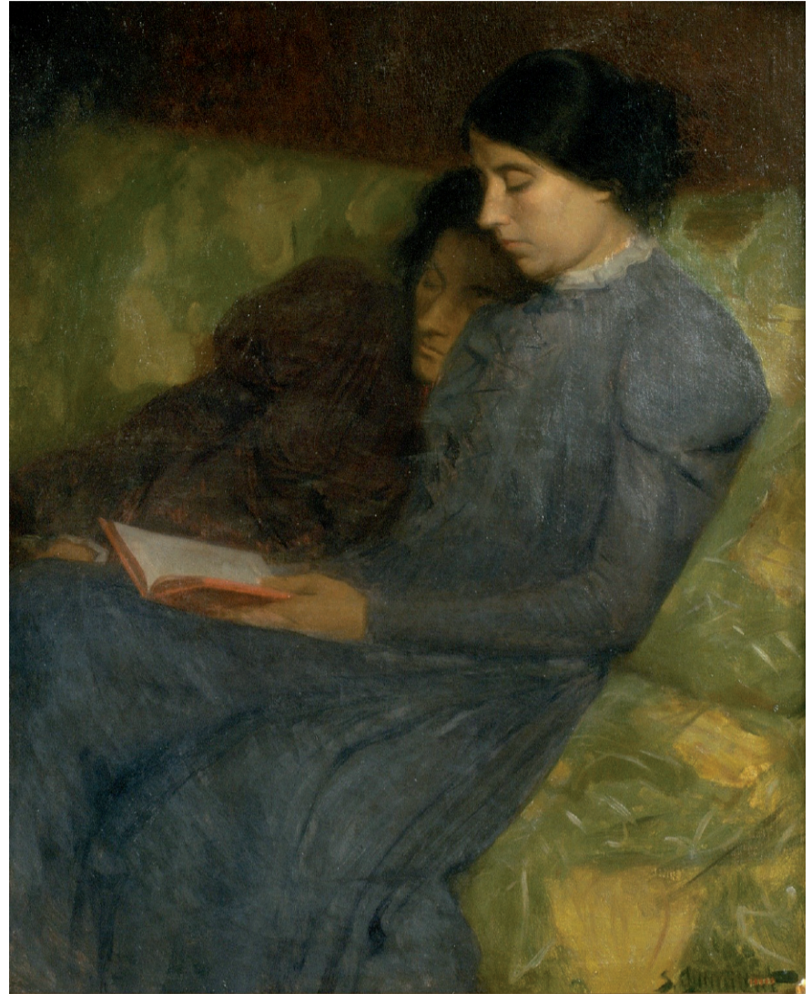
Fig. 6. Sebastià Junyent, Clorosi , ca. 1889. Museu Nacional d'Art de Catalunya.

El caso español cuenta con una pintura realizada por el catalán Sebastià Junyent (1865-1908) titulada, precisamente, Clorosi (Fig. 6). Esta “enfermedad” –y entrecomillamos porque, como bien ha sido demostrado, la clorosis fue, en realidad, una enfermedad construida por el afán médico para controlar a la mujer 42 –, muestra, una vez más, la reducción del cuerpo de la mujer al útero, pues es una enfermedad acontecida como consecuencia de la menstruación 43 . Ante las traducciones de algunos de los principales tratados sobre las enfermedades de las mujeres, nos encontramos con las siguientes descripciones acerca de la clorosis y la palidez de dichas mujeres: