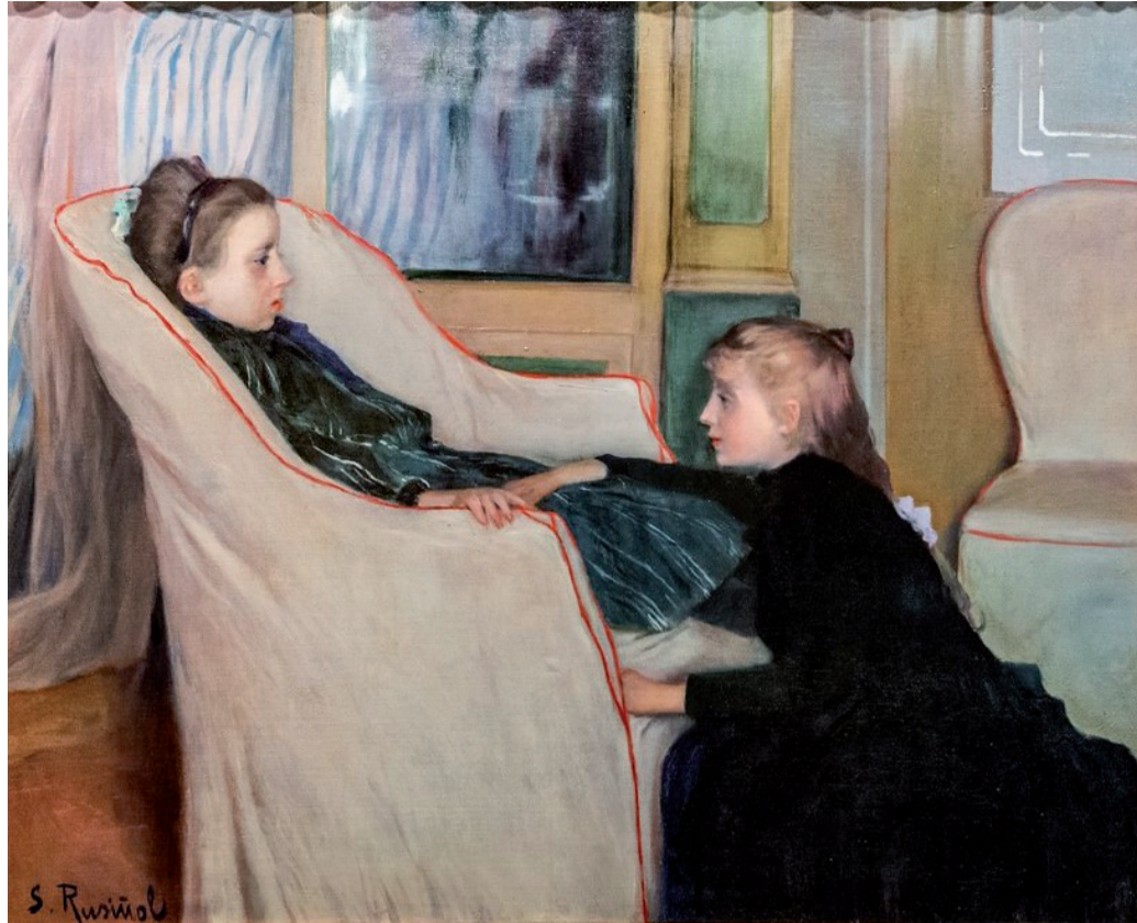
Fig. 2. Santiago Rusiñol, La convaleciente , 1893. Colección particular.

como las gemelas Carbonell 36 . Bajo este título, el personaje más adulto asiste a la púber convaleciente, que refleja en su rostro esa palidez que tan valorada fue. Sin embargo, más allá de lo que puede intuirse a simple vista, esta imagen y otras coetáneas suscitan otras preguntas que queremos apuntar a continuación, entre ellas, la posible sexualización de la enfermedad en mujeres púberes a través de la mirada del espectador. El imaginario visual conectaría, así, con otros imaginarios sociales que abogaban, en última instancia, por relegar a la mujer burguesa.