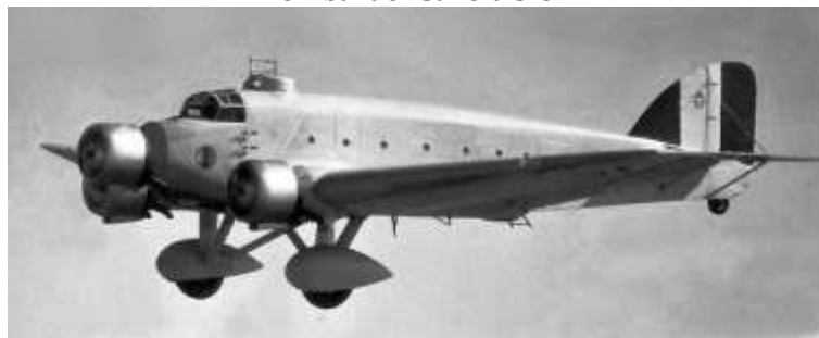
Bombarder Savoia S-81

"A las ocho aproximadamente de la noche, cuando las calles de nuestra ciudad se hallaban atestadas de pacíficos transeuntes, en su mayoría mujeres y niños; a la hora precisamente de la salida de los espectáculos y de mayor animación ciudadana hicieron su aparición, procedentes del mar, al parecer, y ocultándose cobardemente entre las nubes, varios aparatos facciosos [bombarders Savoia S-81], que rápidamente cruzaron la ciudad de Sur a Norte". 9