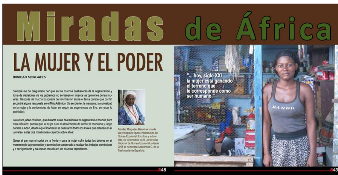
Imagen del artículo de Trinidad Morgades en la revista Atanga

Tomado de Morgades, T. (enero-junio 2012) La mujer y el poder. Atanga , (5), 48-51.