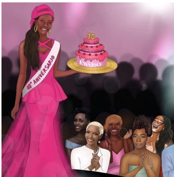
Ilustración promocional de la revista Ewaiso