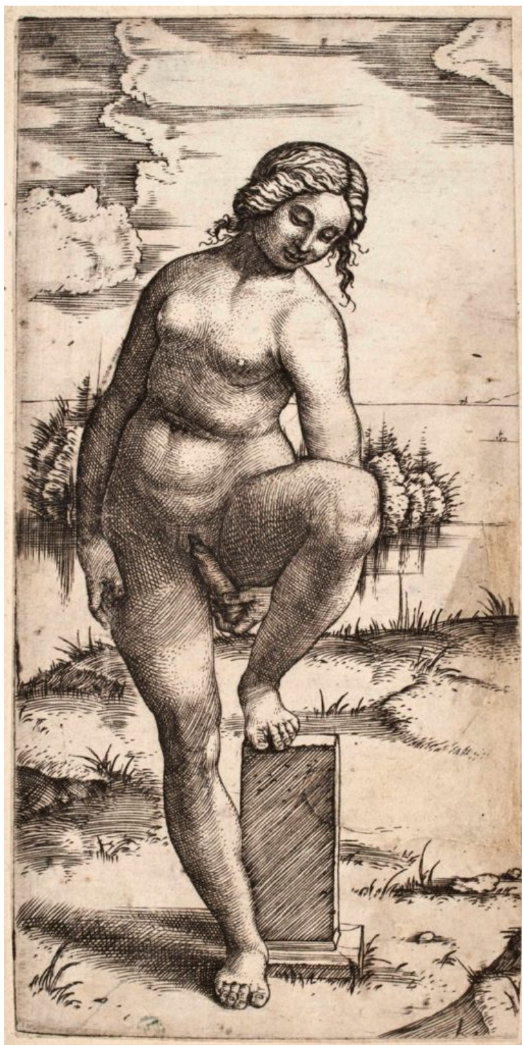
Marcantonio Raimondi, Mujer con un dildo (1524).

En la era de la fragmentación postmoderna, se abre paso el pluralismo y la subjetividad, no solo en el