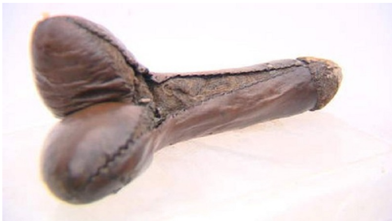
Dildo de cuero encontrado en Gdansk, Polonia (ca. 1750).

En contraste con la versión moralizante y despectiva de John Cleland, que calificaba a Catterina de abominable, libidinosa, perversa, corrompida, viciosa y loca, y para quien el falo postizo era considerado una impudicia y un engaño, Bianchi no entraba a valorar si se trataba de una santa o una depravada. Lo importante para él era denunciar la incompetencia de quienes la desatendieron durante su estancia en el hospital, dejándola morir por desidia. En cuanto al dildo, un elemento clave de su novela transgénero, Bianchi lo yuxtaponía al himen, trazando un paralelismo entre la prueba de culpabilidad y la de inocencia. Al final de la novela, el cuerpo de Vizzani yace entre un falo de cuero relleno de retales y un himen arrancado. Desafiando la censura, Bianchi insistió en mantener el término piuolo (clavo o estaca) que Boccaccio había utilizado en el Decamerón (IX, 10) como eufemismo de pene. En palabras de Donato: “Para Bianchi, el dildo constituye el centro de la narración, una justificación de las tecnologías de género, una parte del cuerpo, que cuando es colocado al lado del himen extirpado tiene un valor equivalente”.