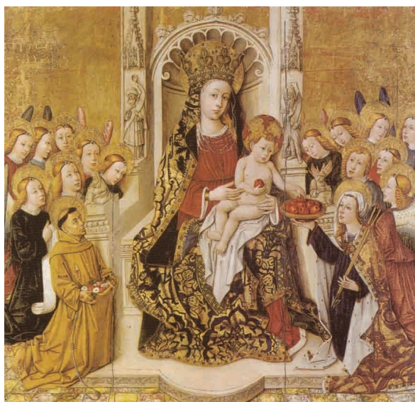
Fig. 2. Joan Reixac, Virgen de la Porciúncula , Museo Catedralicio de Segorbe (extraída de: Benito Doménech - Gómez Frechina 2001, p. 70).