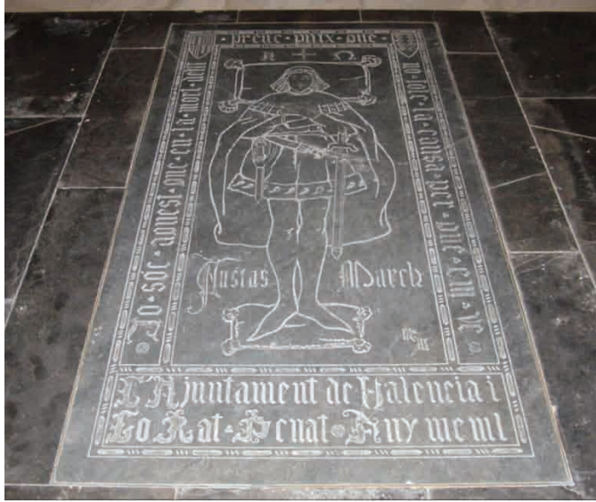
Fig. 4. Lápida con la imagen de Ausiàs March en la catedral de València.

nografía de un caballero yacente: acostado, la cabeza posante, los pies sobre cojines y portando una espada y un puñal, símbolos de su condición social.