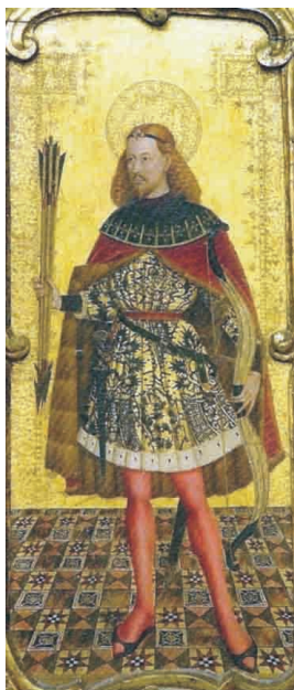
Fig. 1. Joan Reixac, San Sebastián , Colegiata de Santa María de Xàtiva.