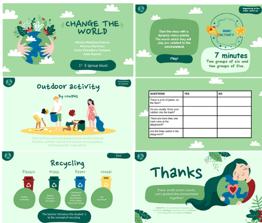
FIGURA 5. Algunas diapositivas de la presentación Change the world.