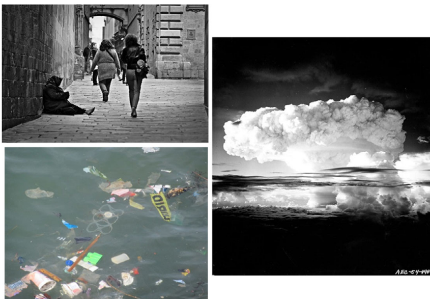
FIGURA 2. Imágenes de problemas del siglo XXI