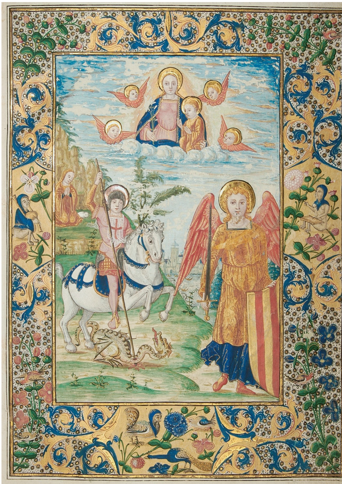
Fig. 1. Alegoría de los tres Brazos de las Cortes valencianas. Imagen extraída de A.R.V. Real Cancillería , 695, f.1r.