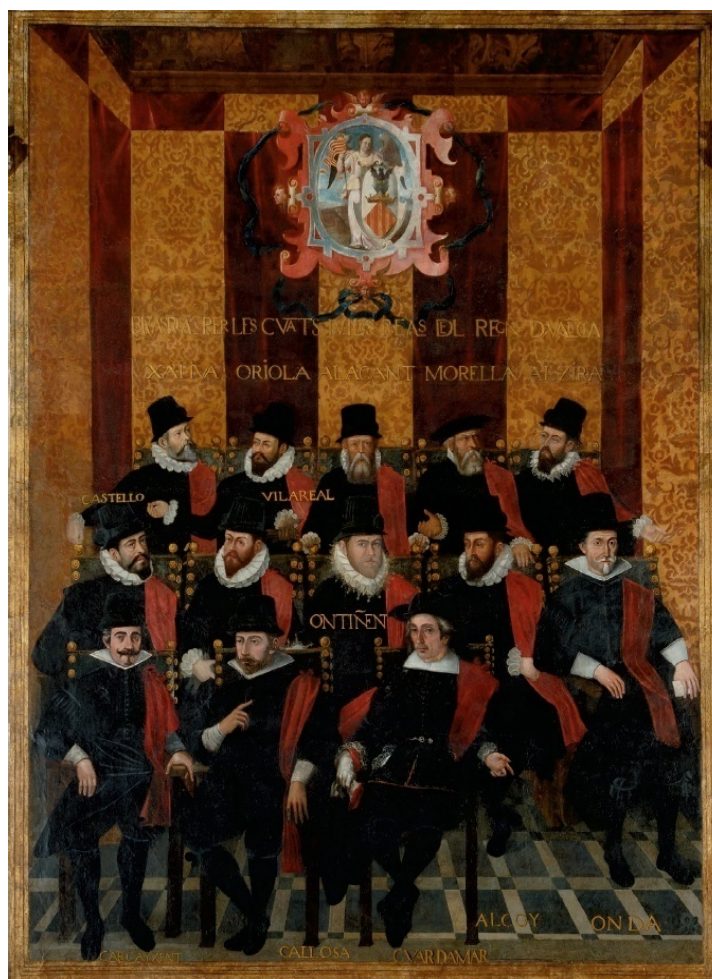
Fig. 6. Imagen de las ciudades y villas reales que aportaban el segundo diputado por el estamento real, extraída del archivo documental de la Generalidad Valenciana.

concurrir a ellos por detrás de Alcoy 322 . Carcaixent fue la siguiente en conseguir este privilegio; Callosa del Segura lo logró en 1638, cuando el monarca decretó que se le distinguiese como villa real; y en 1692 Carlos II segregó a Guardamar de Orihuela, nombrándola villa real con voto en Cortes 323 .