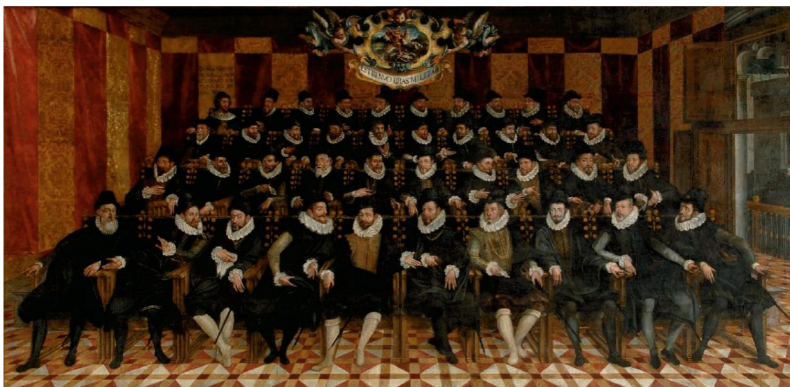
Fig. 4. Imagen del Brazo militar extraída del archivo documental de la Generalidad Valenciana.

Las críticas a esta obra no tardaron en llegar, por la excesiva “italianización” de los rostros, y los diputados entrantes en el trienio que se inició en 1593 exigieron que se retocasen esos semblantes para españolizarlos. Por eso el autor saboyano decidió retratar a dieciséis caballeros reales para cumplir su cometido. De estos caballeros sólo tres habían asistido a las últimas Cortes y otros tres eran miembros de la actual dirección de la Generalidad, dos diputados y un contador. Sobre la cabeza de todos ellos destaca el escudo de armas del estamento.