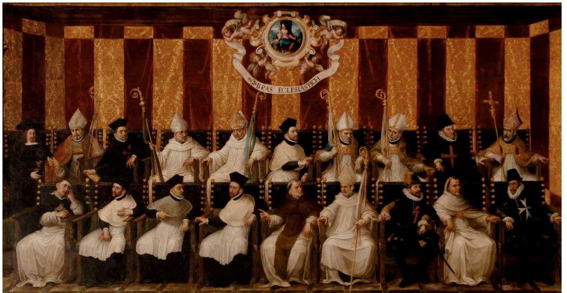
Fig. 3. Imagen del Brazo eclesiástico extraída del archivo documental de la Generalidad Valenciana.

Las Cortes de 1626 aprobaron que el obispo de Orihuela, único prelado que no contaba con estos derechos, fuese admitido en el estamento y Brazo eclesiástico e inscrito en la cédula para ocupar los cargos de la Diputación, una vez concluyese el turno que ya estaba en marcha. Trataban así de evitar agravios con los ya inscritos y que estaban finalizando su turno, puesto que ningún eclesiástico podía repetir en cualquier oficio de la Diputación hasta que no hubiese pasado toda la lista. Pero Felipe IV aprobó una modificación al poco tiempo, que permitía que el prelado oriolano entrase de inmediato en el turno sin esperar a que se cerrase una vuelta completa. Por otro lado, el ingreso del comendador de Alcántara en el estamento con plenos derechos se justificó en las rentas que percibía por el usufructo del peso real de las mercancías de la ciudad de Valencia 318 .