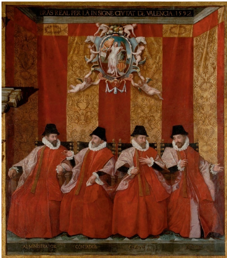
Fig. 5. Imagen de los representantes del estamento real por la ciudad de Valencia que ocupaban cargos en la Diputación, extraída del archivo documental de la Generalidad Valenciana.

Enfrente de esta pintura y al lado del Brazo militar se plasmó el primer bloque de ciudades y villas reales 321 , de las que procedía el segundo diputado de este estamento. Estas ciudades y villas, en un primer momento, fueron las seleccionadas en las Cortes de 1510 para establecer entre ellas el turno para el segundo diputado. Pronto salta a la vista que cuatro personajes en posición preferente (tres en primera fila y uno en el extremo derecho de la segunda) fueron añadidos con posterioridad. Se trata de los jurados de Onda, Carcaixent, Callosa y Guardamar.