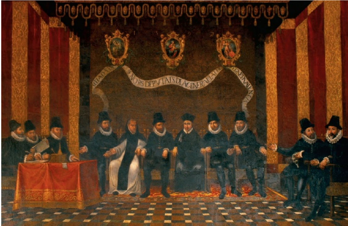
Fig. 2. Imagen de los diputados extraída del archivo documental de la Generalidad Valenciana.