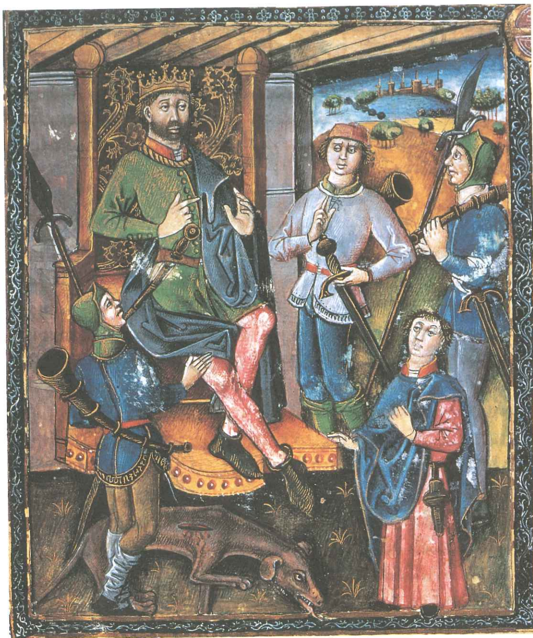
Perro herido en el Libro de la montería de Alfonso XI. Madrid, Real Biblioteca.