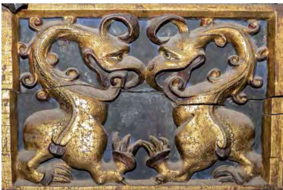
Figs. 3A y 3B.- Fotografías actuales de las tablas del tipo de las de la foto 3.