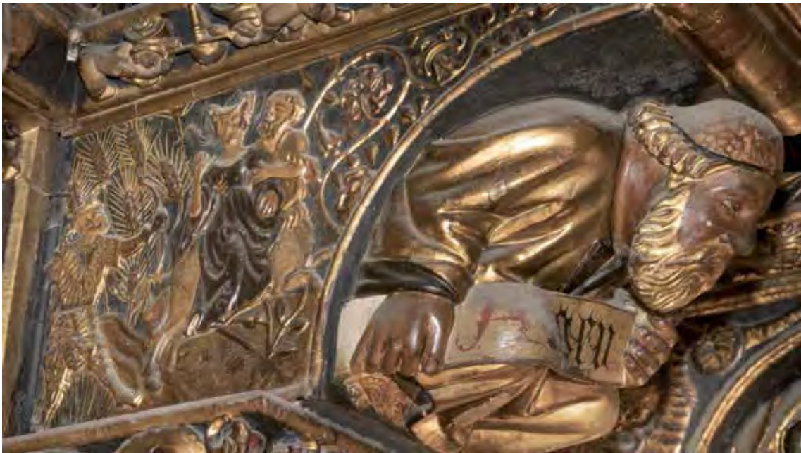
Fig. 5A y 5B.- Ménsula del profeta Ageo. Arriba, en el lateral, diosa Cibele en el carro llevado por Hipomenes y Atalanta convertidos en leones, portando en la mano izquierda un cuerno de la abundancia y en la mano derecha un cuerno de la abundancia y en la mano derecha un cupido disparando una flecha. Abajo, en el lateral opuesto, cupido disparando una flecha y un centauro (Hipomenes) alcanzando a una joven corriendo (Atalanta).