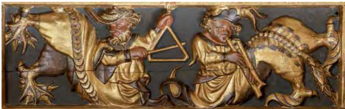
Fig. 7A y 6B.- Tablas del entrevigado del techo mostrando escenas de músicos, ambas con seres híbridos.