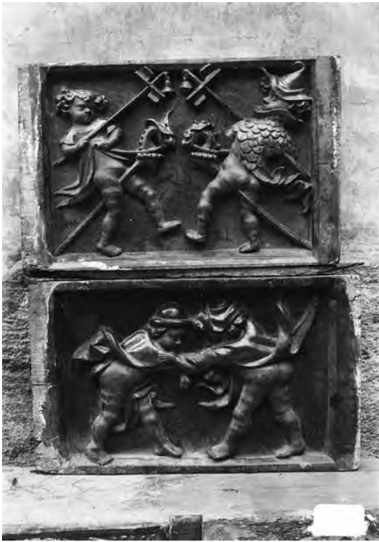
Fig. 4.- Tablas de entrevigados laterales del techo de la sala dorada. Fotografía de Cardona/ Tramoyeres, hacia 1909.

clichés fotográficos utilizados en este artículo son debidos a D. Enrique Cardona”, lo cual permite adjudicar a este excelente fotógrafo la autoría de estas fotografías. 13