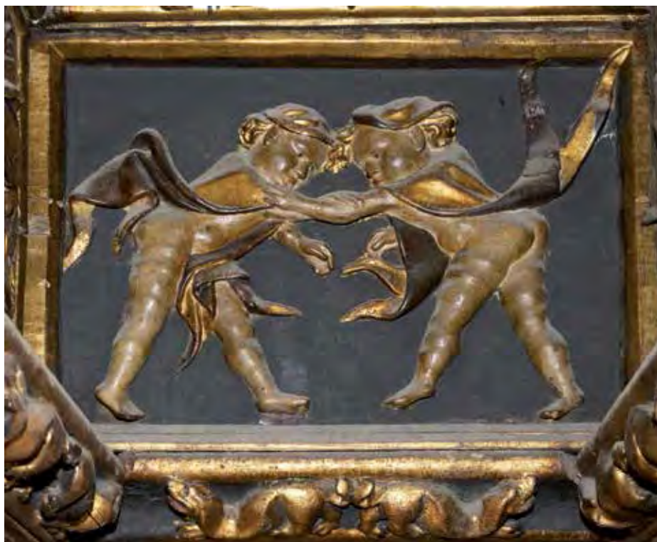
Fig. 4A y 4B.- Fotografías actuales de las tablas del tipo de las de la foto 4.