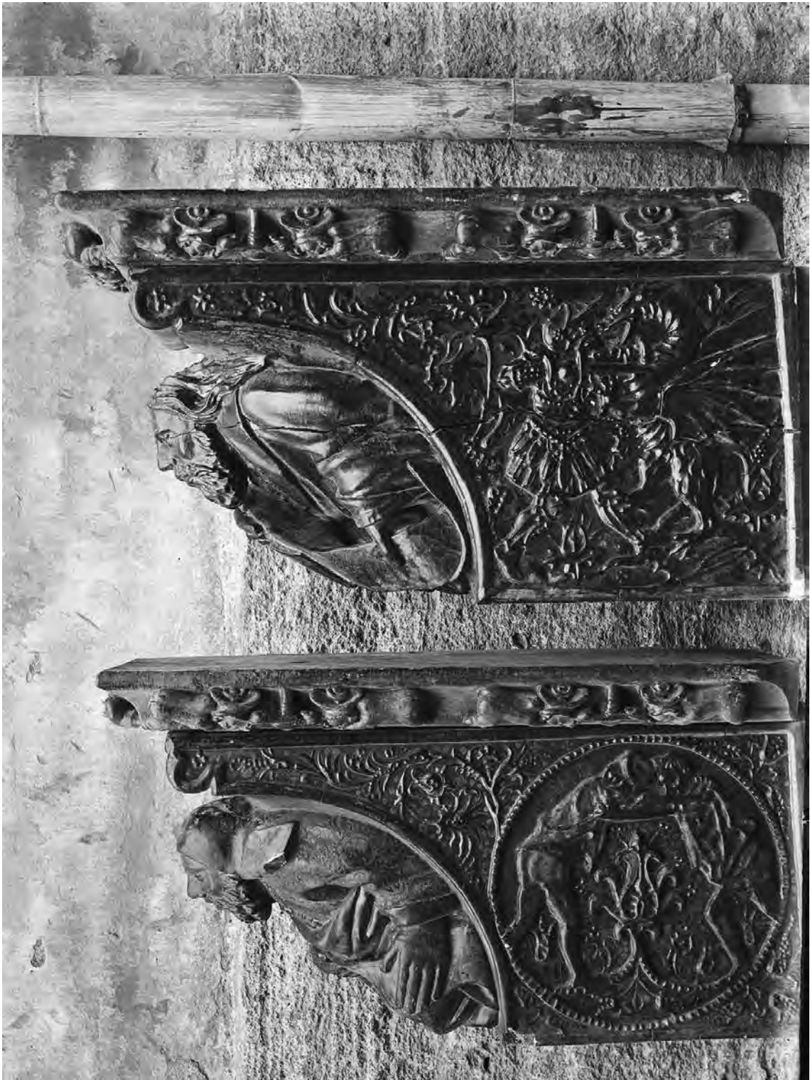
Fig. 5.- Ménsulas superiores. Fotografía de Cardona / Tramoyeres, hacia 1909.