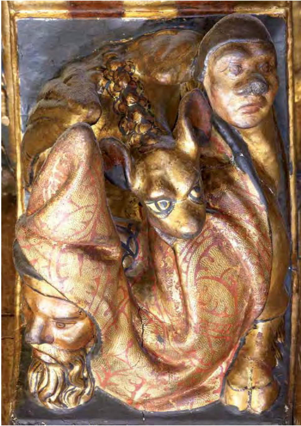
Fig. 9A.- Fotografía actual de la ménsula de la foto 9.