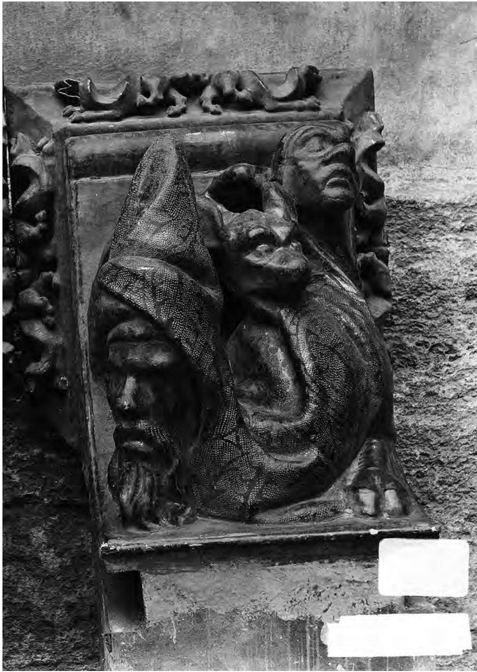
Fig. 9.- Figura de la ménsula inferior. hacia 1909.