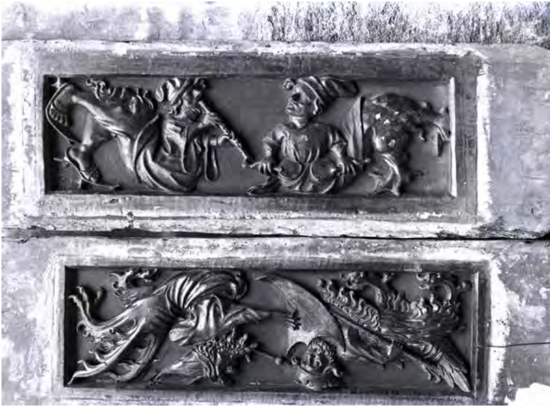
Fig. 6.- Tablas del entrevigado del techo mostrando escenas de músicos y de danzas guerreras ceremoniales, ambas con seres híbridos. Fotografía Cardona/ Tramoyeres, hacia 1909.

Lo que vio y reprodujo Tramoyeres extensamente, aunque, como permitía la época, en blanco y negro y baja resolución, podemos volverlo a ver en color cien años después gracias al avance de la fotografía. Las imágenes necesitan pocos comentarios para mostrar su interés y espectacularidad. 15