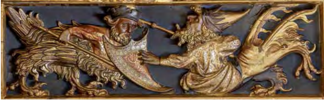
Fig. 6A y 6B.- Fotografías actuales de las tablas de la fotografía 6.