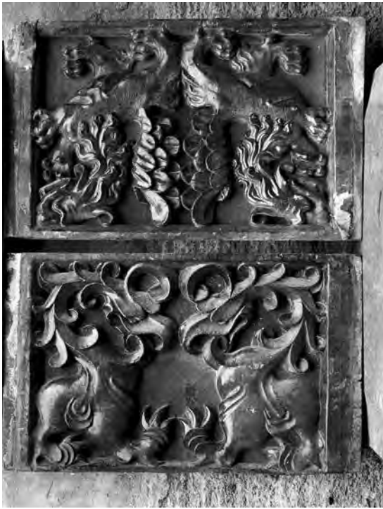
Fig. 3.- Tablas de los entrevigados laterales del techo de la Sala Dorada. Fotografía de Cardona / Tramoyeres, hacia 1909.

un estudio excepcional realizado hace más de cien años por Luis Tramoyeres. 11 Pero, además, el académico parece haber sido el auténtico impulsor del rescate de este techo, que llevaba sesenta años desmontado y almacenado. Cabe recordar que Tramoyeres ocupaba cargos decisivos para impulsar esta decisión;