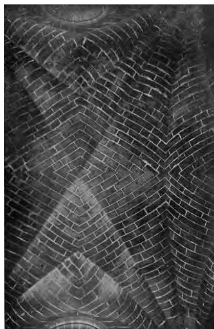
Figs. 1A y 1B.- Arriba, portada de la Capilla Real del antiguo convento de Santo Domingo de Valencia. Abajo, detalle de la bóveda de la capilla mostrando el aparejo de las dovelas.