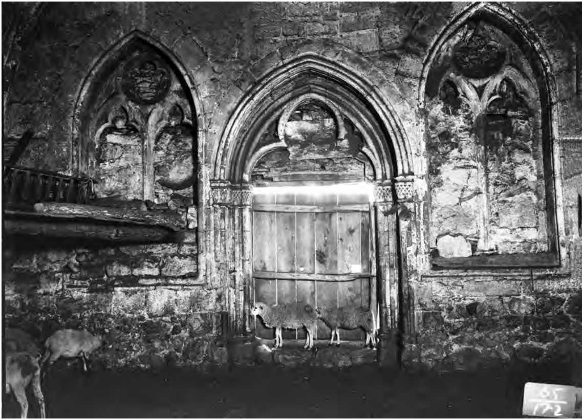
Fig. 2B.- Sala capitular del monasterio de Santa María de Benifassá hacia 1917.