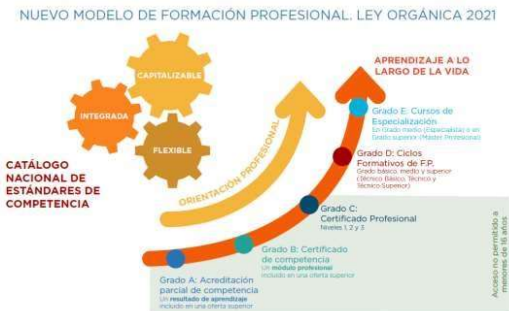
Figura 5: Modelo de Formación Profesional de la Ley Orgánica 3/2022 (Fuente: Gobierno de España, 2021).

2. En cada uno de los Grados existirán ofertas vinculadas a los niveles 1, 2 y 3 del Catálogo Nacional de Estándares de Competencias Profesionales (figura 5).