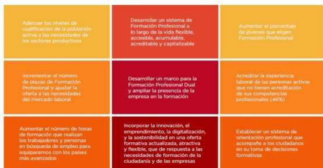
Figura 2: Principales retos de la formación profesional en España (Fuente: Gobierno de España, 2021).

La Ley presenta un Sistema de Formación Profesional, que acompañe a las personas desde el sistema educativo y durante toda su vida laboral, superando los dos subsistemas independientes existentes hasta ahora y centrada en una economía digital (AETD, 2022), verde y azul (figura 2).