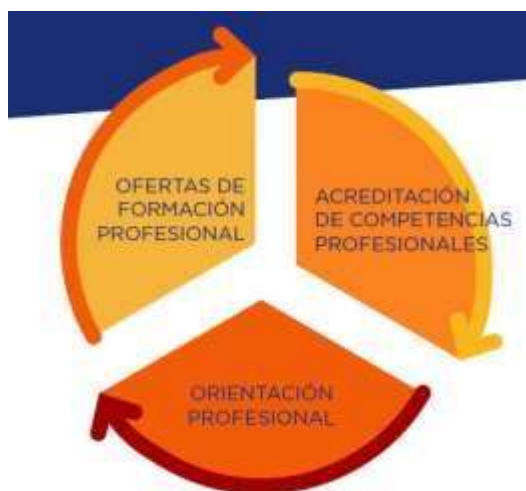
Figura 6: Ámbitos coordinados e interdependientes de la Ley Orgánica 3/2022 (Fuente: Gobierno de España, 2021).