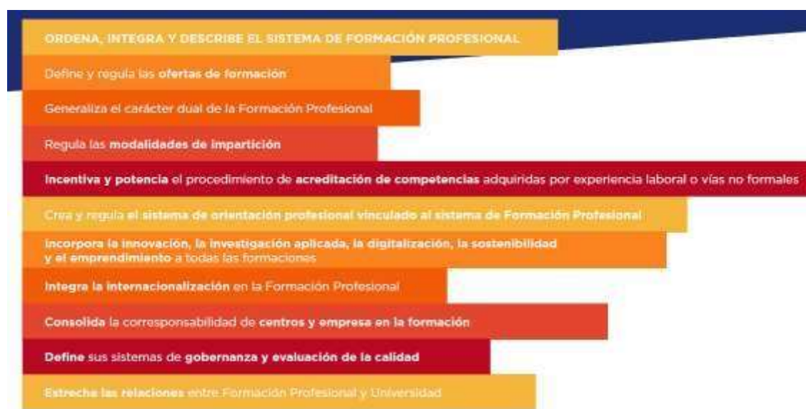
Figura 4: Elementos principales de la Ley Orgánica 3/2022.