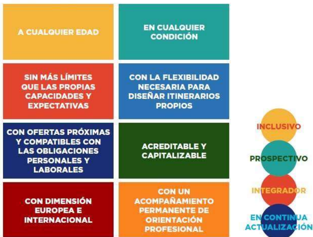
Figura 3: Nuevo modelo de formación profesional en España