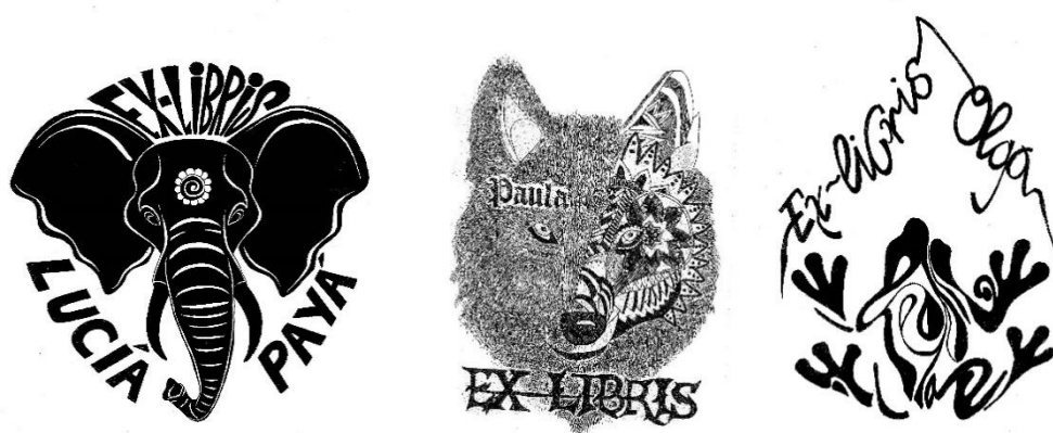
Figura 1. Exlibris diseñados con motivo de animal.

Nota: Trabajos de Lucía Payá, Paula González y Olga Cases.