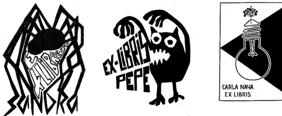
Figura 3. Elementos simbólicos alusivos a cuentos o narraciones orales.

Nota: Trabajos de Sandra Cerdá, Pepe Torres y Carla Naya.