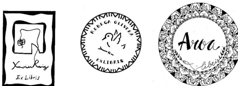
Figura 2. Exlibris con motivos geométricos, mandalas, o simbologías.

Nota: Trabajos de Xavier Roig, Rebeca Olivera y Aroa Lino.