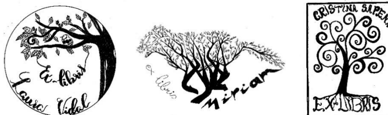
Figura 5. Exlibris con alusiones a la naturaleza.

Nota: Trabajos de Laura Vidal, Miriam Ibáñez y Cristina Sapena.