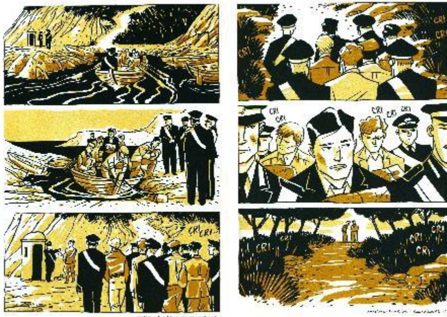
Figura 13. Doble página de En Italia son todos machos . Sara Colaone.

Artista italiana muy conocida internacionalmente por sus cómics, que han sido editados en numerosos idiomas y países, en los que trata siempre cuestiones de feminismo y diversidad sexual. Su celebrado y premiado En Italia son todos machos por primera vez indaga, reconstruye y devuelve a los lectores un asunto doloroso y olvidado: el confinamiento de cerca de trescientos homosexuales italianos durante el régimen fascista. La fuerza de su narración con imágenes ha llegado a un público amplio provocando un sentido crítico no solo respecto el pasado sino también hacia el presente. La recuperación de la memoria y de las imágenes es crucial para evitar la superficialidad del juicio, y más en un contexto de definición de las identidades y las orientaciones sexuales.