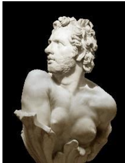
Figura 1. Busto 4 . De la serie Bustos . Ángel Pantoja.

La serie Bustos del artista Ángel Pantoja parte de la ruptura con el binarismo de género, lo cual queda representado alterando los esquemas tradicionales de la estética clásica y barroca, realizando piezas que contienen una fuerte carta humorística y de reivindicación. El artista nos presenta un concepto completamente actualizado de estos valores, de modo que su mensaje nos anima a replantearnos estos esquemas tradicionales caducos. Cada busto desconcierta al espectador, acostumbrado a observar y asimilar la estatuaria clásica o de corte clasicista dentro de un contexto determinado. Cada usuario debe averiguar qué aspecto o detalles de resulta especial, o chocante. La dureza del fondo negro de estas piezas y el gran trabajo de iluminación que propone Pantoja hacen de esta serie un verdadero ensayo apto para incorporar al panorama educativo.