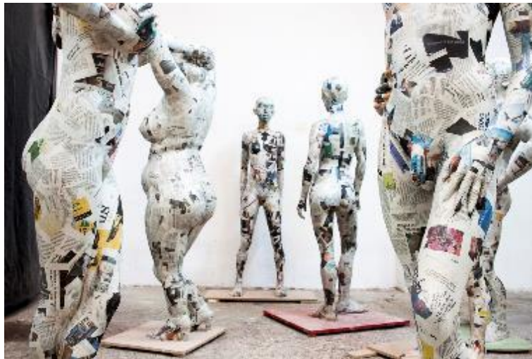
Figura 3. Esculturas de Anna Ruiz Sospedra para la falla D'Amors

que recibió numerosos premios, y además el respaldo del público. En su obra trata siempre de cuestionar lo que nos viene marcado a priori.