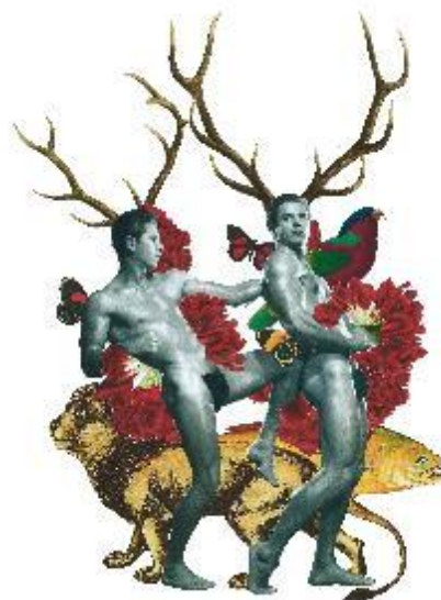
Figura 12. Learning to fight . Randomagus.

Desde muy pequeño Randomagus ya estaba tijera en mano cortando papel y juntando las piezas, aunque no sabía que estaba haciendo collages. Para él era simplemente la manera más natural de expresarse. Y sigue siendo así. Con sus collages nos habla de masculinidad. Opina que debería cambiar lo que generalmente está considerado como masculino. Sus obras están pobladas por hombres que no tienen miedo de mostrarse a sí mismos al mundo, que saben quién son y que son lo suficientemente valientes para que no les importe. Les da igual ser tradicionalmente “masculinos”, son ellos mismos, sin miedo a ser.