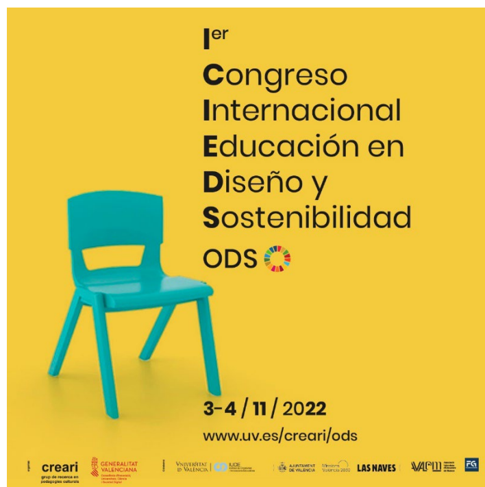
Figura 3. Cartel del “I Congreso Internacional Educación en Diseño y Sostenibilidad ODS” (diseñado por Rosa Silla y Colette Graf, del estudio Colla ge-no), https://www.uv.es/creari/ods/programa