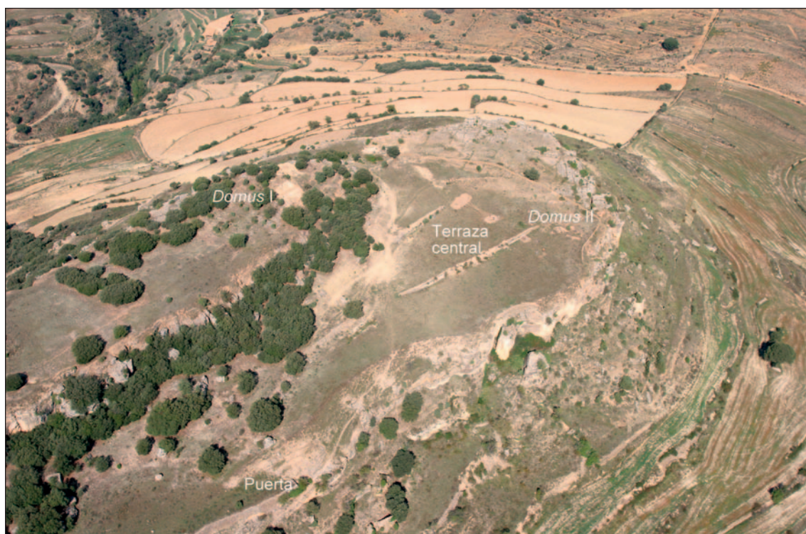
Fig. 4: Perspectiva aérea del sector norte con las localizaciones mencionadas en el texto.