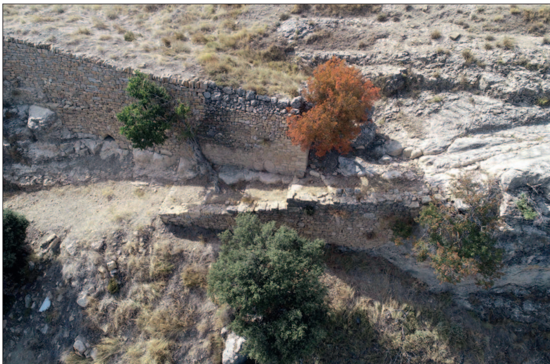
Fig. 3: Vista de la puerta después de la restauración. Se observa la muralla con el recrecimiento moderno, el umbral en la entrada con un escalón a su derecha y, en el interior, las rodadas de la calle de acceso.