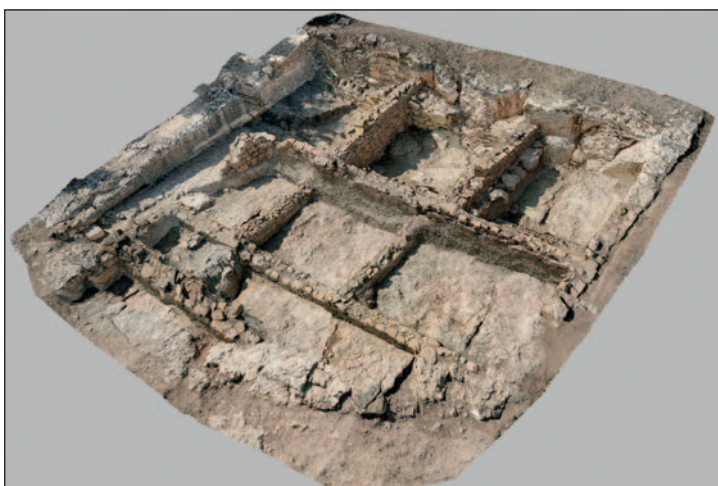
Fig. 5: Modelo en 3D de la domus I (Global Mediterránea S.A., 2009).

Esta plataforma tiene una superficie de 1,4 ha y, aunque se encuentra bastante arrasada, por los restos visibles debió de estar completamente ocupada. La calle llegaba a ella por su extremo NE, desde donde seguía hacia el sur constituyendo su eje central. En su extremo norte se excavó una casa, la domus I (Fig. 5), que ha proporcionado información de gran interés para el conocimiento de su secuencia ocupacional y en general de la arquitectura doméstica de la ciudad. Levantada sobre los restos de un taller metalúrgico del siglo I a. C., del que se encontró parte de un pavimento de mortero en los trabajos de restauración y puesta en valor de 2019 (Albalat et alii 2019), cuenta con tres fases constructivas que los hallazgos cerámicos han permitido fechar desde el final de este siglo hasta mediados del II (Huguet y Arasa 2019). En la mitad sur de esta plataforma, Enrique Pla excavó una habitación que posiblemente pertenece también a un ambiente doméstico. Al SO se conserva parte de una cisterna construida en el reborde escalonado del risco, con muros de opus caementicium y pavimento de opus signinum , y una disposición que debió de ser frecuente en la construcción de estos depósitos de carácter privado.