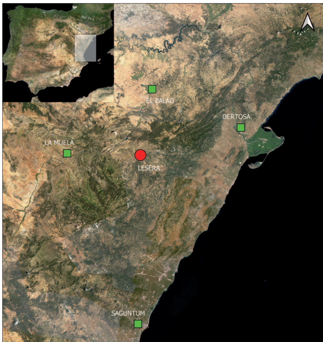
Fig. 1: Localización de Lesera y las ciudades vecinas (Elaboración: D. Cardo).

Situado en el extremo NO del País Valenciano, a tan sólo 3,4 km del límite con Aragón y en la cuenca hidrográfica del río Ebro (Fig. 1), el municipio de Lesera es un caso peculiar en el conjunto de las nueve ciudades romanas hasta ahora conocidas. Esta singularidad se concreta, por una parte, en el hecho de ser la única ciudad existente entre Dertosa y Saguntum , separadas 142 km en línea recta, cuando el resto del territorio valenciano cuenta con un importante desarrollo urbano; y, por otra parte, en que también es la única situada en un entorno montañoso de interior, a 62 km de la costa, una localización que la aproxima a otras más cercanas situadas en tierras de Aragón (Arasa 1987, 2009 y 2014).