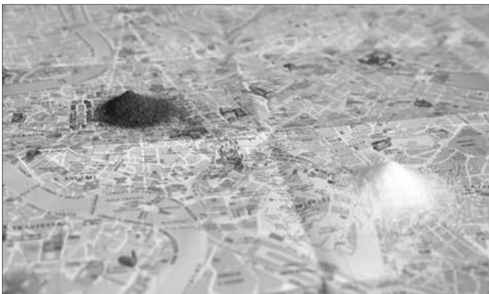
De visita obligada