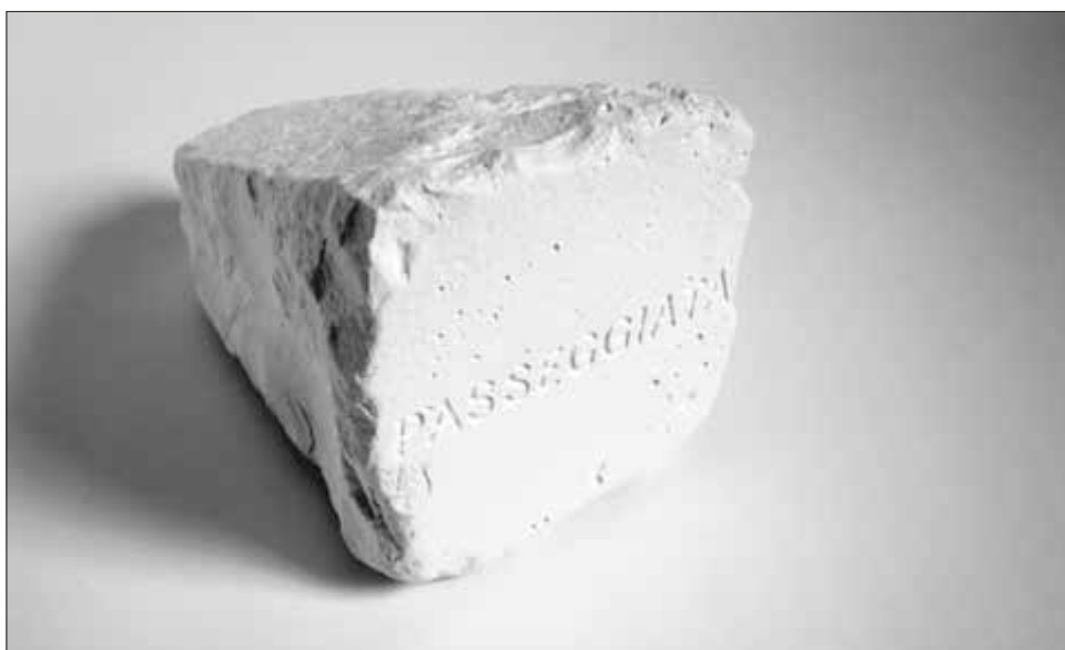
Tots els camins porten a Roma II

econòmic mundial que devasta tot un planeta. Les caminades de l'artista amunt i avall dels turons de Roma, esdevenen així un manifest de geometria variada. Les diferents disposicions dels fragments de lava basàltica inscriuen en la nostra mirada rengleres romboïdals, esteses quadrades i arcs que reivindiquen les mil maneres d'habitar el món. Exercici de llibertat que convida a atrevir-se a agafar la llamborda amb les nostres mans per alliberar-la de la cadena de consum dels touoperadors . Futures barricades on resistir a l'erosió permanent d'una civilització que ja no és capaç de construir nous ponts i camins que salvin les vides que naufraguen, cada un dels nostres dies, a la Mediterrània. ☪