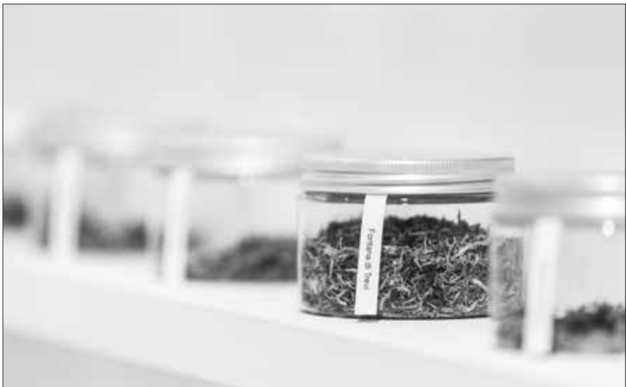
Tutta Roma. Contemplando instantáneas