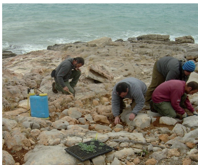
Figura 2. Hábito general de Limonium perplexum y trabajos de plantación dentro del LIC Serra d'Irta (Castellón).

INMACULADA FERRANDO 1,2 , PABLO FERRER-GALLEGO 1,2 , ALBERT NAVARRO 1,2 , MARI C. ESCRIBÁ 1,2 , FRANCISCO ALBERT 1,2 , VÍCTOR MARTÍNEZ 1,2 , PATRICIA PÉREZ ROVIRA 3 , LUZ COCINA ROMERO 4 , SILVIA SÁNCHEZ BOSÓ 4 , MIGUEL ÁNGEL GÓMEZ-SERRANO 1,2 , CARME J. MANSANET 2 Y EMILIO LAGUNA 2