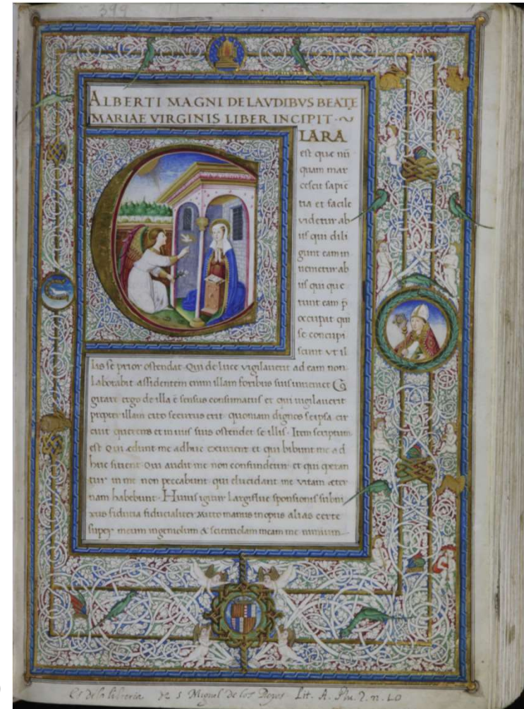
Manuscrito y ex libris del monasterio de San Miguel de los Reyes. BH Ms. 399