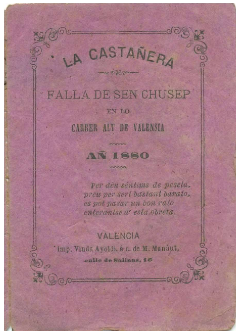
BH LF 3/070