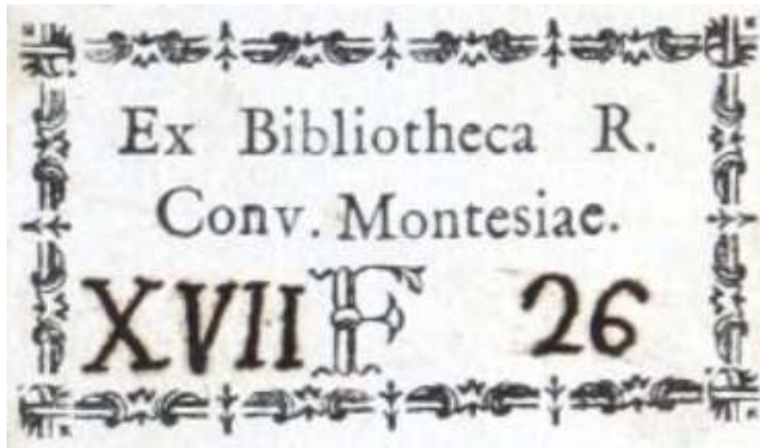
Ex libris del convento de Santa María de Montesa. BH Y-66/074