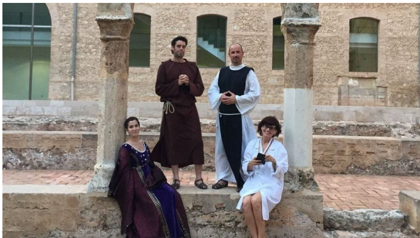
Imagen 3: Las visitas teatralizadas han permitido captar nuevo tipo de público

En una sociedad como la nuestra, a veces no bastan explicaciones profesionales