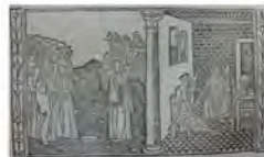
Libro 4 (f. f 4 )