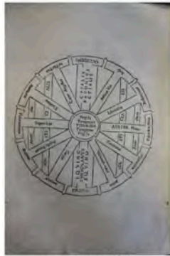
Frontispicio (f. A 4 v)

M.BSM.Parma.1505i Biblioteca del Seminario de Santa Catalina. Mondoñedo.