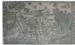
Libro 1 (f. a 4 )