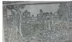
Libro 2 (f. c 4 v)