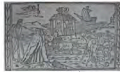
Libro 1 (f. a 4 )