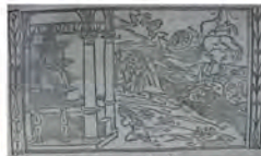
Libro 2 (f. c 4 )