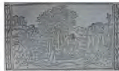
Libro 3 (f. e 4 )