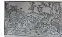
Libro 1 (f. b 4 v)