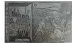
Libro 3 (f. d 4 v)