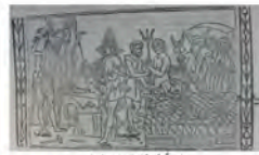
Libro 4 (f. f 4 v)