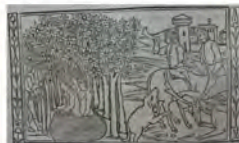
Libro 3 (f. d 4 v)