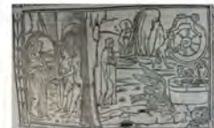
Libro 4 (f. f 4 v)