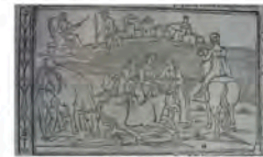
Libro 2 (f. d 4 )