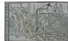
Libro 4 (f. f 4 v)