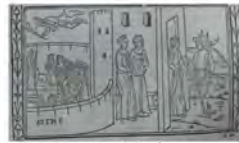
Libro 2 (f. d 4 )