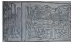
Libro 2 (f. d 4 )