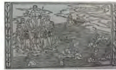
Libro 1 (f. a 4 )