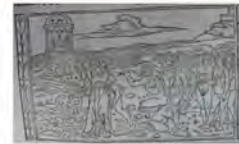
Libro 1 (f. b 4 v)