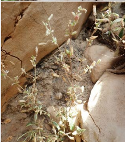
Individuo de Silene sedoides en su hábitat natural en Jávea. a. Final de la fase de floración (2 de junio); b. En fructificación (30 de junio).

Silene sedoides es una pequeña planta anual, de pequeño tamaño (de 4 a 10 cm), con tallos erectos y ramificados desde la base, con hojas gruesas y carnosas. La planta está cubierta de pelos glandulosos que la hacen algo pegajosa, especialmente en su fase adulta. Tiene unas flores de cáliz en forma de tubo, alargado y estrecho de color algo rojizo, y con cinco pétalos libres, emarginados, de color blanco a rosado. Puede presentar cierta variabilidad según las poblaciones.