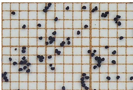
Aspecto morfológico de las semillas de esta especie.

La presente ficha contribuye con datos relevantes sobre la germinación de las semillas de esta especie y el cultivo de las plantas. La muestra con la que se realizó el ensayo fue recogida en Jávea, la única localidad valenciana conocida en estos momentos. Actualmente en el Banco de Germoplasma de Flora Silvestre Valenciana, perteneciente al Jardí Botànic de la Universitat de València, se disponen preservadas semillas de dicha localidad, en condiciones de conservación a largo plazo, humedad relativa del 7% y -20 °C.