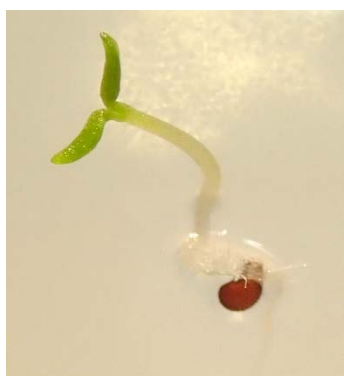
Aspecto de la plántula en su primera fase de desarrollo tras la germinación de la semilla.

Una vez realizada la germinación de la planta, se procedió al repicado de las plántulas en alveolos con un sustrato a base de turbas, y sucesivamente se trasladaron a contenedores de mayor tamaño, en función del desarrollo de la planta.