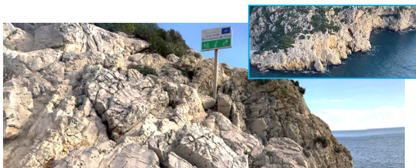
Hábitat natural de Silene sedoides . Localidad correspondiente a la Microrreserva de Flora de "Cova del Llop Marí" en Xàbia.

La planta florece a principios de la primavera, desde marzo a mayo, y el periodo de fructificación se da a finales de esta misma época. Las semillas se pueden recolectar a finales de mayo o principios de junio. La fenología de las plantas anuales puede variar mucho dependiendo de la variación climática interanual.