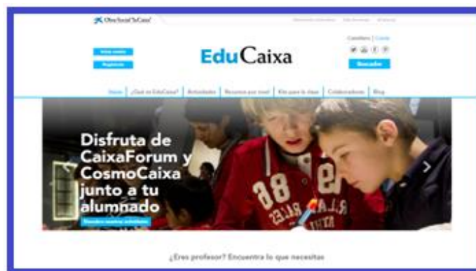
Figura 1. Captura de pantalla de EduCaixa

EduCaixa es una plataforma educativa de la Obra Social "la Caixa", en la que ofrecen recursos didácticos para docentes de los distintos niveles educativos: Educación Infantil, Primaria, Educación Secundaria Obligatoria (ESO), Bachillerato y Ciclos Formativos. Es una plataforma de libre acceso, con la opción de registro para descargar material y participar en actividades que ofertan a la comunidad educativa (Figura 1).