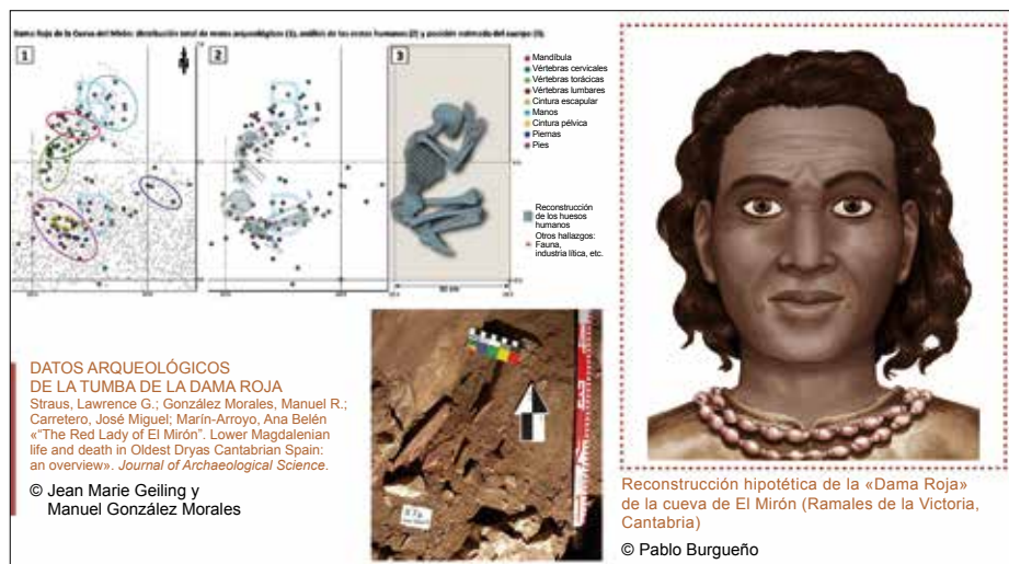
Fig. 2.1 La Dama Roja de El Mirón.

Ya en el Paleolítico Superior, en Asturias, encontramos los restos de una mujer que fue enterrada en la cueva de El Mirón rodeada de ocre rojo. Del estudio de sus restos, de su contexto y de los restos asociados a ella, ha sido posible obtener una información exhaustiva no solo sobre su muerte, sino sobre todo de su vida. Robusta, de fuertes piernas, piel oscura, ojos oscuros, calzaba algo que ahora llamaríamos mocasines y vivía en la montaña, aunque se alimentaba también de recursos marinos, por lo que es posible que se desplazara hasta el mar. No sabemos su función en el grupo, pero sí que quienes la sobrevivieron se preocuparon de su entierro. A partir de los trabajos efectuados, se concluye que la Red Lady de El Mirón «consumió una