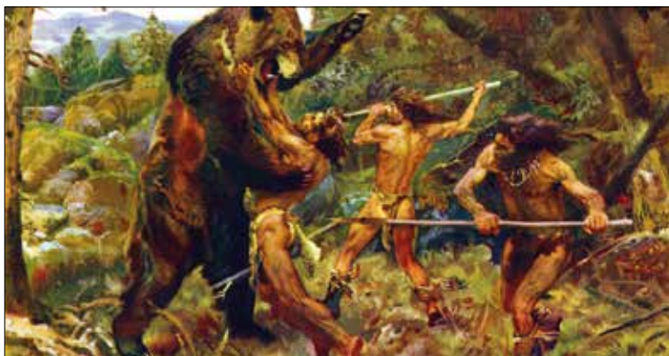
Fig. 1.1 Mito sobre hombre cazador. Ilustración de Znedek Burian (1949).