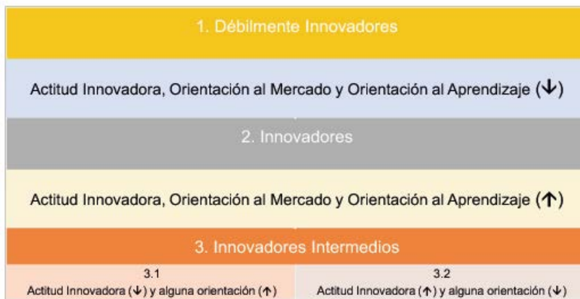
Figura 3. Perfiles de agricultores según su posición en los tres factores de innovación identificador: Orientación al Mercado, Orientación al Aprendizaje y Actitud Innovadora