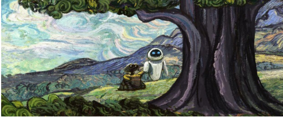
Fotograma 30. EVE y Wall-E se retiran a descansar una vez cumplida su misión. Fuente: Wall-E (Andrew Stanton, 2008).

centralidad de la religión en tal cometido, no parece fortuito que los filmes insistan en este motivo a la hora de plantear la superación de la distopía y la posibilidad de un nuevo «renacer» de la civilización.