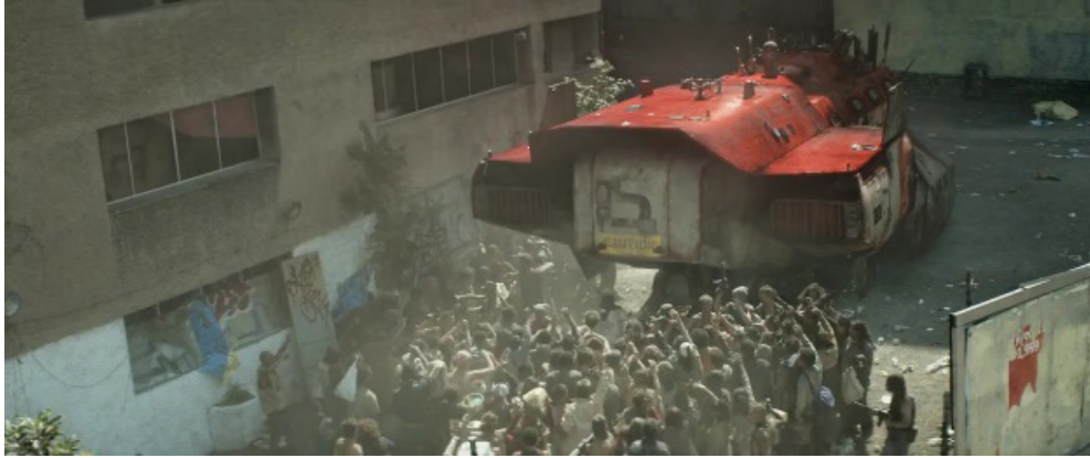
Fotograma 11.