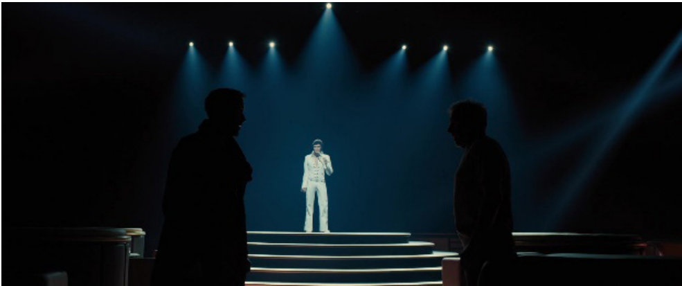
Fotogramas 27 y 28.

un deseo inasible, pero persistente, dirigido hacia el pasado. El filme nos devuelve de esta manera una visión retrotópica en la que el pasado se nos presenta, como en Wall-E o Ready Player One , como el único lugar seguro, obstinado —pese a su brillo ya agonizante— en continuar iluminando el presente.