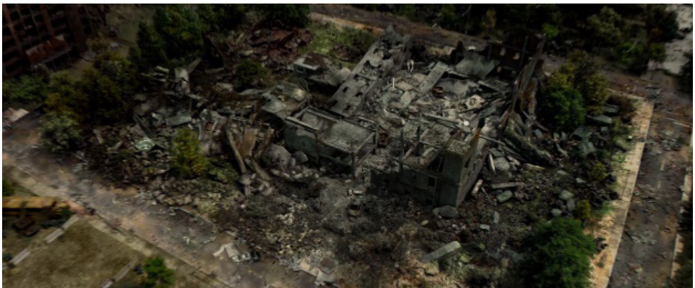
Fotograma 16.