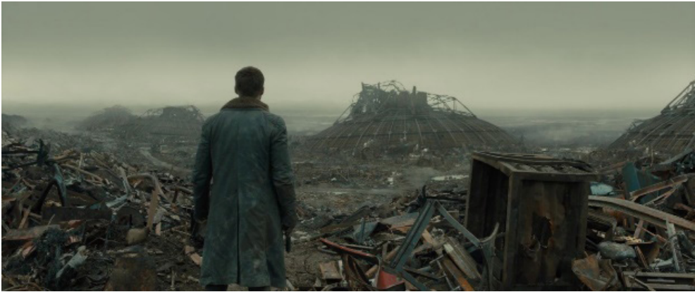
Fotograma 18.

La prominencia de las ruinas en la distopía contemporánea deja constancia, así, del momento decisivo al que nos enfrentamos actualmente, recordándonos la posibilidad de un colapso definitivo de nuestra civilización. En este sentido, la ruina se convierte en sí misma en una referencia al devenir histórico: como apunta Berman (2010, p. 105), las ruinas sirven para proyectar una narrativa sobre la historia, remitiéndonos de manera constante al avance progresista de la misma, bien sea en la forma de escombros (aquello destruido, rechazado, descartado) o en la de las reliquias sepultadas en los mismos (lo perdido u olvidado). Desde este punto de vista, podríamos decir que la insistencia de este tropo en las distopías de nuestros tiempos construye, pues, un relato sobre lo que fue (o sobre lo que será ), pero también sobre lo que podría haber sido (o lo que debería ser ).