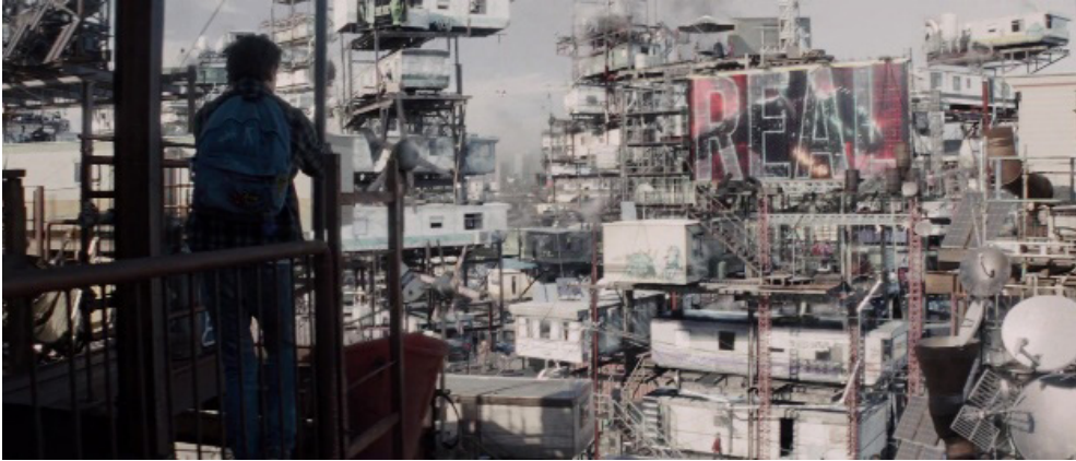
Fotograma 6. Fuente: Ready Player One (Steven Spielberg, 2018).

Junto a estos retrocesos históricos resurge, también, la memoria de las experiencias totalitarias del siglo xx, como una imagen aleccionadora a través de la cual alertar al espectador sobre los riesgos de repetir los mismos errores del pasado. A modo de alerta, las distopías nos devuelven no solo los contundentes reflejos rie-fenstahlianos de los líderes totalitarios de antaño (fotogramas 7 a 9), sino también del Holocausto, en las imágenes paradigmáticas del gueto o del campo de concentración (fotogramas 10 a 12).