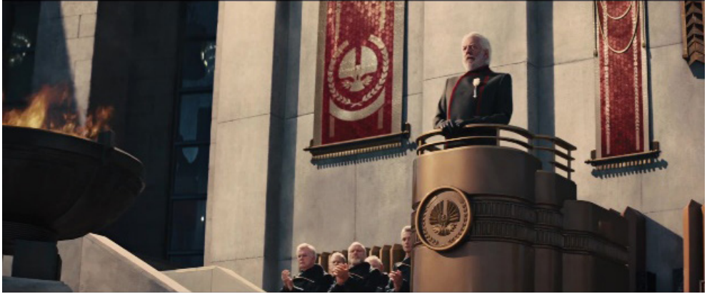
Fotograma 8. Fuente: Los juegos del hambre: En llamas (Francis Lawrence, 2013).