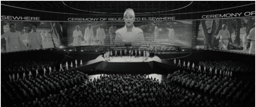
Fotograma 9.