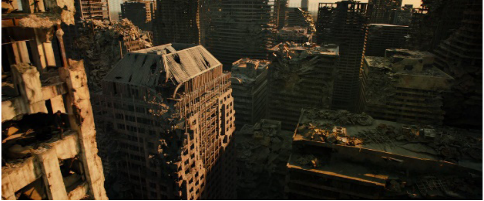
Fotograma 3.