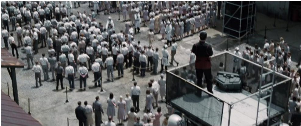
Fotograma 12. Fuente: Los juegos del hambre (Gary Ross, 2012).

Lo anterior nos remite, de alguna manera, a aquella famosa frase con la que Marx (1972, p. 15) encabezaba el capítulo I de El Dieciocho Brumario de Luis Bona- parte : «Hegel dice en alguna parte que todos los grandes hechos y personajes de la historia se producen, como si dijéramos, dos veces. Pero se olvidó de agregar: una vez como tragedia y otra vez como farsa». La cita de Marx —que bien se podría sintetizar en el apócrifo comentario atribuido a Mark Twain, «la historia no se repite, pero rima»—, vale pues para ilustrar la manera en la que se estructuran la mayor parte de los relatos distópicos mainstream de nuestros tiempos, poniendo en evidencia ya no solo nuestra experiencia de las crisis, sino también las lecturas predominantes sobre sus posibles derivas.