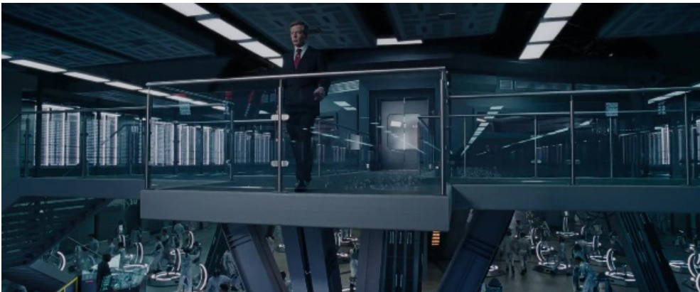
Fotograma 7.

Junto a estos retrocesos históricos resurge, también, la memoria de las experiencias totalitarias del siglo xx, como una imagen aleccionadora a través de la cual alertar al espectador sobre los riesgos de repetir los mismos errores del pasado. A modo de alerta, las distopías nos devuelven no solo los contundentes reflejos rie-fenstahlianos de los líderes totalitarios de antaño (fotogramas 7 a 9), sino también del Holocausto, en las imágenes paradigmáticas del gueto o del campo de concentración (fotogramas 10 a 12).