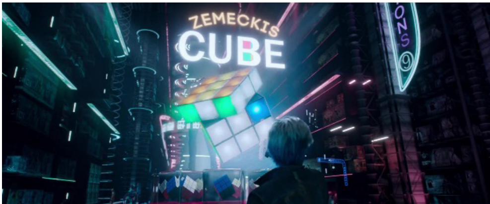
Fotograma 24.

En Ready Player One , este reclamo se encarna en la renovación de las imágenes emblemáticas de antaño que, en tanto que recreaciones virtuales, se nos presentan ahora como mera farsa o simulacro: el codiciado y formidable cubo de rubik que preside la tienda virtual del OASIS —rebautizado ahora como «Zemeckis Cube» debido a su poder para retroceder el tiempo de juego (fotograma 24)—, el tuneardo Delorean que conduce Wade, protagonista del filme (fotograma 25), o el cartel que adorna el taller de Aech (mejor amigo de Wade en el OASIS) que, sesenta años después de la saga de Zemeckis, aún llama a la reelección de Goldie Wilson, primer alcalde afroamericano de Hill Valley (fotograma 26).