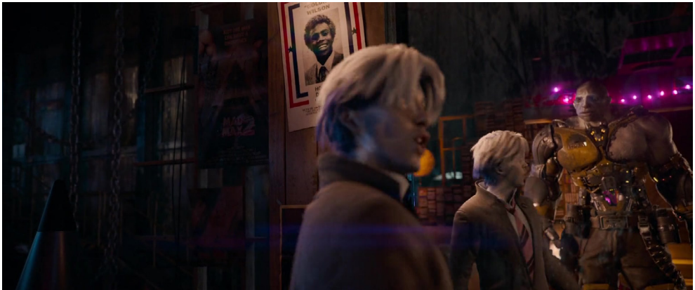
Fotogramas 25 y 26.

Esta apelación a la grandiosidad y espectacularidad del pasado puede observarse, también, en el caso de Blade Runner 2049 (Denis Villeneuve, 2017). En el filme, el agente K se sumerge en los restos de la antigua ciudad de Las Vegas en busca de respuestas a su historia. Allí se topará con el retirado agente Deckard, refugiado y escondido en el interior de un ruinoso casino. Los intentos de evasiva de Deckard los llevará a enfrentarse a golpes de puño, en medio del viejo restaurante. Durante la pelea, las imágenes del pasado iluminarán la escena. Los parpadeantes hologramas de Marilyn Monroe y Elvis Presley (fotogramas 27 y 28), nos remitirán, así, a la idea de un pasado esplendoroso que vuelve, nuevamente, en forma de simulacro.