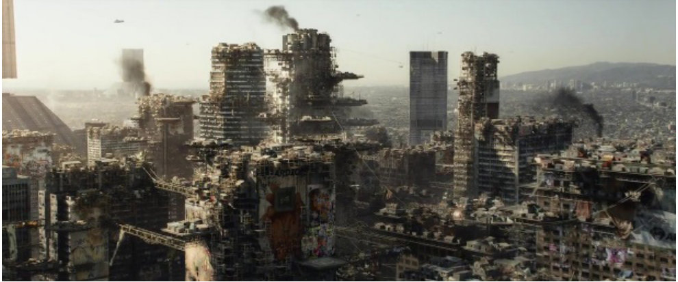
Fotograma 14. Fuente: Elysium (Neill Blomkamp, 2012).