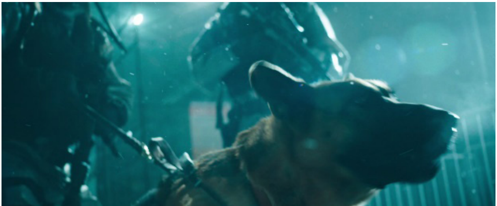
Fotograma 10. Fuente: El corredor del laberinto: Las pruebas (Wes Ball, 2015).