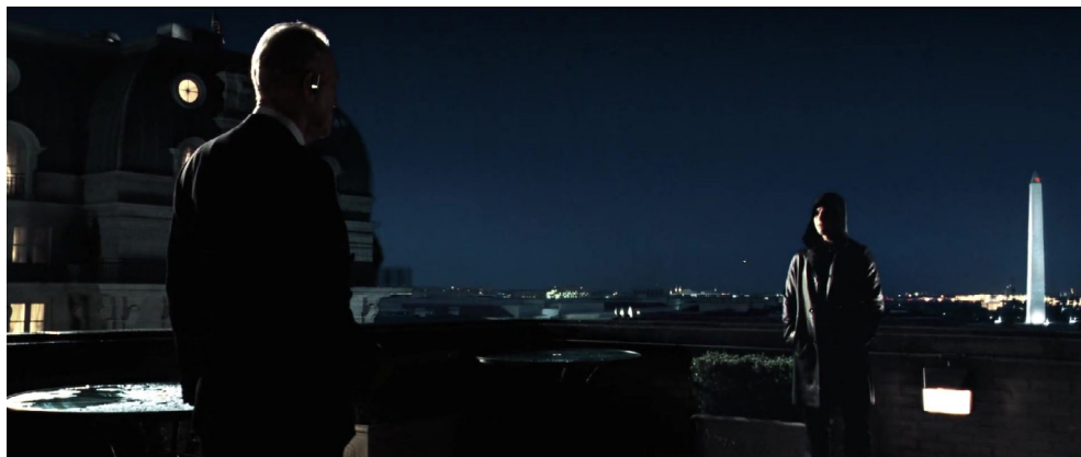
Fotograma 31.

Si bien el planteamiento inicial de Minority Report difiere de la imagen ruinoso del resto de ejemplos aquí analizados, la poderosa estampa del monumento a Washington, nos remite igualmente a un pasado idealizado y reificado —glorificado, esta vez, de manera literal— que se alza como una referencia clave para la superación de la distopía. Referencia que, en la medida en que se erige como homenaje histórico inerte y estático, sirve simplemente como una directriz moral que establece las formas ideales . En este sentido, no es casual que el monumento elegido para ilustrar esta escena nos retrotraiga otra vez a las grandes civilizaciones del pasado (en este caso concreto, a la civilización egipcia). Con esto, la pulsión retrotópica se concretaría en un reclamo del rol de los Estados Unidos como responsable del futuro de la humanidad, en el que la salvaguardia de la misma dependería de la efectiva realización del proyecto liberal (especialmente, como acabamos de ver, de la reafirmación de la libertad individual y de la capacidad de elección).