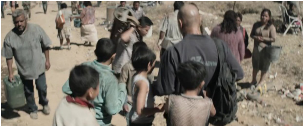
Fotograma 5. Fuente: Elysium (Neill Blomkamp, 2013).