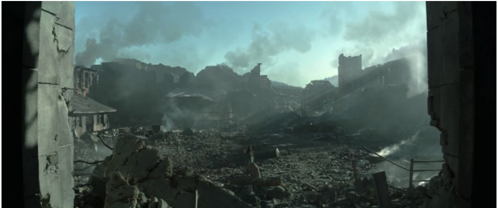
Fotograma 15.