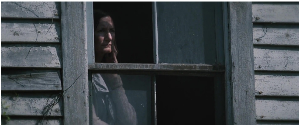
Fotogramas 1 y 2. Fuente: Los juegos del hambre (Gary Ross, 2012).