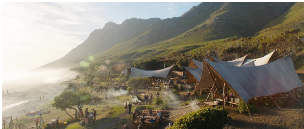
Fotograma 29. «The Safe Heaven», el refugio al que se retiran los jóvenes supervivientes tras la victoria. Fuente: El corredor del laberinto: La cura mortal (Wes Ball, 2018).

En esta línea, conviene recordar que, como señala Aurora Bosch (2005, pp. 3, 7 y 22), la religiosidad común constituyó uno de los elementos más importantes en la cohesión de la identidad nacional estadounidense, no solo en su desafío independentista, sino también en la (auto)reivindicación de su autoridad moral como adalid del mundo civilizado , respaldada en la famosa doctrina del «destino manifiesto». Doctrina que se fundamenta en un supuesto mandato providencial que dictaminaba su derecho a expandirse geográfica, cultural y políticamente, asegurando con ello su «misión civilizadora» (Bosch, 2005, p. 132). Teniendo en cuenta la