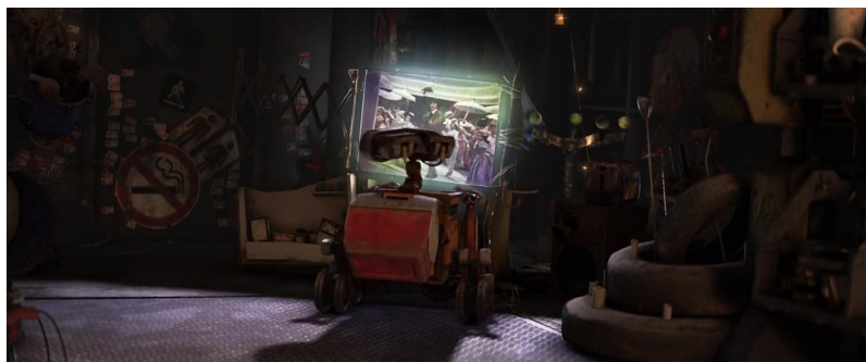
Fotograma 19. Fuente: Wall-E (Andrew Stanton, 2008).

de souvenirs del pasado, recogidos de la basura abandonada por la humanidad en su huida del planeta. Entre la arbitraria colección de Wall-E, su tesoro más preciado lo constituye una copia de la película musical Hello Dolly! (Gene Kelly, 1969), ambientada en la primera «edad dorada» del capitalismo estadounidense (Bosch, 2005, p. 213), veinte años después del final de la guerra civil. El contraste entre el desolado paisaje que rodea a Wall-E y el optimista canto al progreso de Hello Dolly! nos sitúa ante un sentimiento de nostalgia provocado por un pasado que, no casualmente, acaba convertido en lo único que ilumina el oscuro y cochambroso refugio de nuestro protagonista (fotograma 19).