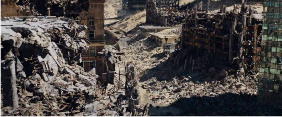
Fotograma 17.