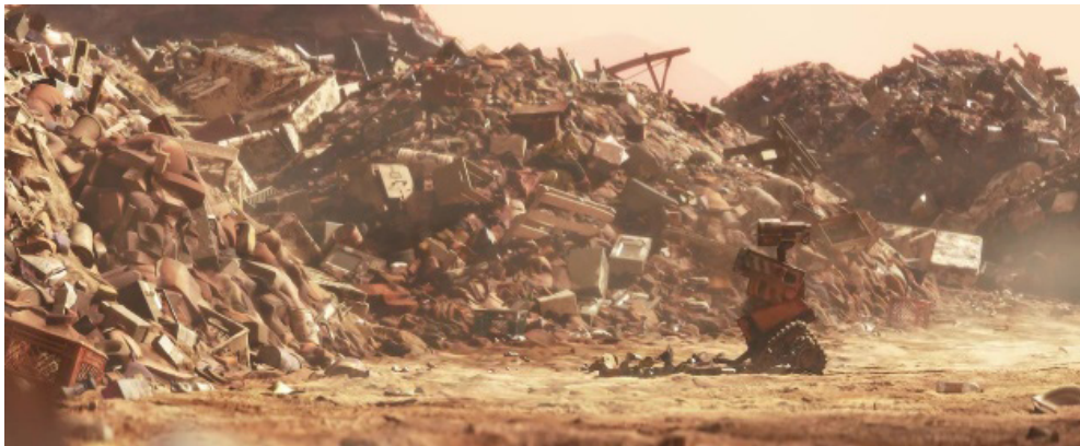
Fotograma 13.

Sin ánimo de abrir un debate sobre los límites genéricos de la distopía —en especial, en aquello que la diferencia del género «postapocalíptico»— resulta al menos llamativo que buena parte de los escenarios distópicos de nuestros días se sirvan de la ruina y la destrucción como elemento predominante. La imagen de la debacle civilizatoria como consecuencia directa de las crisis antes comentadas nos revela, ya en los primeros minutos de estos filmes, el aciago porvenir al que parece abocarnos nuestro presente, en una clara advertencia y llamado a la reflexión (fotogramas 13 a 18).