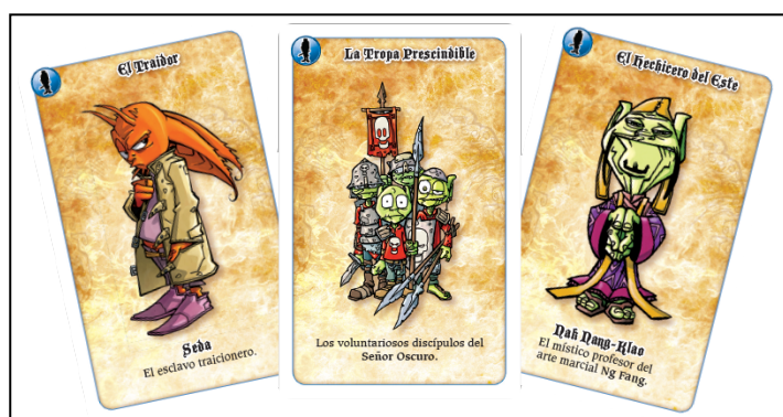
Imagen 2: Ejemplo de cartas de excusa (juego Si, señor oscuro)

La SD se implementó en tres cursos de 1.º de Bachillerato con un total de 60 estudiantes. La primera sesión se dedicó a la toma de contacto con la argumentación a partir del juego Sí señor oscuro (se explicará más adelante, § 4.1), cuyo leitmotiv principal consiste en que unos lacayos den buenas excusas a su jefe, el Señor oscuro, para justificar el fracaso de una misión.