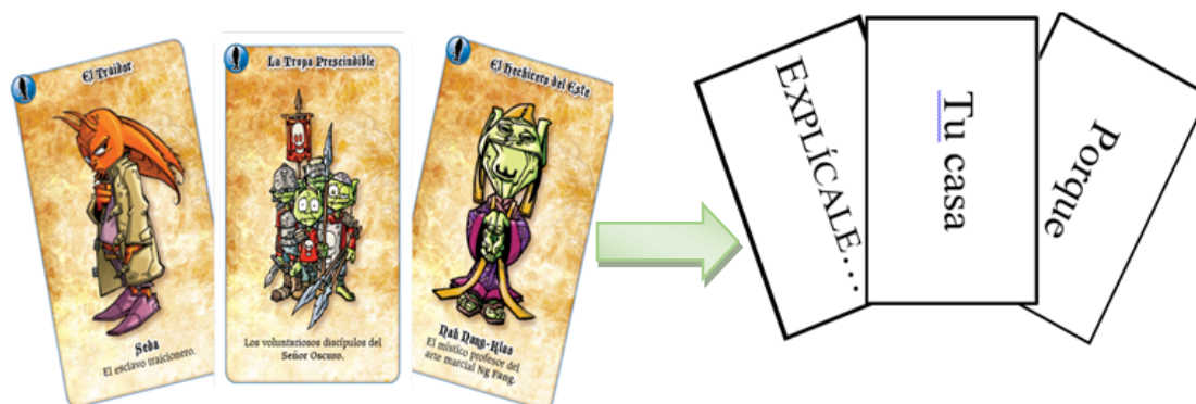
Imagen 6: Transformación a la didáctica de ELE del juego Sí, señor oscuro

contexto distendido, cercano y quizás más cómodo. Por lo tanto, el alumnado trabajará mediante este juego la argumentación a partir de la propia argumentación: