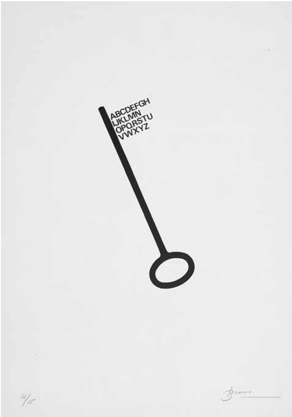
Joan Brossa, Poema visual , concebut 1971-realitzat 1982. Imatge reproduïda a Joan Brossa o la revolta poètica (M. Guerrero ed.). Barcelona, Fundació Joan Brossa / Departament de Cultura / Fundació Joan Miró, 2001, p. 146