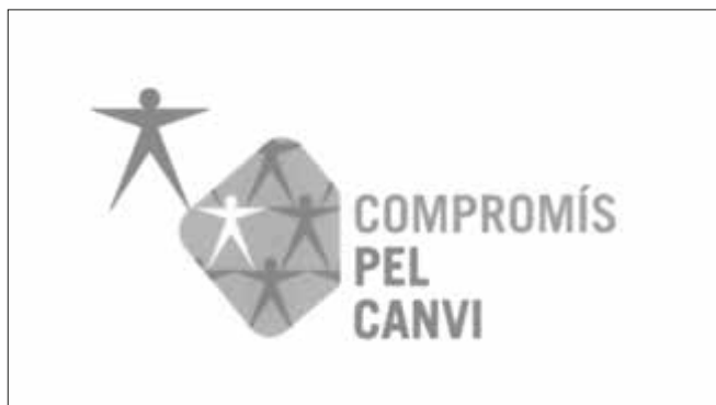
Primer logotip del projecte Compromís. VpC. Gener de 2006.