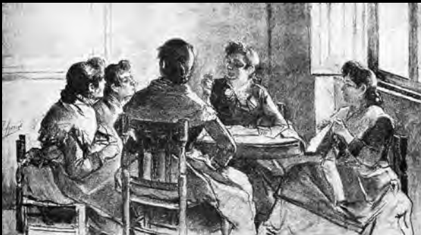
Joaquín Agrasot, Historias de Taller . «La Il·lustració Artística», 1892. | Joaquín Agrasot, Historias de Taller . «La Ilustración Artística», 1892