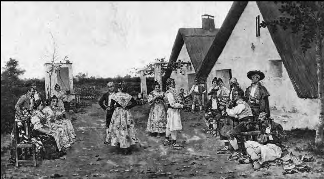
Joaquín Agrasot. Preludio de baile . «La Il·lustració Artística», 1899. | Joaquín Agrasot. Preludio de baile . «La Il·lustració Artística», 1899.