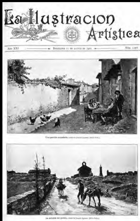
Obra de Joaquín Agrasot a «La Ilustración Española y Americana», 11 d'agost de 1902. | Obra de Joaquín Agrasot en «La Ilustración Española y Americana», 11 de agosto de 1902.