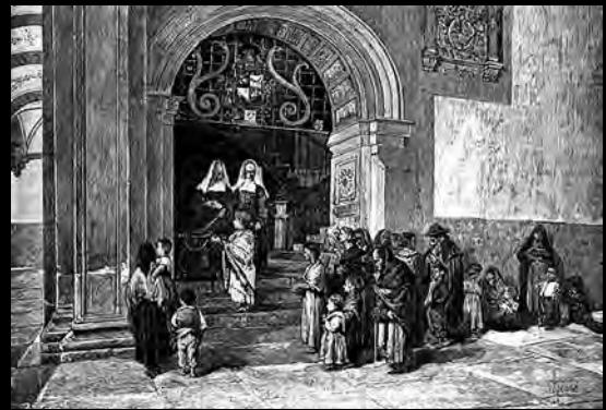
Joaquín Agrasot. La repartició de la sopa . «La Il·lustración Artística», 1892. | Joaquín Agrasot. La repartición de la sopa . «La Il·lustración Artística», 1892.