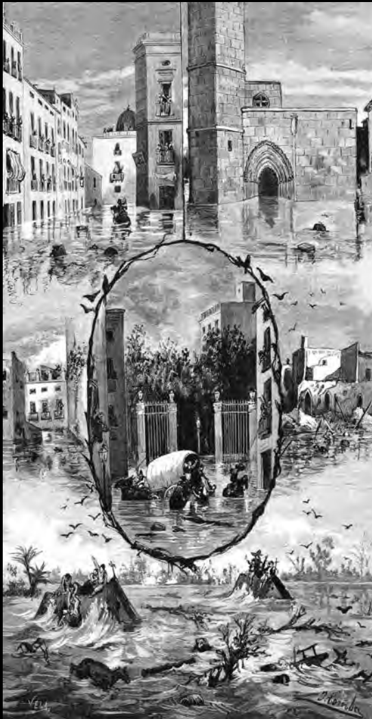
La inundació a Oriola. Croquis remesos pel Sr. Agrasot. «La Ilustración Española y Americana», núm. XL, 30 octubre 1879 | La inundación en Orihuela. Croquis remitidos por el Sr. Agrasot. «La Ilustración Española y Americana», núm. XL, 30 octubre 1879.