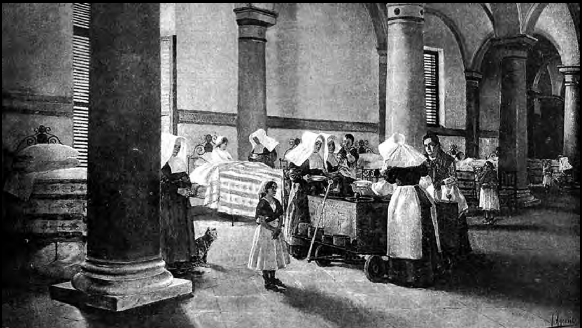
Joaquín Agrasot. Hermanas de la Caridad . «La Il·lustración Artística», 1892. | Joaquín Agrasot. Hermanas de la Caridad . «La Il·lustración Artística», 1892.