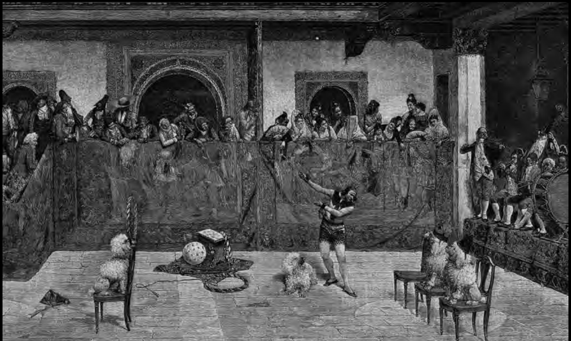
Joaquín Agrasot. Los perros sabios . «La Ilustración Artística», 1892. | Joaquín Agrasot. Los perros sabios . «La Ilustración Artística», 1892.