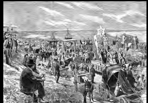
Joaquín Agrasot, Festa dels artistes a Roma . «La Il·lustració de Madrid», 1872 | Joaquín Agrasot, Fiesta de los artistas en Roma . «La Ilustración de Madrid», 1872.