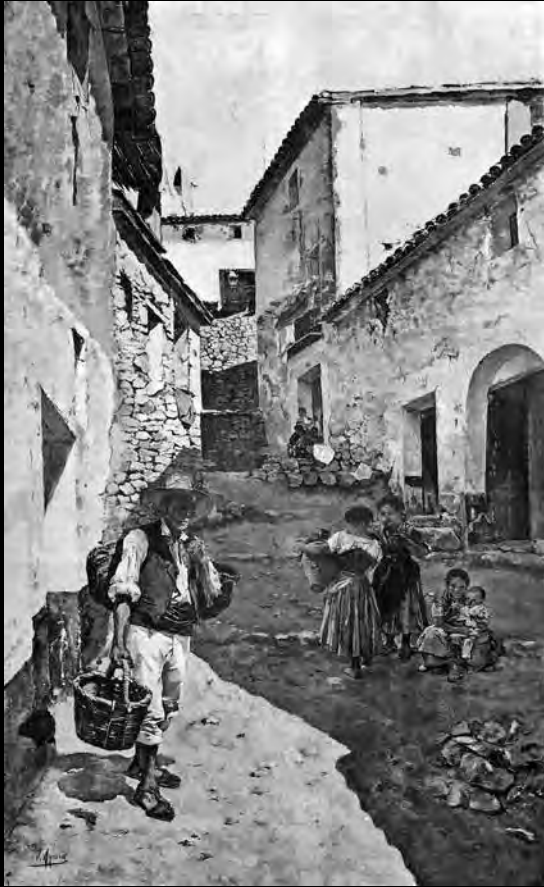
Joaquín Agrasot, Un Rincón de mi pueblo. «La Il·lustració Artística», 1899. | Joaquín Agrasot, Un Rincón de mi pueblo. «La Il·lustració Artística», 1899.