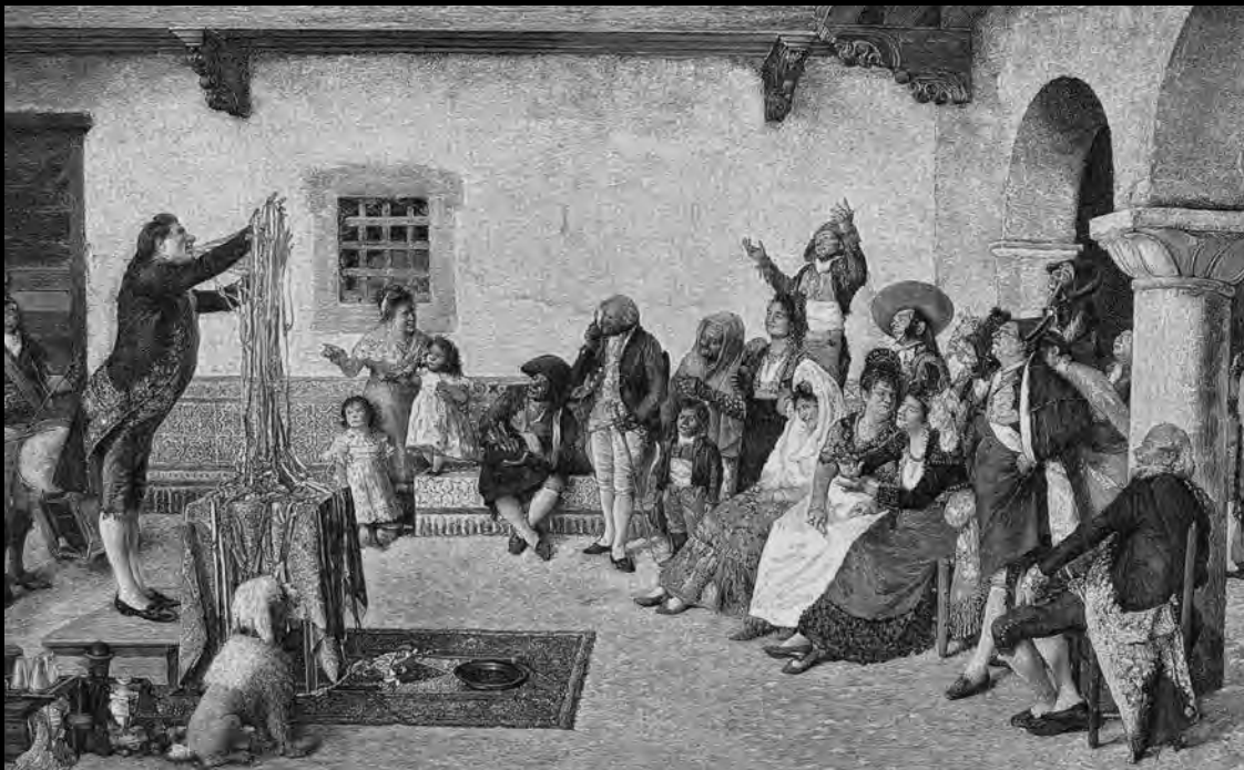
Joaquín Agrasot. El charlatán o El Prestidigitador. «La Ilustración Artística», 1892. | Joaquín Agrasot. El charlatán o El Prestidigitador. «La Ilustración Artística», 1892.