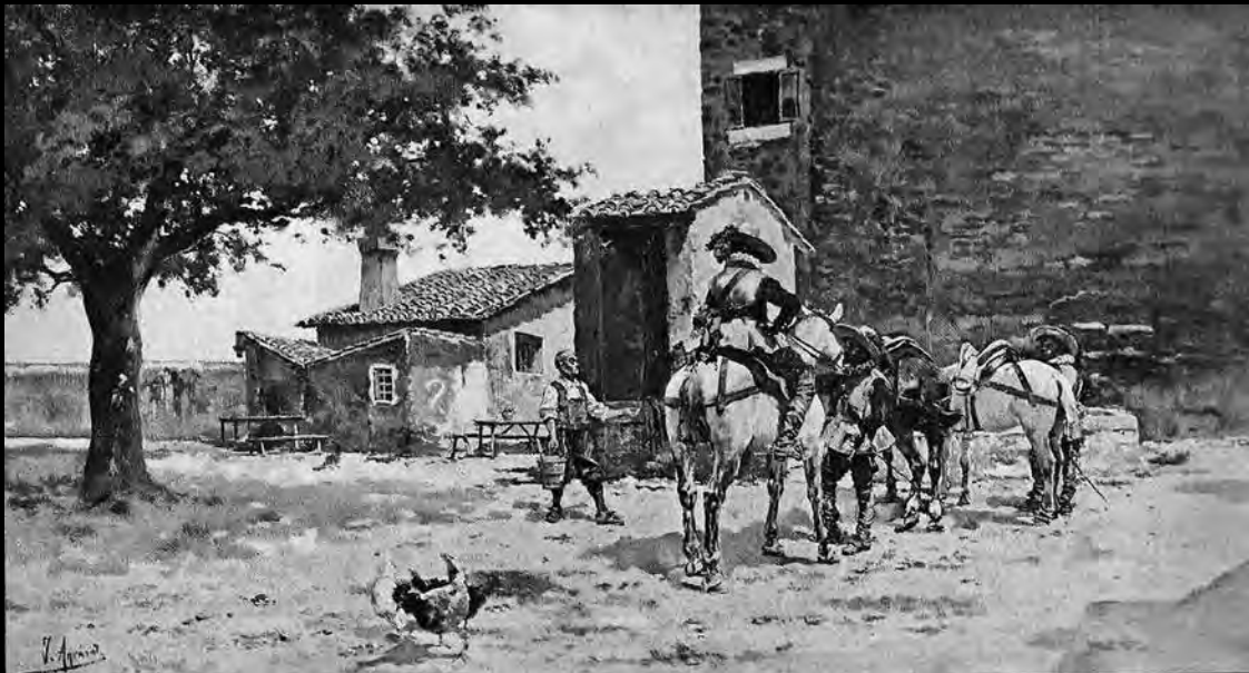
Joaquín Agrasot. La primera etapa. «La Ilustración Artística», 1897. | Joaquín Agrasot. La primera etapa. «La Ilustración Artística», 1897.