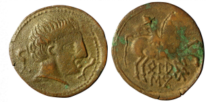
The British Museum