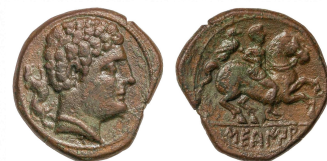
Soler y Llach & Hervera | 2019-10-23 | 110

R/ Jinete, con cetro en su mano dcha. y águila posada en su extremo, a dcha. | Leyenda bajo línea ΜΕΑΝΩΡ (sekeiza)