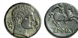
Fritz Rudolf Kunker | 2018-10-08 | 312

A/ Cabeza masculina, con manto y torques, a dcha. Delfin ⚡ (bel) R/ Jinete, con palma, a dcha. | Leyenda bajo línea ⚡⚡⚡⚡ (kontebakom) ACIP 1594 | CNH 242/1 | Vives 39/7 El manto apenas está indicado con una línea por encima del corte del cuello