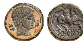
Áureo & Calicó | 2008-10-29 | 213, Colección Barcino

A/ Cabeza masculina, con collar, a dcha. Delfin ⚡ (bel) R/ Jinete, con palma, a dcha. | Leyenda bajo línea ⚡⚡⚡⚡ (kontebakom)