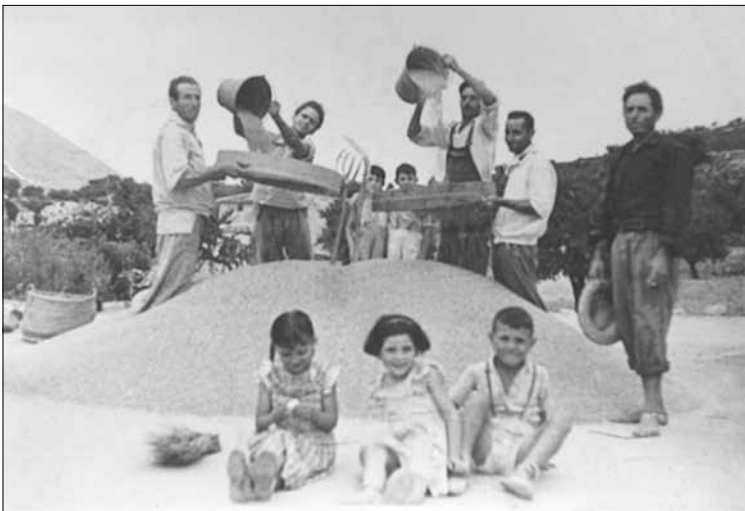
Xiquets jugant un dia de batuda.

Les terres de Gines han encarnat la tríada mediterrània: blat, vi i oli. Les vinyes varen desaparèixer amb la fil·loxera, però n'han restat traces silencioses: cups, bótes velles, esportins podrits encara amb olor a vinassa; també hi ha cups de vi i botdegues en ruïnes. El blat fa temps que ha desaparegut: trenta anys?, quaranta? El cereal va lligat a la batuda els dies més forts de l'estiu, quan el sol queia a plom. Els homes es posaven mocador al cap, com els moros, fins cobrir-se el bescoll. Mentre treballaven entonaven cançons i veien trotar els animals amb lleugeresa. De tant en tant, agafaven el tiràs i amuntegaven el blat. Les garbes estaven ordenades geomètricament. (També la terra donava pas a l'artifici, a l'art arbitrari.)