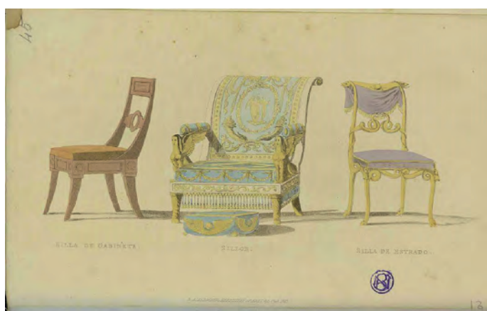
Fig. 4. Silla de gabinete, sillón y silla de estrado. Figurines Ingleses. Edición para España 1824-25. Biblioteca Nacional de España.

cen diversas reseñas sobre este estilo: “en la calle de Silva frente al Banco Nacional, se venden sillas á la Inglesa, con brazos de ultima moda, campapés, y sofás, todo con equidad”. 68