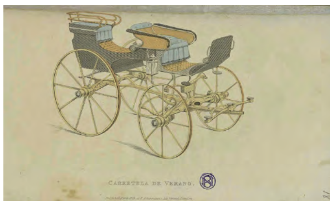
Fig. 3. Carretela de verano. Figurines Ingleses. Edición para España 1824-25. Biblioteca Nacional de España.

Este elegante carruaje está mui en uso en Inglaterra, sobre todo durante la estación en que los Señores y ricos propietarios residen en sus casas de campo. Cuando quieren divertirse en manejar las riendas, se colocan en el asiento delantero, y cuando no, en el otro. De él se sirven también para ir a cazar, y