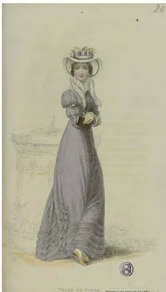
Fig. 5. Traje de paseo. Figurines Ingleses. Edición para España 1824-25. Biblioteca Nacional de España.