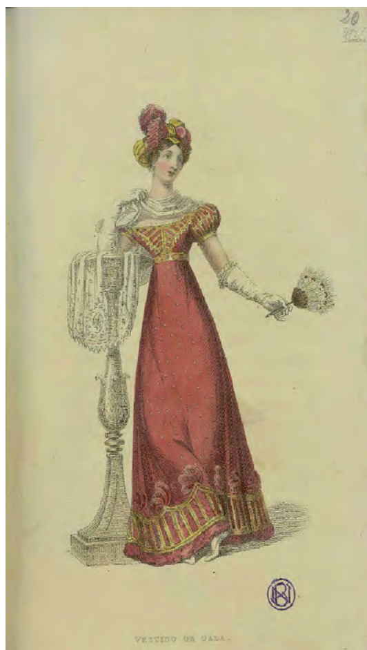
Fig. 6. Vestido de gala. Figurines Ingleses. Edición para España 1824-25. Biblioteca Nacional de España.

traje de crespon de china punzó con lentejuelas de oro; sobrepuestos de encage de oro, en el pecho hasta los hombros; guarnicion ancha de lo mismo; manga corta terminada del mismo modo. Turbante de crespon del color del traje y oro, con buches de raso punzó; pluma de este color al lado derecho; pañolon de encage blanco; pendientes, braceletes y collar de perlas; guantes de Francia y zapato de raso blanco. 72