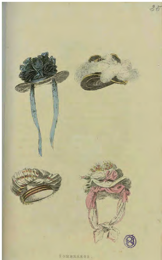
Fig. 1. Sombreros. Figurines Ingleses . Edición para España 1824-25. Biblioteca Nacional de España.

a que en España –por varios sucesos que a continuación detallaremos– sí que se desarrolló un singular gusto por lo inglés desde los primeros años del siglo XIX, el cual quedó plasmado en esas estampas procedentes de París y Londres.