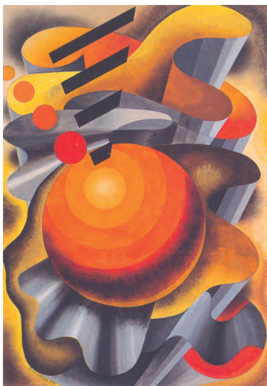
Fig. 4. Nicolai Diulgheroff, Aeropittura , 1932, Guache/cartón, 50,5 x 35,5 cm. Museo di Arte Moderna e Contemporanea di Trento e Rovereto, Rovereto.

Con una mirada retrospectiva, el manifesto reconocía las aportaciones de Buzzi, Folgore y Carli en literatura, así como las de Azari y Dottori en pintura. Las nueve tesis establecían una realidad dinámica y perenne que eliminaría la referencia a los detalles que había caracterizado la pintura clásica. La aeropittura que “encierra simultáneamente el doble movimiento del aeroplano y de la mano del pintor” hacía referencia al concepto de aniquilación del espacio-tiempo de los años heroicos señalando que “el tiempo y el espacio son pulverizados por la fulminante constatación de que la tierra corre rapidísimo bajo el aeroplano inmóvil”.