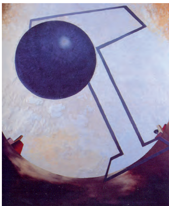
Fig. 5. Fillia, Più pesante dell'area , 1933-34. Óleo/tela, 160 x 130 cm. Colección privada.

Mino Delle Site exploró la vía descriptiva y documental. Se unió al grupo futurista en la Prima Mostra di Aeropittura de Roma. Promocionado por Prampolini realizó su primera individual en Galleria Bragaglia Fuori Commercio de Roma en 1932, cuyo catálogo reconocía que,