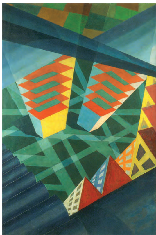
Fig. 1. Fedele Azari, Prospettive di volo , 1926, Óleo/tela, 120 x 80 cm. Colección privada

saba por medio de ruidos y onomatopeyas era el argumento de la pieza de Mario Carli L'intervista con un Caproni ("L'Italia Futurista" a. I, n° 10, Florencia, 15 de noviembre de 1916), 21 una obra, por otra parte, que sería germen de políticas posteriores: "absorbo el azul y lo transformo en acero... vrrr... así compacto no temo a la muerte... soy la misma muerte nacida del odio enorme del mundo: un pensamiento de muerte modelado en el acero". 22