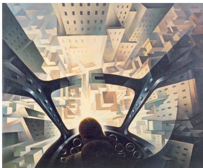
Fig. 6. Tullio Crali, In tuffo sulla città , 1939, Óleo/tela, 130 x 155 cm. Museo di Arte Moderna e Contemporanea di Trento e Rovereto, Rovereto.

Será Fillia quien iniciará el desplazamiento de lo aeropictórico a lo sagrado. El futurismo había cambiado respecto al beligerante discurso religioso de los años diez y, condicionado por sus ideas religiosas, pretendía renovar el arte sagrado desde una perspectiva contemporánea. Los futuristas turineses entendieron la sacralización de la máquina como una nueva deidad, siendo el tránsito de lo mecánico a lo espiritual un campo abonado para la aeropintura. Marinetti y Fillia publicaron el manifiesto Arte Sacro Futurista ("La Gazzetta del Popolo", Turín, 23 de junio de 1931), que ido-