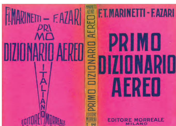
Fig. 2. Primo dizionario aereo italiano . Filippo Tommaso Marinetti y Fedele Azari, Milán: Morreale, 1929.

roporti (1925) “una búsqueda de términos de analogismo plástico de fuerte imaginación espacial y densa implicación cromática”. 27