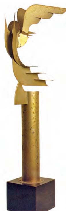
Fig. 7. Thayaht (Ernesto Michahelles), La vittoria dell'aria , 1931, Hierro y aluminio pintado, 68 x 20 x 14 cm. Colección CLM.

de 1929, pero que se vio absorbido por la dinámica grupal que empujaba en la dirección única de la retórica política.