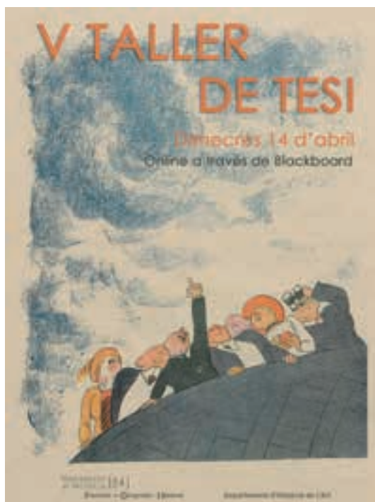
Cartel del V Taller de tesis, Experiencias para doctorandos en Historia del arte.

En el Departament d'Història de l'Art de la Universitat de València tenemos la fortuna de contar anualmente con más de una veintena de miembros del personal investigador en formación vinculados al programa de doctorado, gracias a que obtienen la exigente beca formativa a través de las convocatorias competitivas del Ministerio, la Generalitat Valenciana o la Universitat de València.