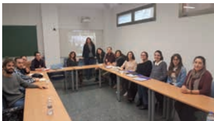
Grupo de trabajo en los “Talleres para una docencia universitaria con perspectiva de género aplicado a la Historia del Arte” celebrados a finales de 2019.