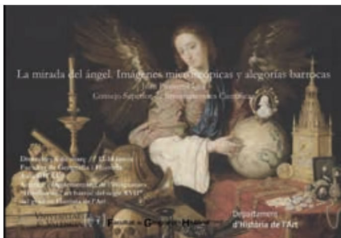
Cartel de la conferencia “La mirada del ángel. Imágenes microscópicas y alegorías barrocas” impartida por Juan Pimentel.