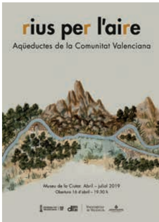
Cartel de la exposición Rius per l'aire. Aqüeductes de la Comunitat Valenciana .