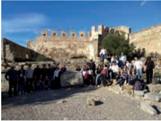
Visita a la ciudad de Sagunto.