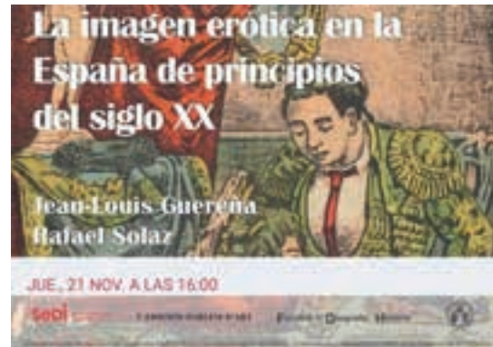
Cartel de "La imagen erótica en la España de principios del siglo XX" en Parlem d'Art .