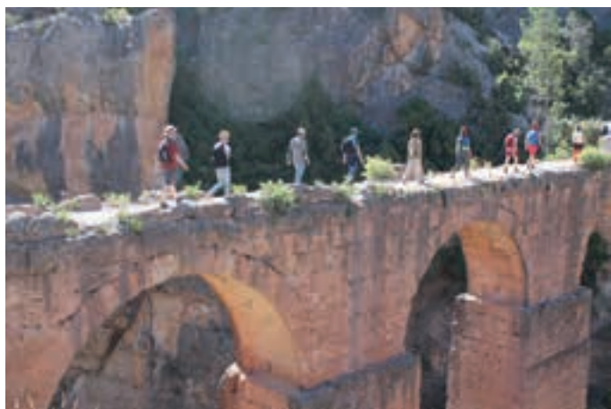
Paseo por Peña Cortada organizado por la Cátedra Demetrio Ribes.

Por otro lado, en 2019 se realizaron las dos primeras ediciones de los "Paseos por la Obra Pública" : visitas a emblemáticas obras donde especialistas en la materia aportan conocimiento de forma didáctica y amena. Estas acciones recayeron en el acueducto de Peña Cortada y en el antiguo Depósito de Aguas de València.