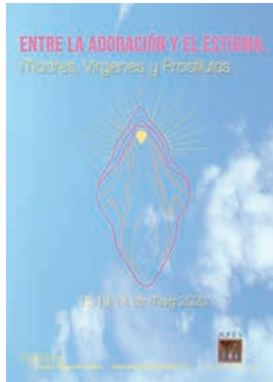
Cartel del seminario Entre la adoración y el estigma celebrado online.