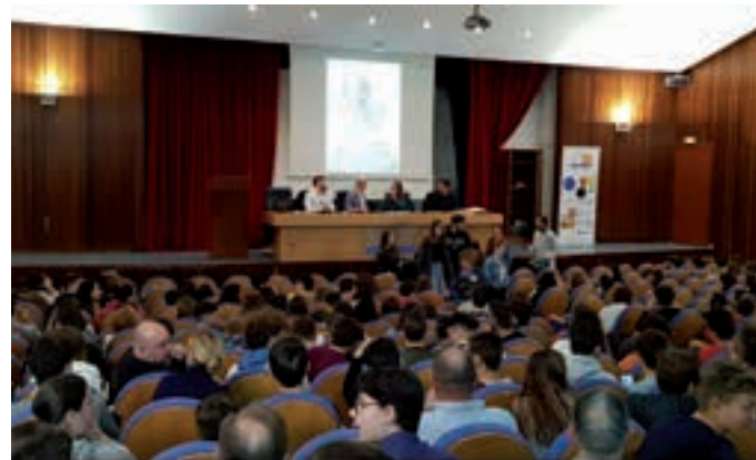
Celebración de las Olimpiadas de Historia del Arte en la Sala Joan Fuster de la Facultat de Geografia i Història.