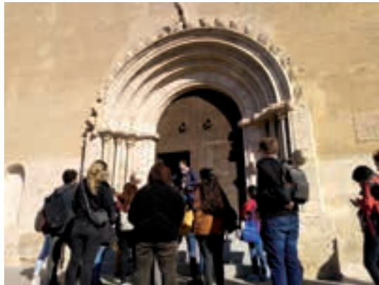
Visita a la iglesia de la Sangre, Llíria.