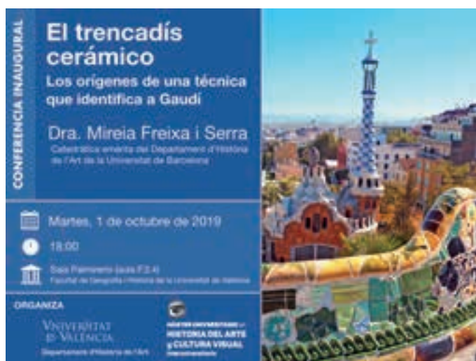
Cartel de la conferencia inaugural del Máster en Historia del Arte y Cultura Visual impartida por Mireia Freixa.

El 1 de octubre de 2019 tuvo lugar la conferencia inaugural de la undécima edición del Máster a cargo de Mireia Freixa, catedrática emérita de la Universi-