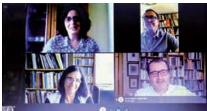
Reunión virtual de la Comisión de Coordinación Académica del Máster en Historia del Arte y Cultura Visual en mayo de 2020.