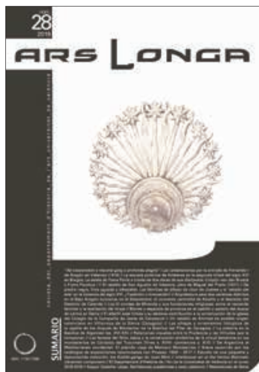
Portada del número 28 de la revista Ars Longa, Cuadernos de Arte .