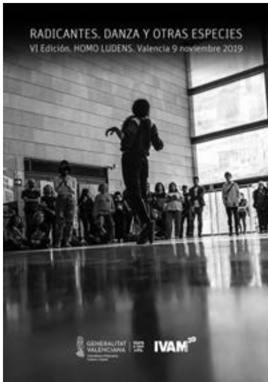
Cartel del ciclo Radicantes. Danza y otras especies. Homo ludens realizado en el IVAM.

En lo referente a encuentros científicos organizados o con participación del personal de nuestro Departamento en el seno de la Facultat, se debe citar que el 16 de octubre de 2019, Pangaea –Asociación de jóvenes investigadores de la Facultat de Geografia e Història– organizó el II Seminario Procesos: investigaciones a debate , con la partici-