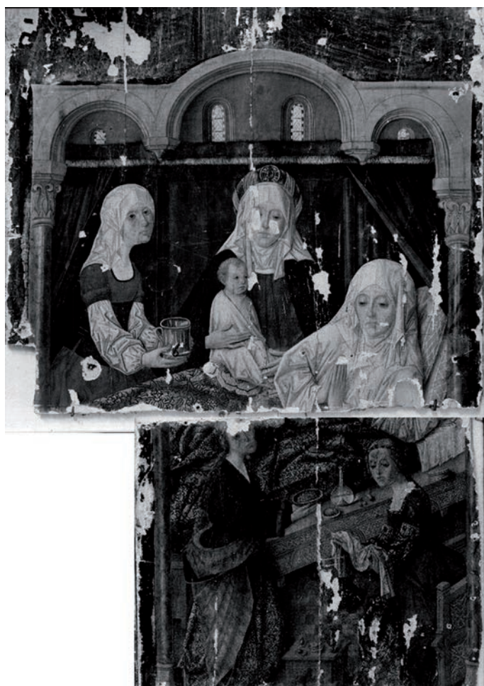
Fig. 3. Maestro anónimo(?), Nacimiento de la Virgen, finales del siglo XV. Antes de la restauración.

Por último, sería necesario en este sentido recordar el encargo de Mencía de Mendoza, marquesa