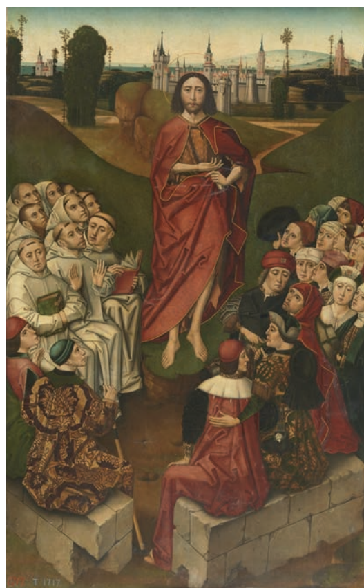
Fig. 2. Juan de Segovia (Maestro de Miraflores), Predicación de san Juan Bautista, ca. 1490-1500, técnica mixta sobre tabla, Museo Nacional del Prado.