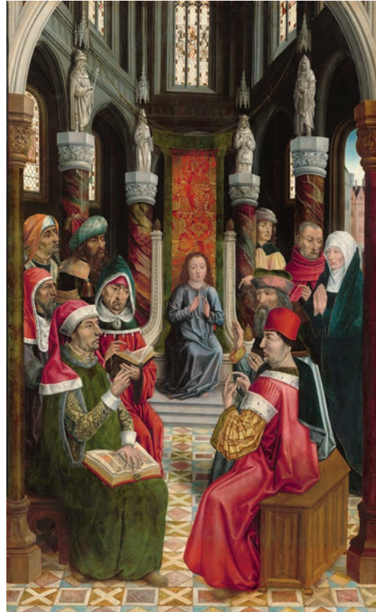
Fig. 4. Maestro de los Reyes Católicos, Presentación en el templo y Cristo entre los doctores, ca. 1495-1497. Óleo sobre tabla, Harvard University Art Museum (Fogg Museum. 1933.29 https://www.harvardartmuseums.org/ ) y National Gallery of Washington (Samuel H. Kress Collection. 1952.5.43).

En esta misma línea de investigación, se debe de citar algunas de las tablas del retablo de la infancia de Cristo del llamado maestro de los Reyes Católicos, conservado fragmentadamente en los museos de san Francisco Museum of Fine Arts, University of Arizona Museum of Art –Tucson–, Denver Art Museum, private collection-England-, National Gallery of Art of Washington, y Harvard University Art Museum-Fogg Art Museum. Específicamente destacan las tablas de Cristo entre los doctores (fig. 4. National Gallery of Washington) y la presentación de Cristo en el templo (fig. 4. Fogg Art Museum-Harvard University Art Museum) en el que al-