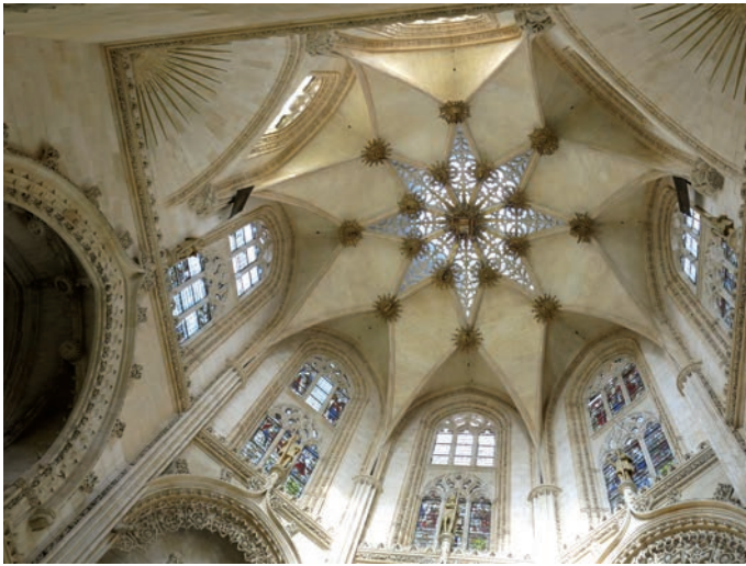
Fig. 1. Capilla del Condestable o de la Purificación de la Virgen, catedral de Burgos.