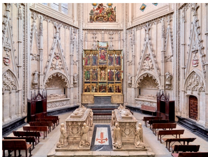
Fig. 6. Capilla de Álvaro de Luna, Catedral Primada de Toledo.